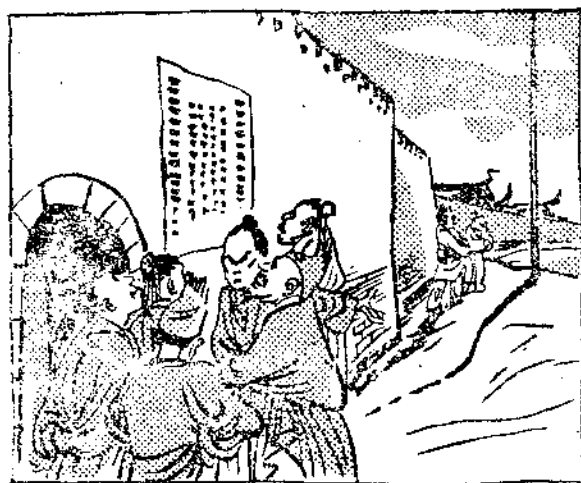
商 鞅 立 木

有一天，秦國的南門，聚攏了一大圈人，都在伸頸踴躍地看貼在城牆上的一張佈告，上面寫着：