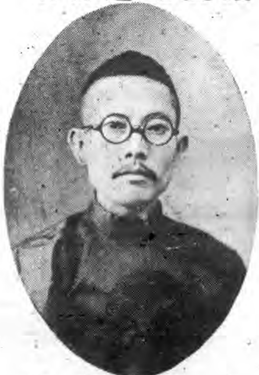
由 英 屬 選 出