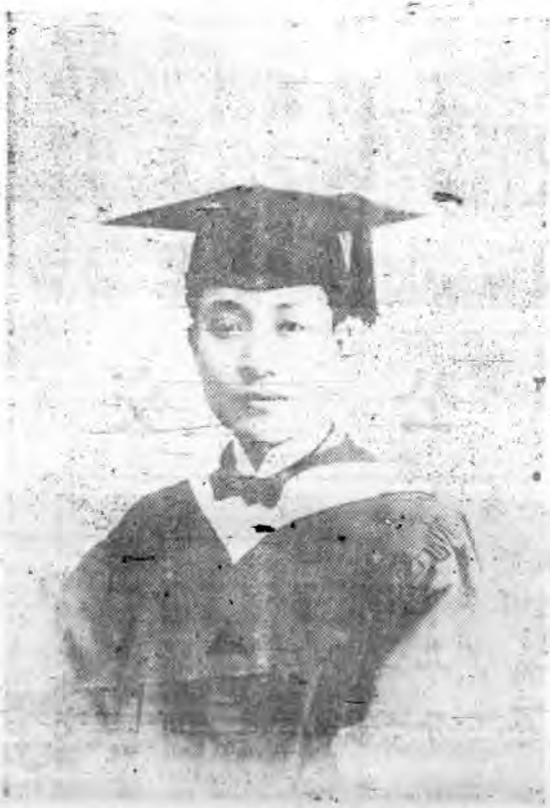
越南華僑學業北大第一學人