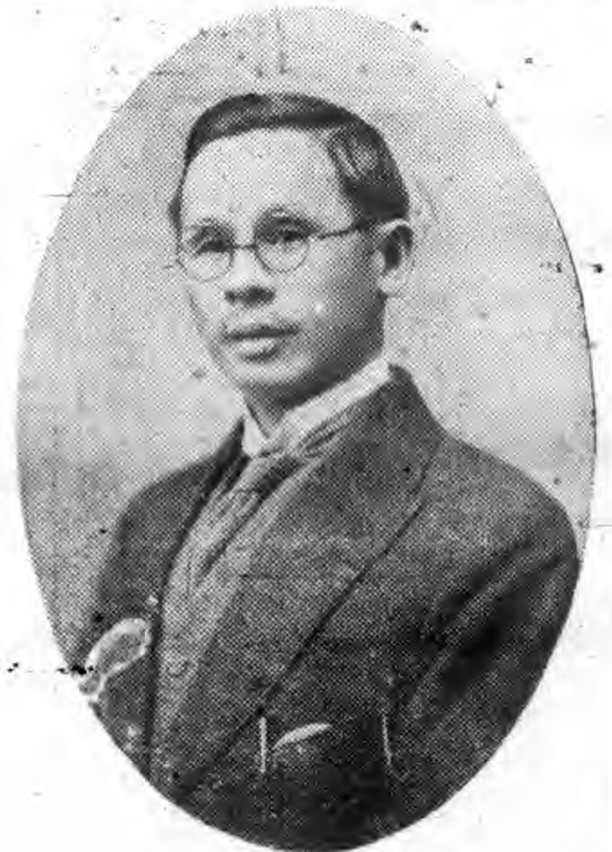
由 荷 屬 選 出