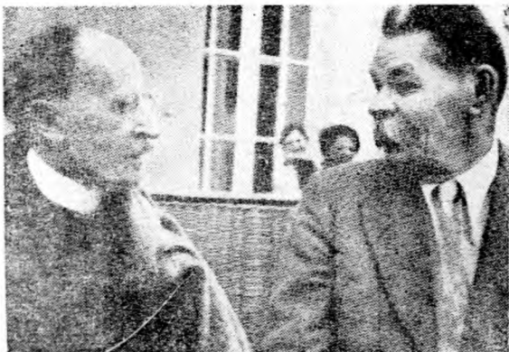
一九三五年羅曼·羅蘭 與高爾基合影