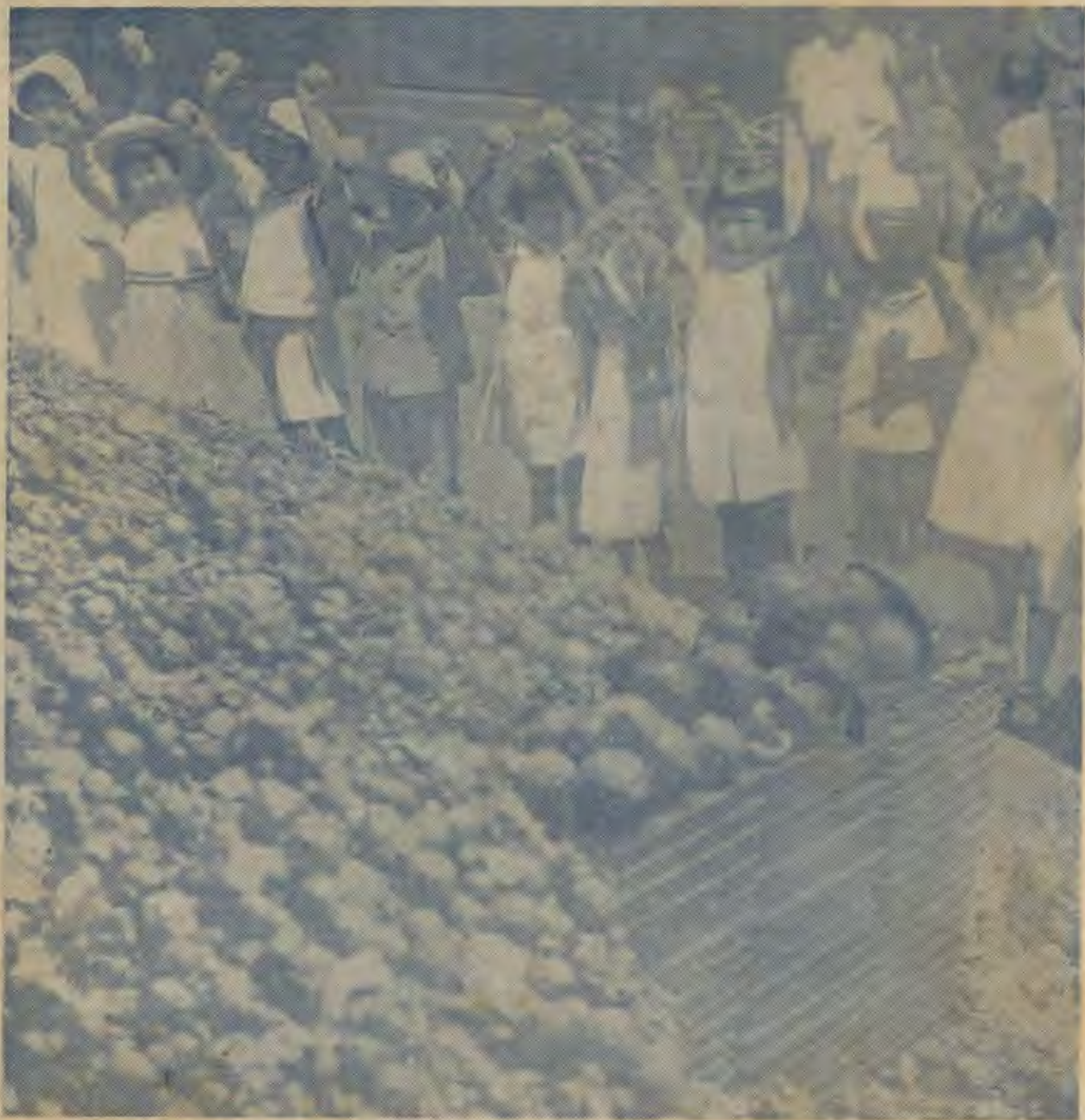
機飛買購後錢金得換圈祇錫的集搜所日平聚積童兒本日