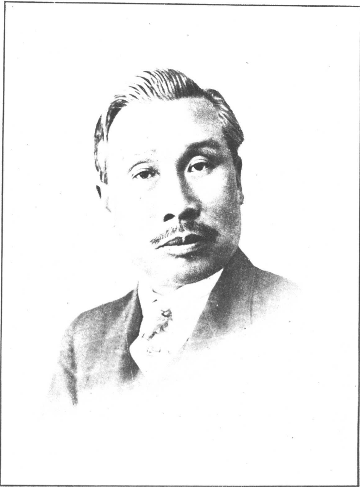
相我之年四十國民