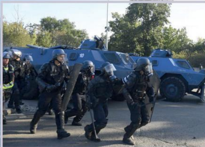
Практичні навчання здійснюються за двома напрямками: виконання завдань спеціального призначення та охорона громадського порядку під час проведення масових заходів

України французькі жандарми не використовують важку бронетехніку чи артилерію – лише стрілецьку зброю та спецзасоби – зокрема, для відстрілювання світлошумових гранат та гранат зі слезоточивим газом. Практично вся зброя – німецького виробника Heckler & Koch GmbH і австрійського Glock. Штатними пістолетами жандармів є SIG Sauer Pro та Glock 17. Також на озброєнні іноземних колег перебувають пістолети-кулемети Heckler & Koch MP5 та НК UMP і французька штурмова гвинтівка FAMAS.