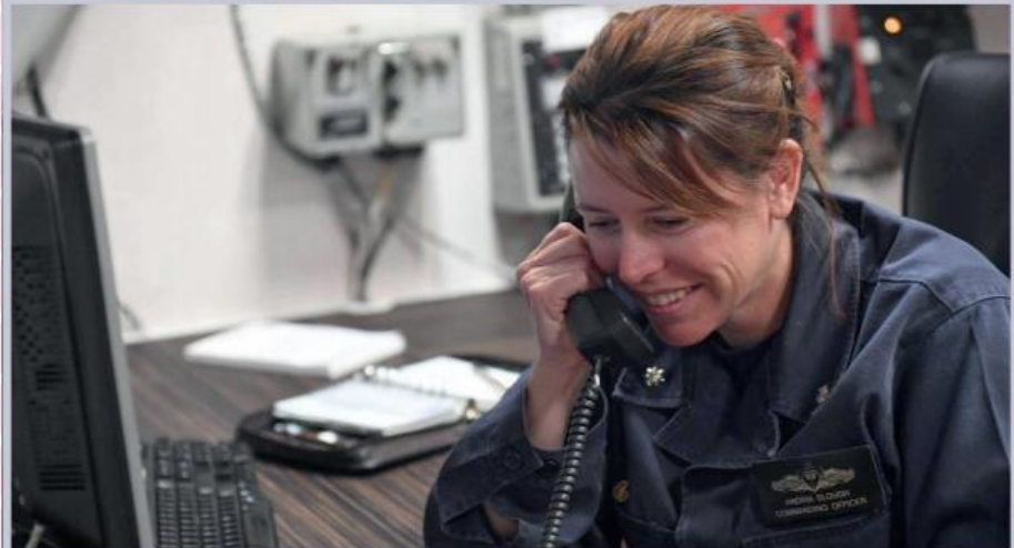
Командер Андрія Слау приймає вітання президента США Д. Трампа із успішним виконанням бойового завдання

У Німеччині ситуація із правом жінок захищати рідну землю наступна. В період з 1933 до 1945 року вони не могли бути військовослужбовцями, однак понад півмільйона жінок служили у різного роду допоміжних службах Вермахту та СС. Після поразки у Другій світовій країну, як відомо, було поділено на «капіталістичну» Федеративну Республіку Німеччину