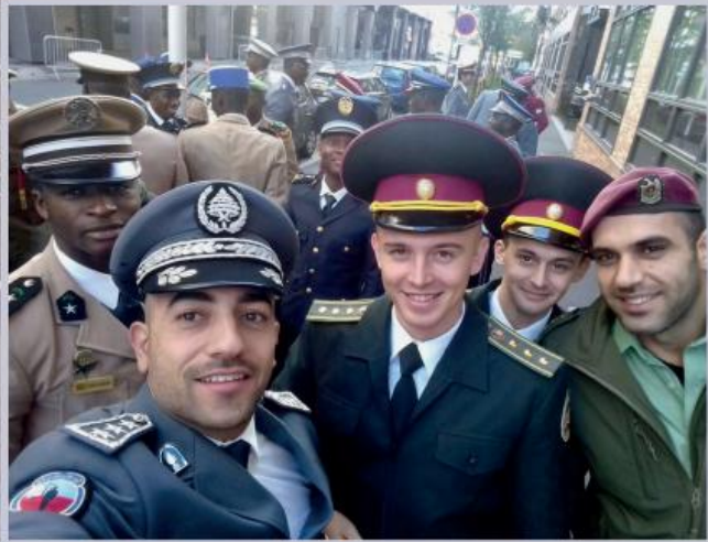
На «Курсах для капітанів» навчаються представники майже двадцяти країн

ції виконує функції кримінальної поліції. Підрозділи департаментської жандармерії займаються розкриттям злочинів, превентивною діяльністю, дізнанням та різного роду розслідуваннями.