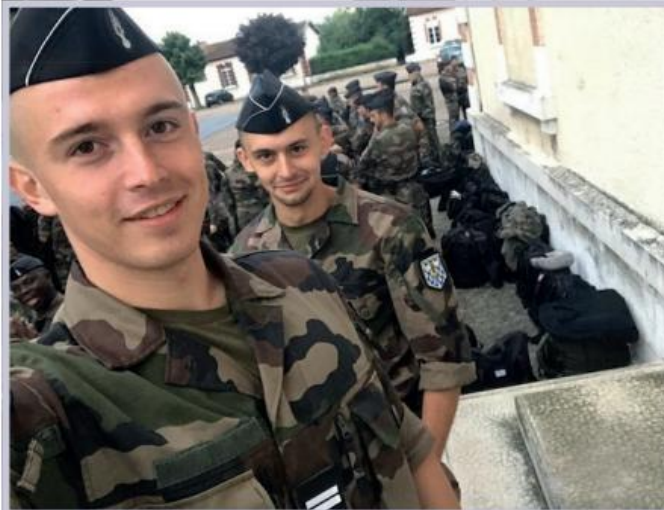
Кожному слухачеві незалежно від громадянства та належності до військово-правоохоронних формувань інших країн видається повний комплект форми одягу Національної жандармерії Франції

навчаються й іноземці. Багато офіцерів приїжджають із країн, які до середини минулого століття були членами Французької співдружності. Так називалась політична організація, до якої входили колишні французькі колонії. Попри те, що ці країни (в основному, африканські) вже давно отримали незалежність, вплив Франції там і досі відчутний. Вони запозичили у метрополії адміністративну і правову систему, та й мову французьку не забули. Також серед слухачів «Курсів для капітанів» – офіцери силових структур інших країн, які підтримують із Національною жандармерією Франції партнерські стосунки: України, Туреччини, Палестини, Лівану... Загалом кількість країн, чії представники прибули минулого року до Школи офіцерів у Мелені, сягає двох десятків