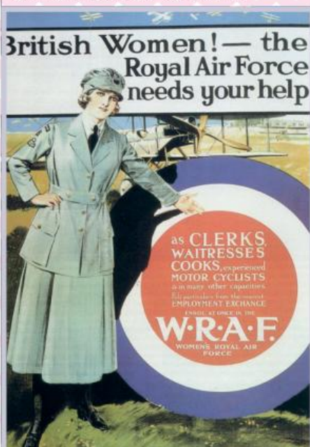
Агітаційний плакат Жіночих королівських Військово-повітряних сил часів Першої світової війни

У 60-70-х роках минулого століття чимало військових формувань різних країн стали професійними – призов на строкову службу поступово обмежувався або