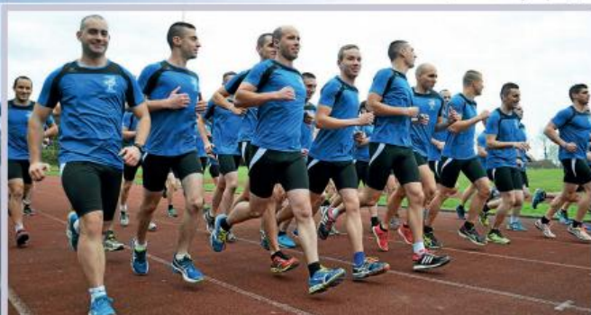
Фізпідготовці та спорту у Школі офіцерів Національної жандармерії Франції традиційно приділяють значну увагу

Слухачі курсів живуть у окремих кімнатах в офіцерському гуртожитку на