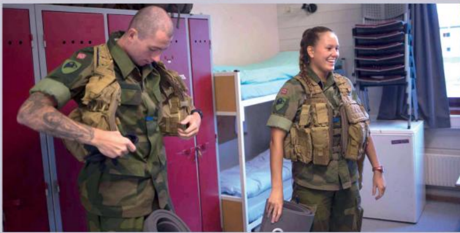
У Норвегії строкову служать як хлопці, так і дівчата, причому, проживають всі солдати у загальних казармах

взагалі скасовувався, а комплектування особовим складом відбувалося на добровільній основі. Кількість жінок-військовослужбовців стала помітно зростати.