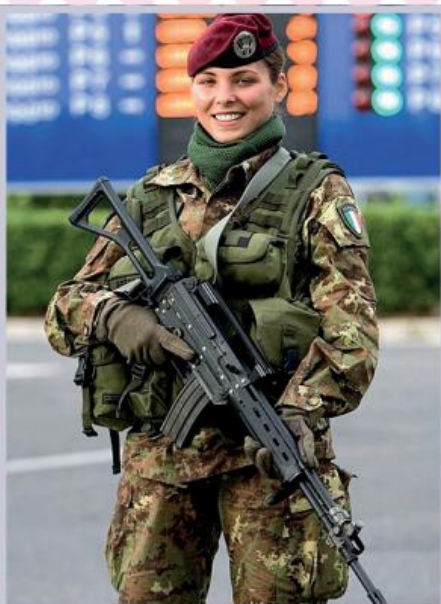
Десантниця із італійської парашутної бригади «Фальгоре» охороняє громадський порядок під час Зимової олімпіади в Турині 2006 року