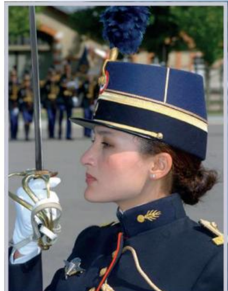
В комплект парадної форми кожного жандарма входить офіцерська шабля

Значну увагу у Школі офіцерів Національної жандармерії Франції приділяють і вивченню технічних засобів зв'язку та інших способів обміну даними. Звісно, тут навчаються вже досвідчені фахівці – діючі офіцери, за чікими плечима – роки