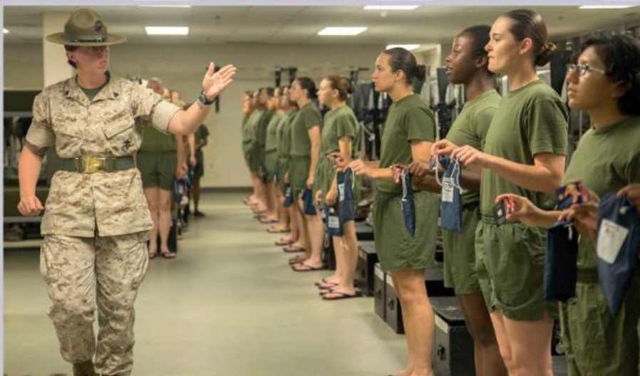
Шикуння рекрутів Корпусу морської піхоти США, що проходять підготовку на тренувальній базі «Перріс Айленд», перед відбоем

В США до 1948 року жінки могли виконувати військовий обов'язок лише у воєнний час і лише в складі розгорнутих на цей період допоміжних формувань. Із прийняттям Конгресом закону «Про інтеграцію жінок до складу Збройних Сил» комплектування війська жінками стало здійснюватись і у мирний період. Однак про гендерне рівноправ'я при цьому не йшлося. Жінки не мали права обіймати велику кількість посад – скажімо, льотного складу бойової авіації чи плавскладу бойових кораблів. Не могли вони й мати у підлеглості військовослужбовців-чоловіків і прагнути високих чинів. Тобто, теоретично «жіночих корпусів» не існувало, але зрозуміло, що з часів Другої світової