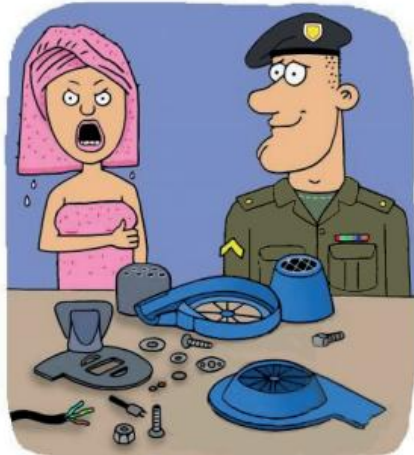
Мені все одно, як швидко ти його збереш. Я хочу зараз висушити волосся!

Розумна жінка навіть своїм мовчанням може спричинити у чоловіка паніку. Адже вона не просто мовчить, вона про щось мовчить!