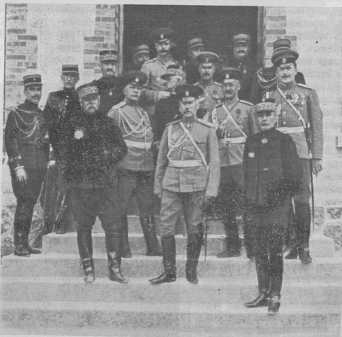
Къ поѣздкѣ Начальника Генеральнаго Штаба во Францію. Генераль Жилинскій съ сопровождавшими его офицерами и французскіе генералы.

Этотъ планъ для того, чтобы родиться на свѣтъ, долженъ былъ быть созданъ чернилами, а на осуществленіе этого плана,