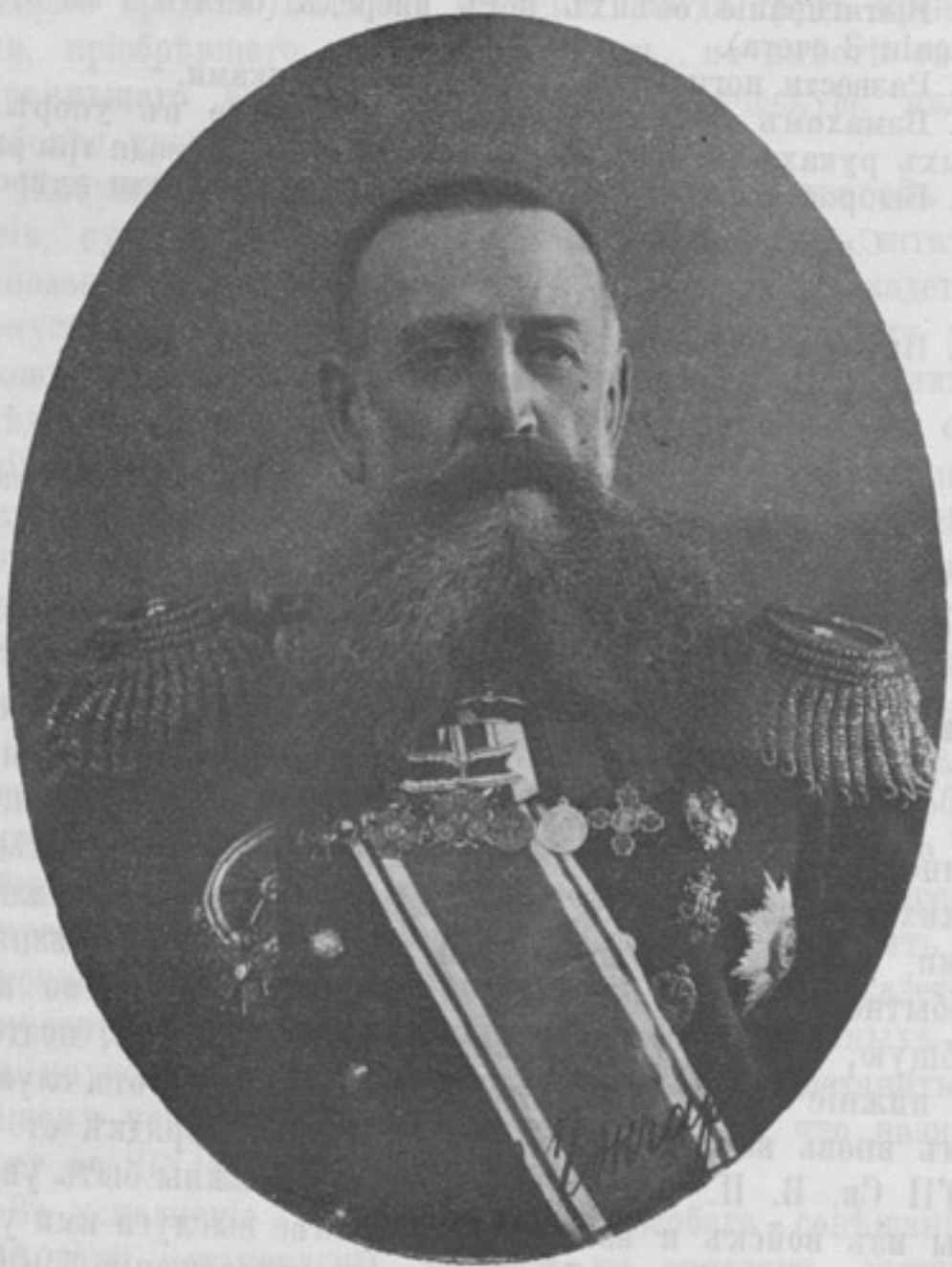
Помощникъ начальника артил. Одесск. воен. окр., генераль-маіоръ Андрей Юрьевичъ ГОНЧАРЕНКО.

СОДЕРЖАНІЕ: Портретъ генераль-маіора Андрея Юрьевича Гончаренко.—Распоряженія по военному вѣдомству.—Хроника.—Болѣзнь арміи. Г. Алексеевъ. —Еще о военныхъ чиновникахъ. Семенъ Михеевъ. —Годъ времени. Юсъ Славянский. —Аттестациі въ артиллеріи—какъ лишеніе чина. А. К. —Необходимая льгота меньшей братіи. Л. Радусъ-Зенковичъ. —Офицеры-восточники и офицеры-переводчики. Синъ Ко. —О распредѣленіи по ротамъ окончившихъ учебную команду. Энде. —Существенныя мелочи. Дм. Б—ій. —Обзоръ печати.—Иностранныя арміи.—Корреспонденціи.—Почтовый ящикъ.—Объявленія.—Высочайше приказы.