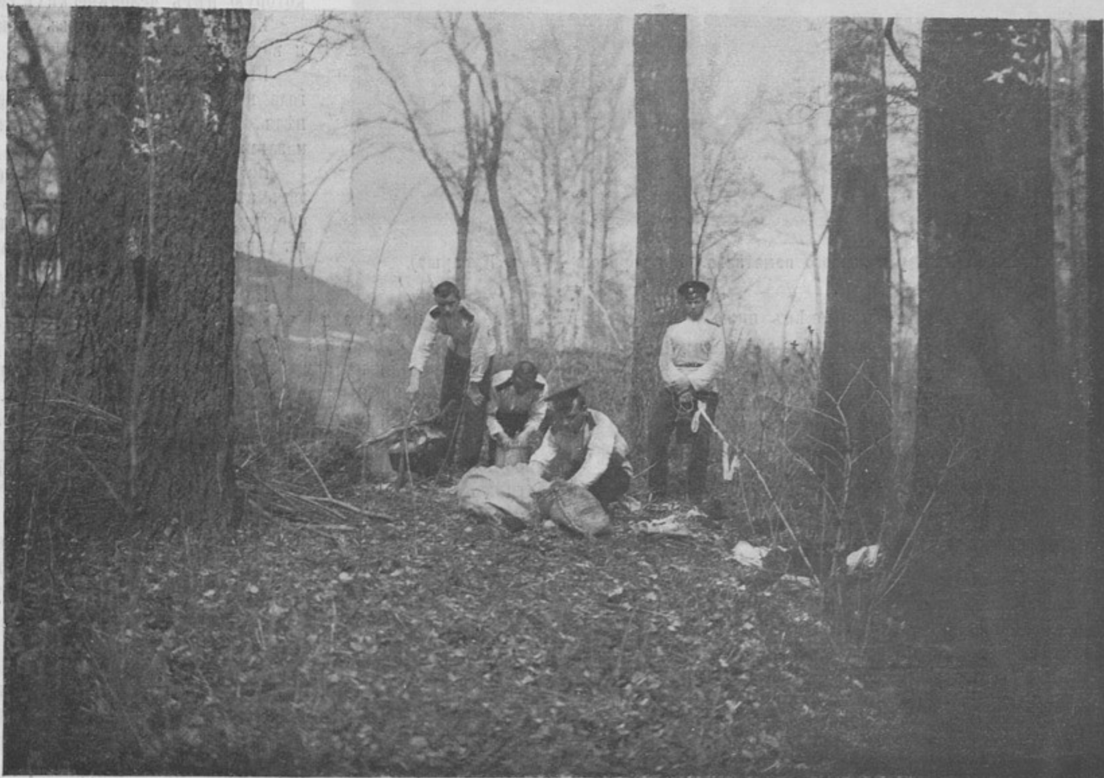
Экспедиція надѣтъ Дѣнскаго надетскаго корпуса. Кошевары за приготовленіемъ пищи. (Къ корресп. „Новочеркасскъ“).

Указаній, разъясненій этого секрета нигдѣ не найдете. Поэтому случалось, что штабы, составляя кандидатскій списокъ даннаго года, полагали, что попавшій въ списокъ въ прошломъ году, числится въ немъ и въ данномъ году, а по