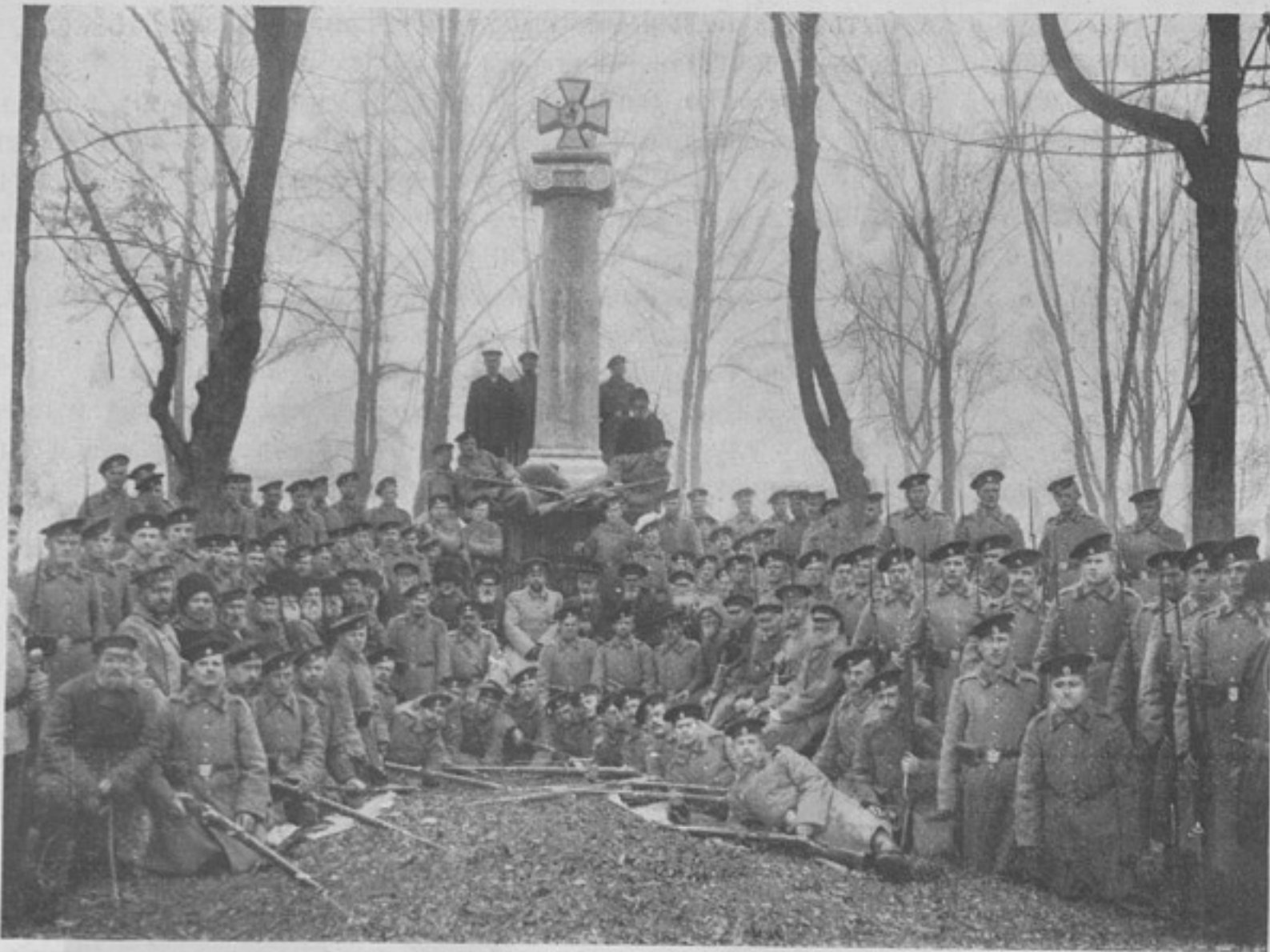
Группа Ширванцевъ у полкового памятника. (Къ корресп. „Уроч. Кусары“).

Смотрите книжку.—На 1200 человекъ ниже васъ!