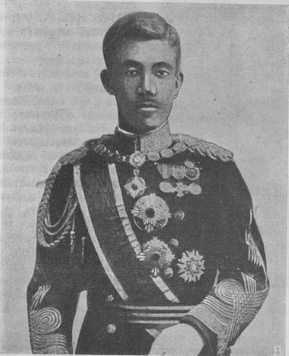
Новый императоръ Японіи Юсихито Харуномія.