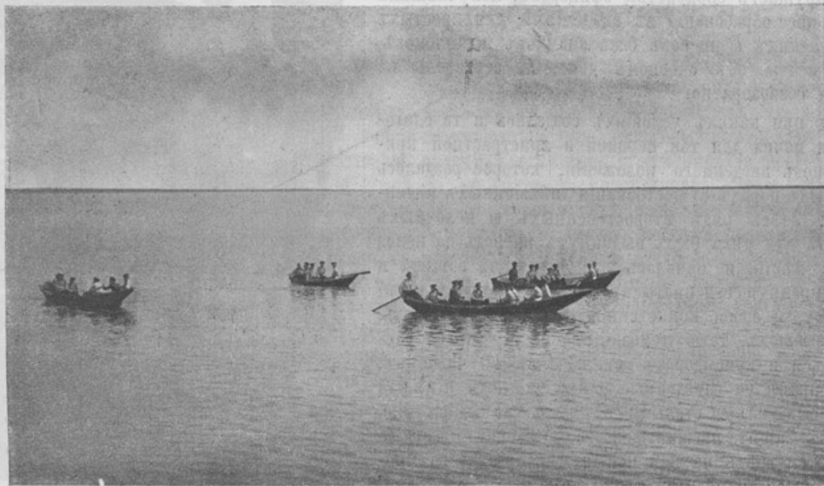
Экскурсія надеть Донского надетснаго корпуса. Обученіе гребль. (Къ корресп. „Новочеркасскъ“).

Въ отношеніи хозяйственныхъ заботъ, громадная работа и обуза были постепенно разгружены дивизионнымъ интендантомъ съ плечъ начальниковъ штабовъ; постепенно, несмотря на нервированіе частей, произведена работа громаднаго учета наличія въ частяхъ имущества; на первыхъ порахъ нужно было ознакомить дивизионныхъ интендантовъ съ положеніемъ частей, подготовить имъ матеріалъ для распределенія субсидій отъ казны на помощь частямъ на покрытие долговъ для перехода къ системѣ прямыхъ отпусковъ отъ казны, и постепенно дивизионные интенданты начали свою незамѣтную и, пока, канцелярскую работу каждого дня, съ