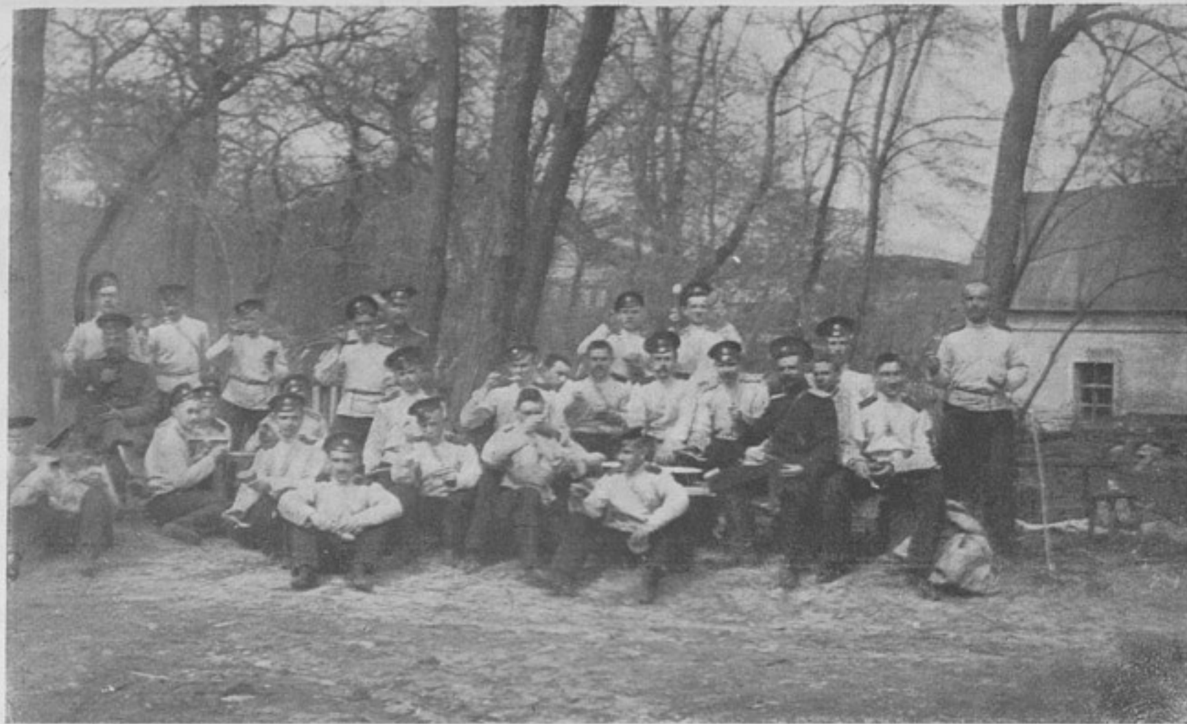
Экскурсія надеть Донского надетснаго корпуса. Завтракъ. (Къ корресп. „Новочеркасскъ“).

на сборъ этихъ свѣдѣній, необходимо было то чернильное море, которое было неизбѣжно, когда хотять въ короткій срокъ собрать по самымъ разнообразѣйшимъ вопросамъ свѣдѣнія отъ войскъ.