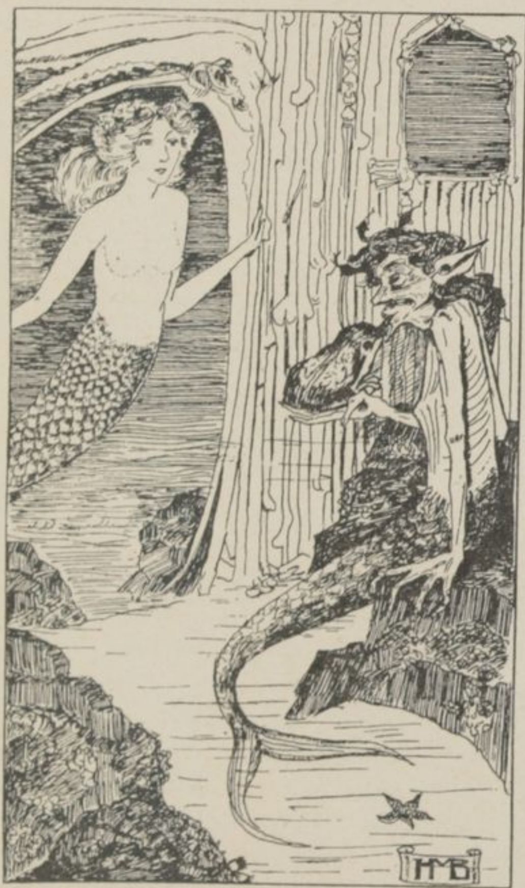
Tie sidis la sorcistino de la maro kaj mangigadis bufon el sia buŝo.