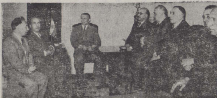
در عکس بالا آقای علاء وزیر دربار شاهنشاهی و آقای دکتر نصر شهردار تهران و چند نفر از آقایان بازرگانان که در جلسه هیئت انجمن خیریه شرکت کرده بودند دیده میشوند

اعضای کمیسیونهای پنج گانه تدارکات، توزیع و تشخیص مالی، بهداری و تبلیغات نیز انتخاب گردید