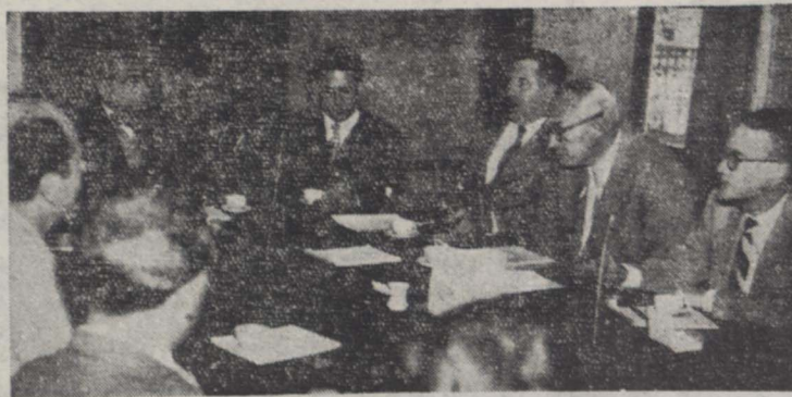
در این عکس آقایان د. نر امینی وزیر دارائی و ناصر مدیر کل بانک ملی و وادن رئیس اداره همکاری فنی امریکا و چند تن از روساء آن اداره دیده میشوند

صبح دیروز در اطاق کار آقای وزیر دارائی با شرکت آقایان ناصر مدیر کل بانک ملی و وادن رئیس اداره همکاری فنی کمک امریکا و عده ای از روسای آن اداره کمیونی برای ترتیب چهار میلیون و هفتصد هزار دلار که جمعا ده میلیون دلار میشود منظور خرید کالا های ضروری در اختیار وزارت دارائی گذاشته شده است و از همین مبلغ ۱۲ میلیون دلار شکر وارد میکنند که پنج اقلام کسکهای مزبور سی و دو میلیون دلار در حدود ۱۳ میلیون دلار بقیه کمک مالی امریکان تا چند روز دیگر طبق موافقتی که در جلسه امروز بعمل آمد قرار است در اختیار وزارت دارائی گذاشته شود.