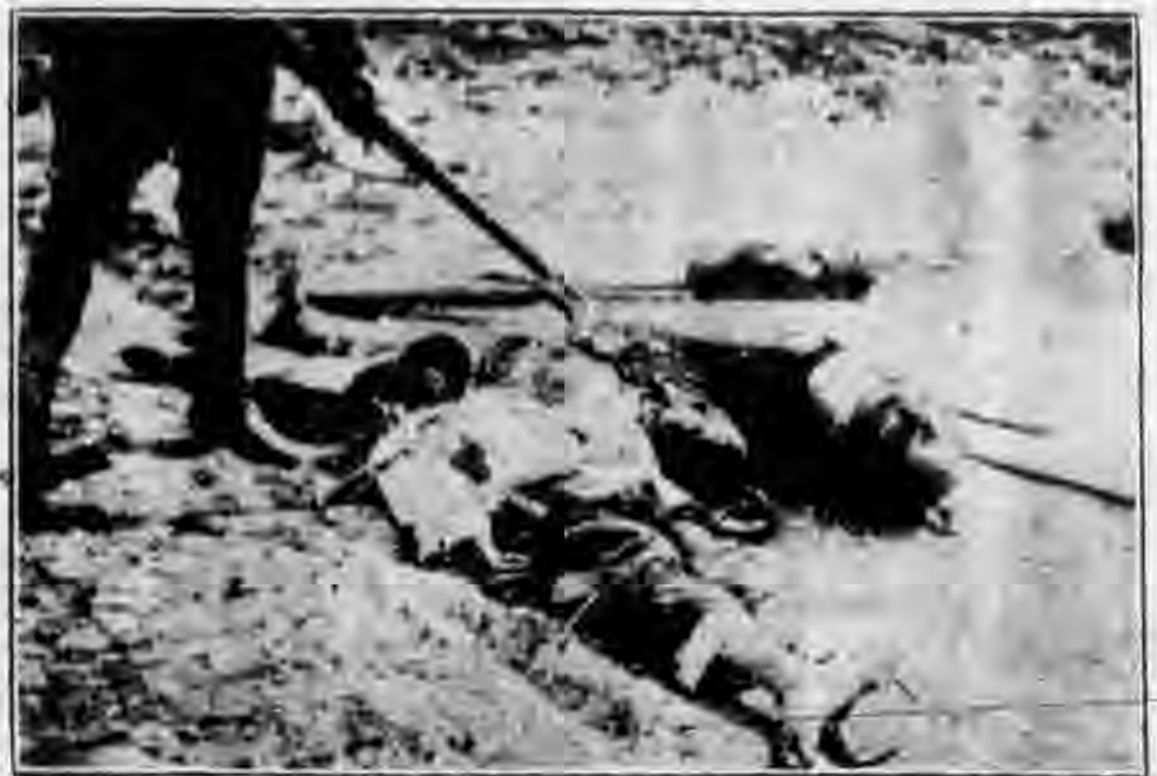
幕一之軍命革殺慘城北在兵中案三慘五

從這個慘案裏給我們的教訓，就是帝國主義對於我們中國的自強獨立，他是要破壞的；因爲破壞了中國之自強獨立，他才能盡量的侵略中國。去年西安事變發生了，日本便高興得不得了，希望藉此機會來加緊的侵略中國；可是西安事變很順利地解決了，日本乃大失所望。所以，我們要爭取民族的生存與獨立，必須四萬萬人團結堅固，共同抗敵，才能把失地收回來，把敵人趕出去！