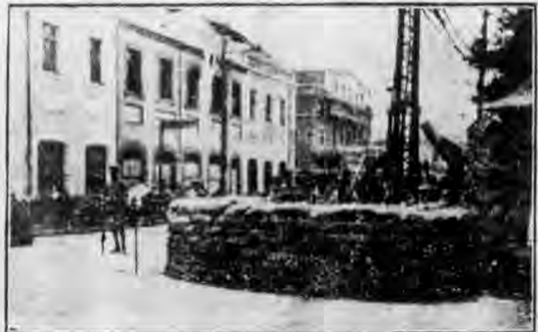
「三五」時殘忍的兵備射擊濟南市民之一幕