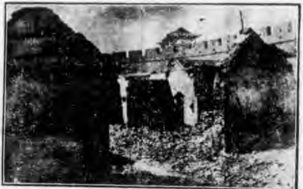
三五慘案中焚燬之餘濟南順城街

本年輸日蘆鹽十萬噸，經財部電飭津海關准予放行，第一批三千九百噸之運輪富和丸，昨晨已駛抵塘沽，開始裝船，預計十六日下午裝竣出口。據悉興中公司擬於本月內分四批運出一萬七千噸，業將運輪確定：計第二批運輪為廣和丸，載重四千噸，定十九日入港；第一批為海豐丸，載重五千八百噸，於廿二日進口；四批大速丸，運鹽三千三百噸，二十四日入港。又塘沽運輸公司之小型輪二艘，已於日前駛來，當分配於漢沽塘沽之間，負倒載蘆鹽工作云。