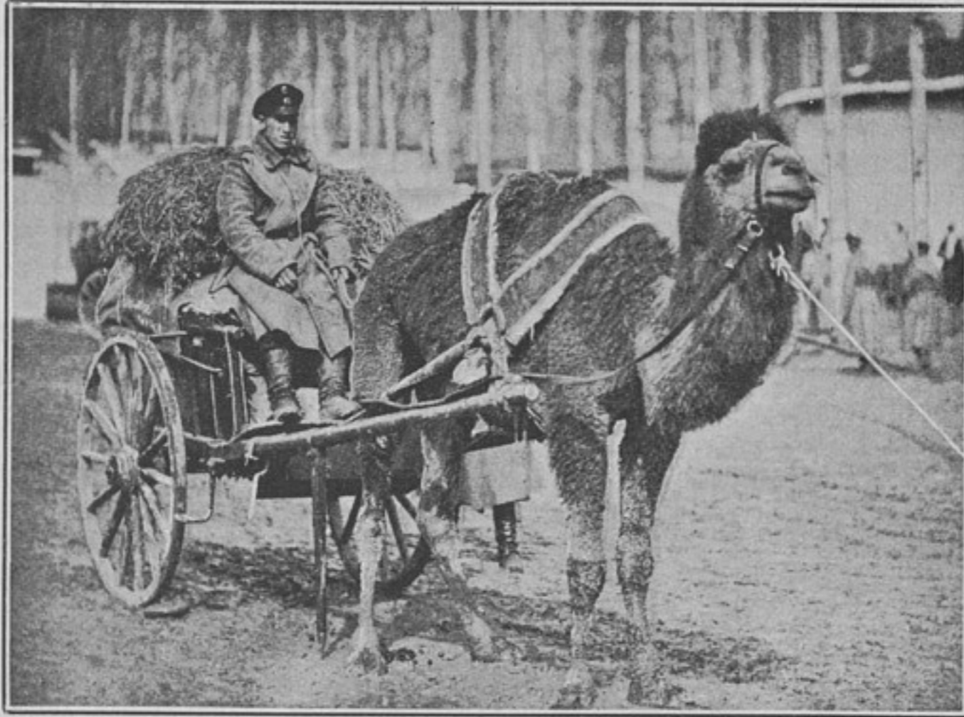
Одноробый верблюдъ въ хозяйственной двуколкѣ (безъ сѣдла) (къ статьѣ «Верблюдъ»).

Во всякомъ случаѣ, какой бы результатъ ни получился, мы полагаемъ, что вводить верблюдовъ, какъ постоянную двигательную силу, въ военный обозъ—рискованно. Въ жизни верблюдовъ, этихъ дѣтей степей, есть періоды, когда они требуютъ свободы и отдыха; въ первомъ случаѣ—время течки, а во второмъ—у нихъ появляется особаго рода болѣзнь, когда ихъ совершенно не употребляютъ въ работу мѣсяца 1 1 / 2 —2; если въ войска введутъ холощенныхъ верблюдовъ, то первая причина отпадаетъ, но остается еще много особенностей этого животного, съ которыми придется считаться, напримѣръ, движеніе ночью, когда верблюдъ плохо или совсѣмъ не видитъ. Верблюдъ при своей нѣжности и вялости въ движеніи не замѣнитъ лошадь. Вслѣдствіе сего, было бы осторожнѣе, лишь часть лошадей замѣнить верблюдами и при томъ не во всѣхъ войскахъ нашего отдаленнаго степнаго Востока, а только въ нѣкоторыхъ, наиболѣе для сего благоприятно расположенныхъ. Кромѣ того, если верблюдъ подымаетъ на своемъ горбу 16—18 пудовъ, то заставлять его везти одноколку невыгодно; при развитіи двигательной силы его, было бы полезно замѣнить