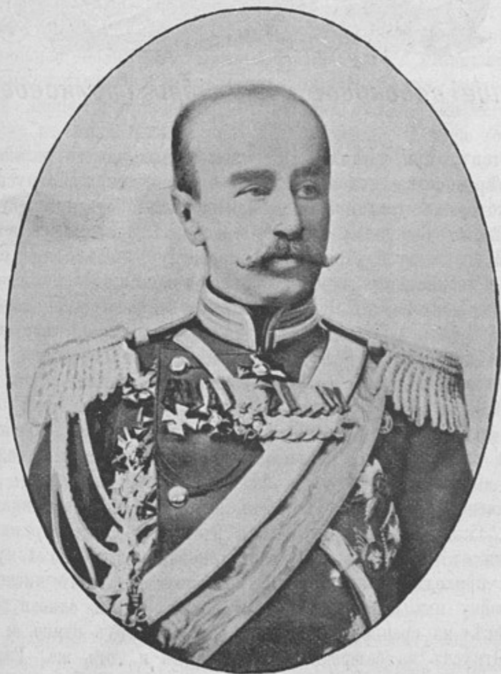
Иркутскій военный генераль-губернаторъ, генераль-лейтенантъ

Денги могутъ быть высланы почтовыми марками, каждая не дороже 50 к. Безденежная подписка не принимается. За перемѣну адреса 25 к. Отдѣльные №№ высылаются за 15 к. Объявленія принимаются по особой расцѣнкѣ, высланной по требованію.