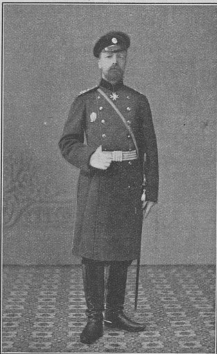
Командиръ 6-й батареи 1-й Восточно-Сибирской артиллерійской бригады, подполковникъ

Точно также слѣдовало бы опредѣлить и порядокъ отпуска войскамъ фуража, т. е. сѣна и овса. Передача въ руки интендантства снабженія войскъ фуражомъ при настоящихъ законоположеніяхъ была бы крайне неудобна для войскъ, ибо законъ прямо допускаетъ приемъ даже въ магазины недоброкачественнаго сѣна. По ст. 146-й книги XII, допускается къ приему сѣно, въ которомъ находится осок и другихъ несъѣдобныхъ веществъ не болѣе 10%; но военно-окружнымъ совѣтамъ предоставляется «въ исключительныхъ случаяхъ и въ зависимости отъ урожая травъ допускать для отдѣльныхъ