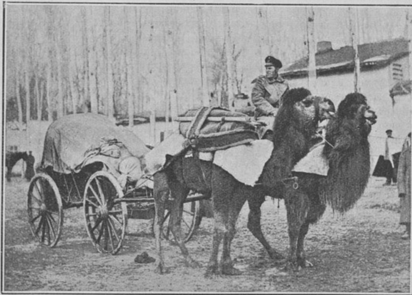
Однгорбый и двугорбый верблюды въ четырехколесной дышловой повозкѣ (съ сѣдлами) (къ статьѣ «Верблюдъ»).

Въ обыкновенной жизни рѣшительно никто не носитъ такихъ поясовъ, какъ солдатъ. Для чего же ему данъ такой? Выходитъ, какъ будто только для того, чтобы ему