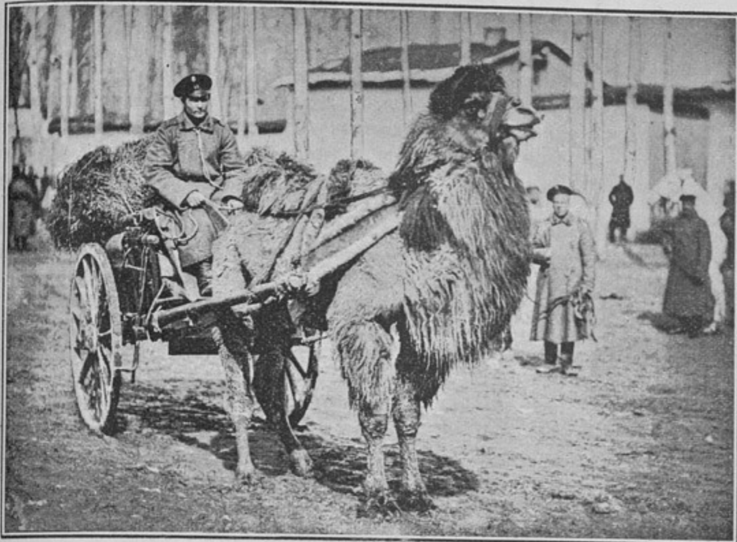
Двугорбый верблюдъ въ хозяйственной двуколкѣ (безъ сѣдла) (къ статьѣ «Верблюдъ»).

Туземцы степей нашего Востока, при своей первобытности, считали необходимымъ, для управленія верблюдами, протыкать у бѣдныхъ животныхъ ноздри, пропускать сквозь это отверстие палку въ видѣ гвоздя съ утолщеннымъ однимъ концомъ и, привязывая къ другому веревку, тащить такимъ образомъ верблюда одного за другимъ. Но и въ этомъ сказалось вліяніе