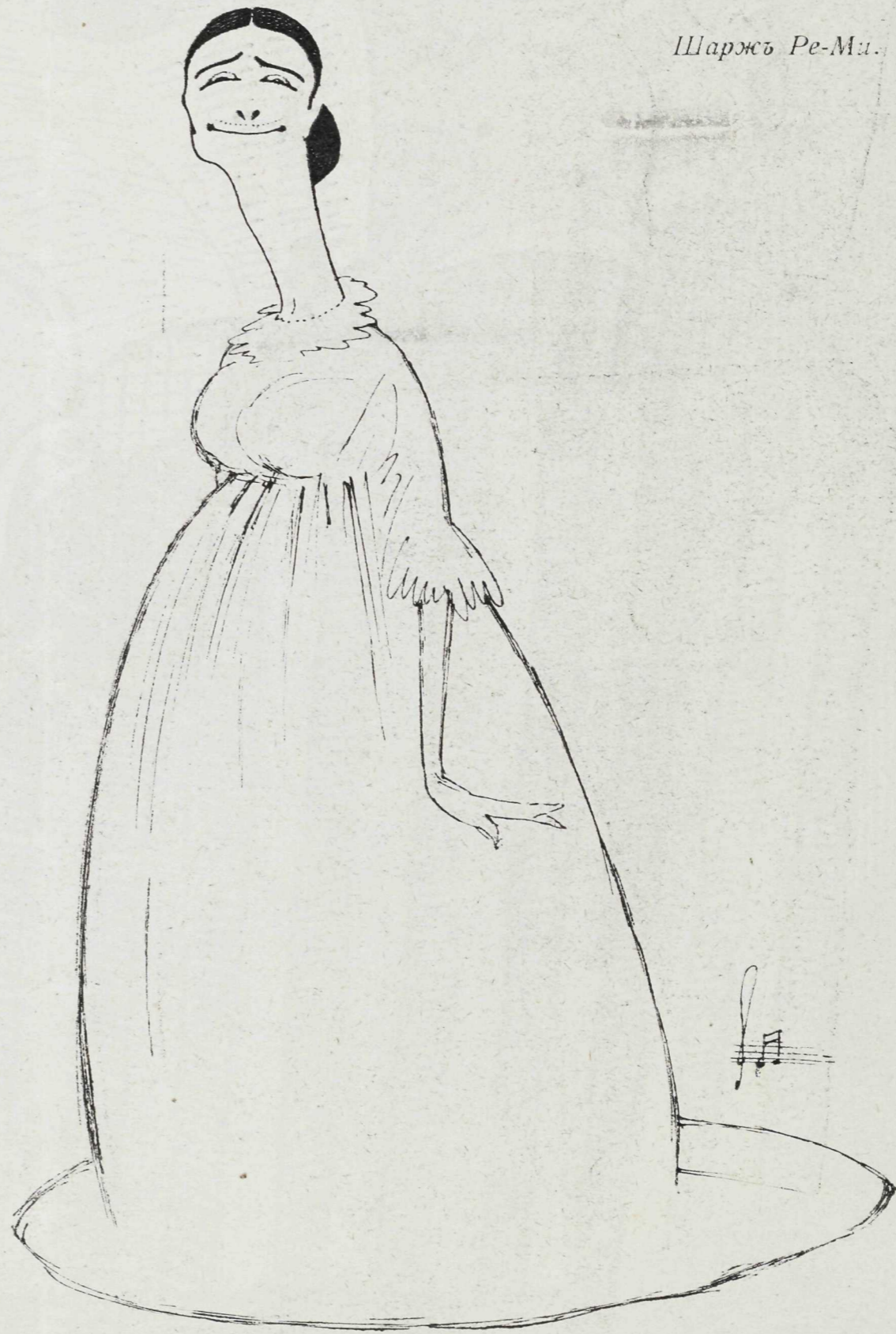
Гастроли Московск. Художественнаго театра. «РОСМЕРСГОЛЬМЪ» — РЕБЕКА. — Г-ЖА КНИПЕРЪ.