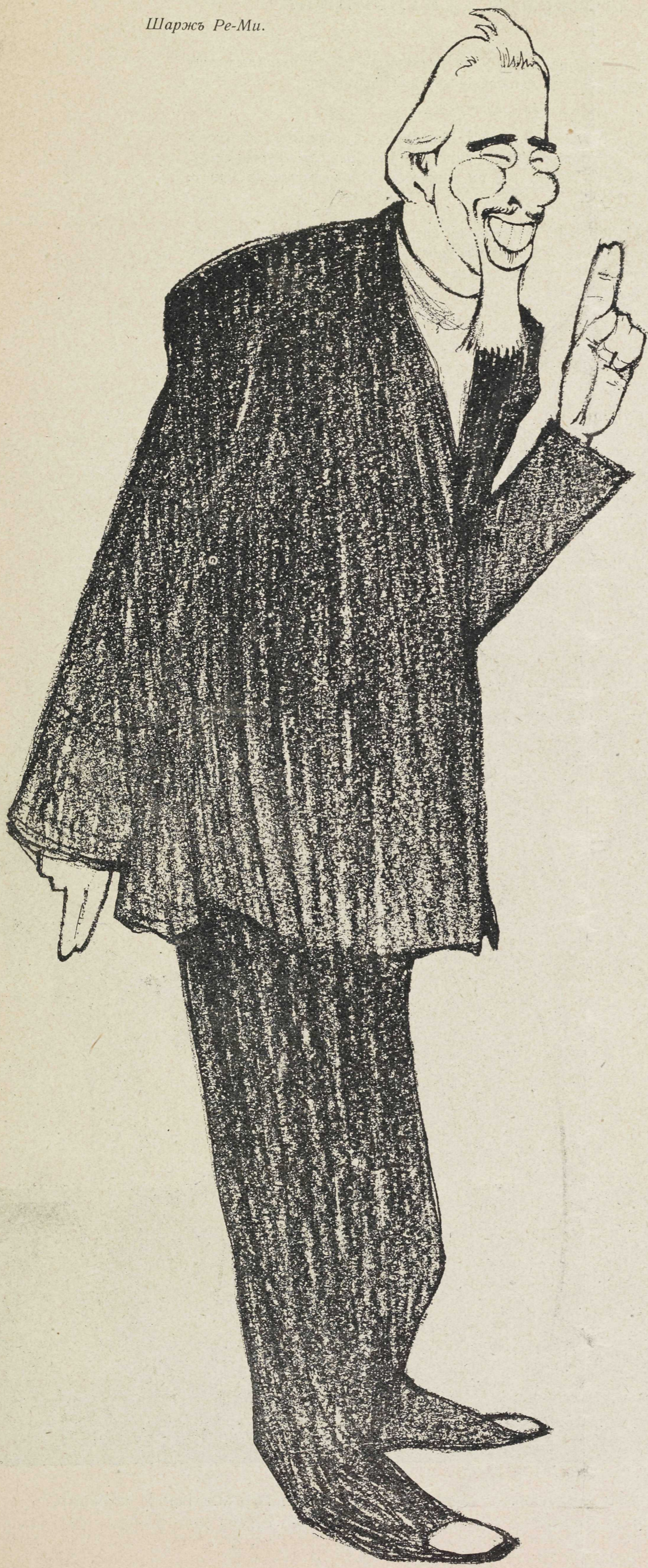
Гастроли Московск. Художественнаго театра. «ДОКТОРЪ ШТОКМАНЪ» — К. СТАНИСЛАВСКІЙ.