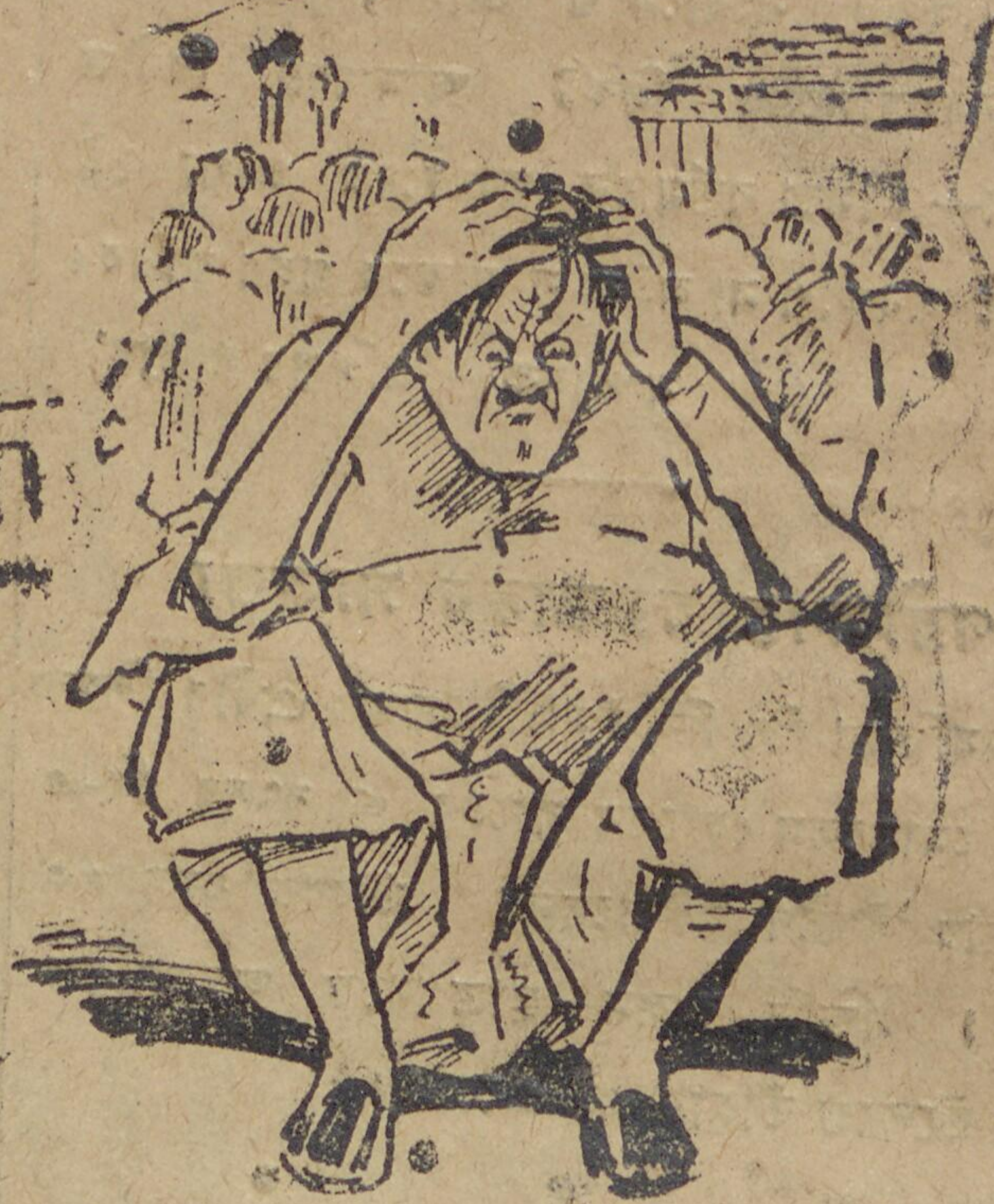
আর একটা মরলে কাষ্ট্রিং এ দেখা যেতো। ছটো মরলে "সিওর"