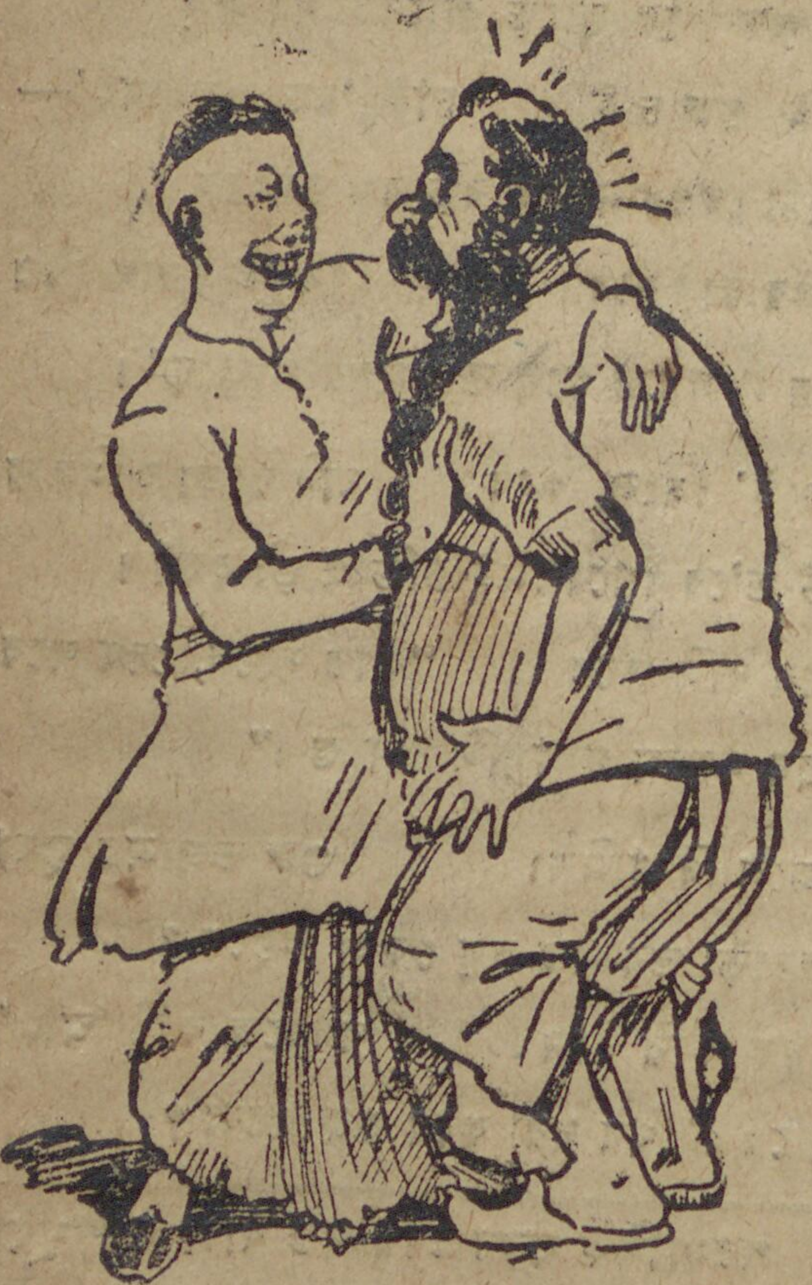
সেয়ানে সেয়ানে কোলাকুলি