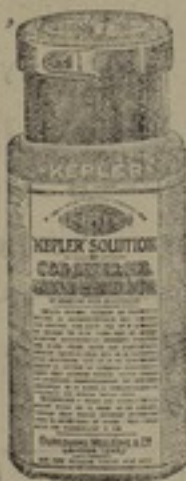
شكله مصغر جداً

محلول ، كپلار ، هو اعظام طعام مقو يساعد المسن وله مفعول كبير فى تركيب الجسم محلول ، كپلار ، يتحول بسرعه غريبيه الى دم وعضلات ومادة لحميه ودهنيه وعظمية وغنية محلول ، كپلار ، يشفى من امراض اسهل ادا اسه وجينه واذا تناوله الشبان المصابون بامراض الظهر