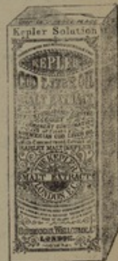
شكله مصغر جداً

والساق ثلاث مرات كل يوم قوى بدنهم واستعادة قائمهم محلول، كپلار ، يشفى من امراض الملازيم الطاعون وكل مرض يترى الانسان خصوصاً من لا يستطيع ان يتناول غذاه العادى . وبعد المداومه على تناطيه يتحول الجسم من المرض الى القوة والسمن وترجع القوة كما كانت .