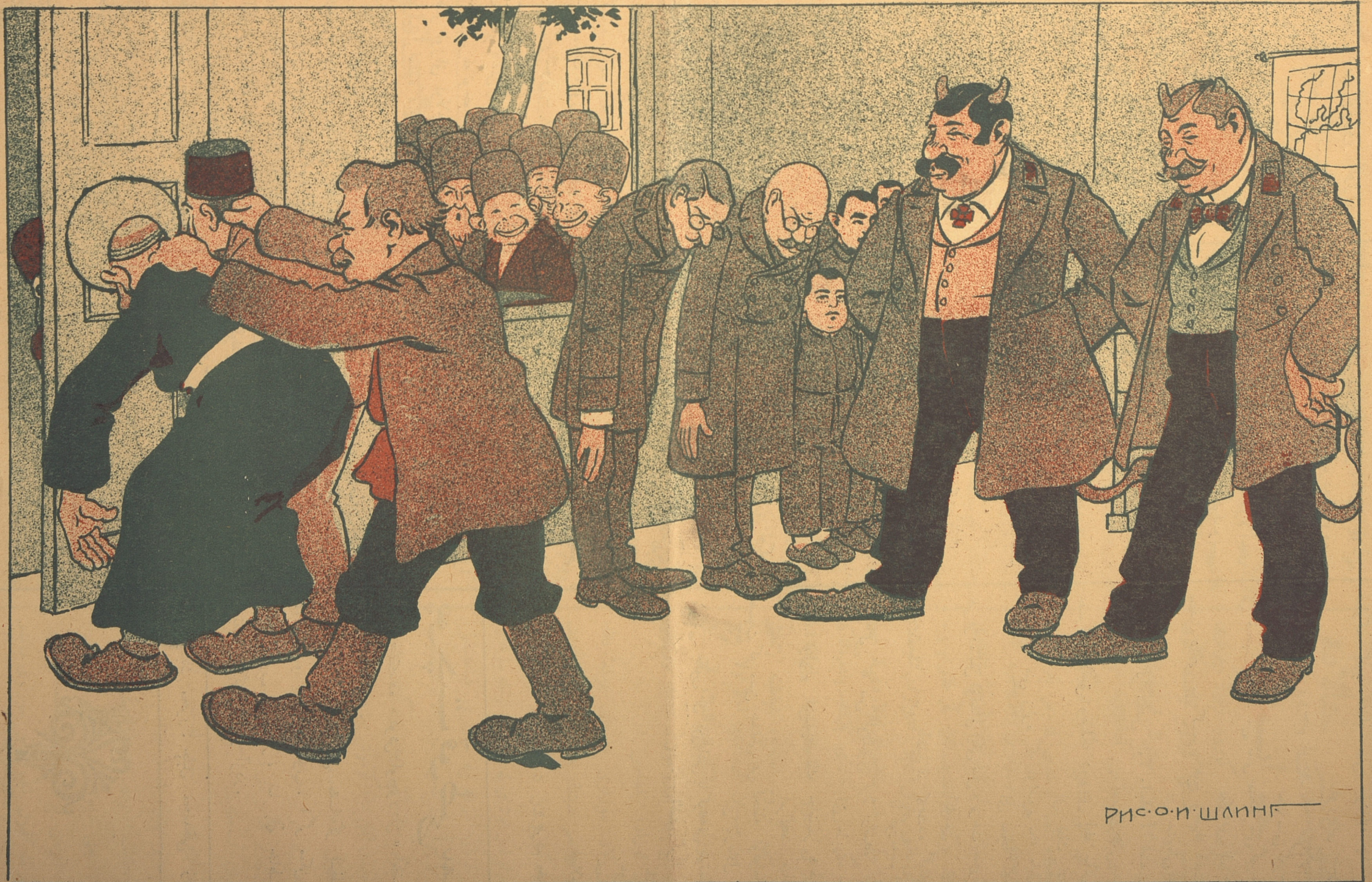
Рис. О. Н. Шинник