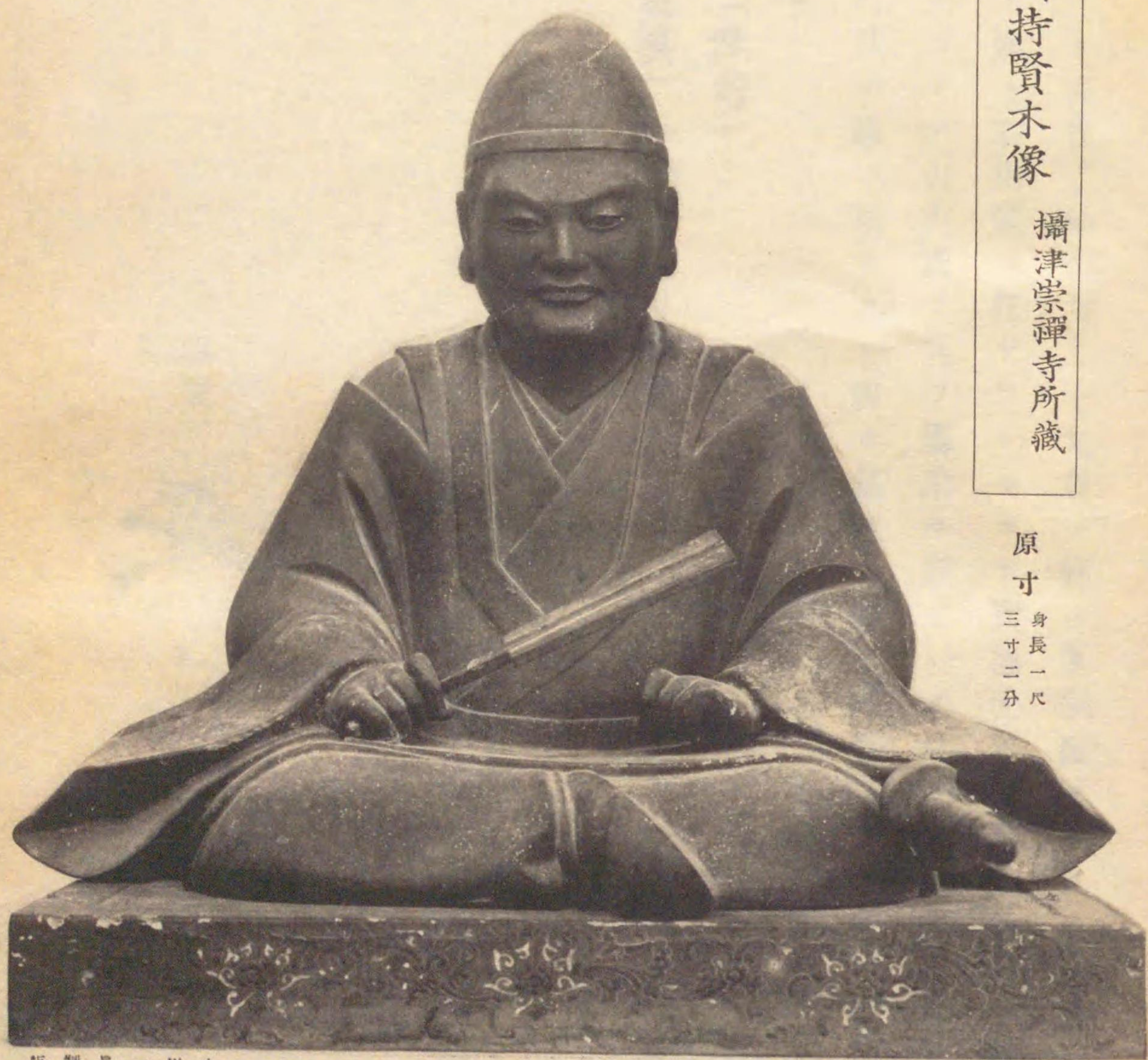
原寸 身長一尺三寸二分