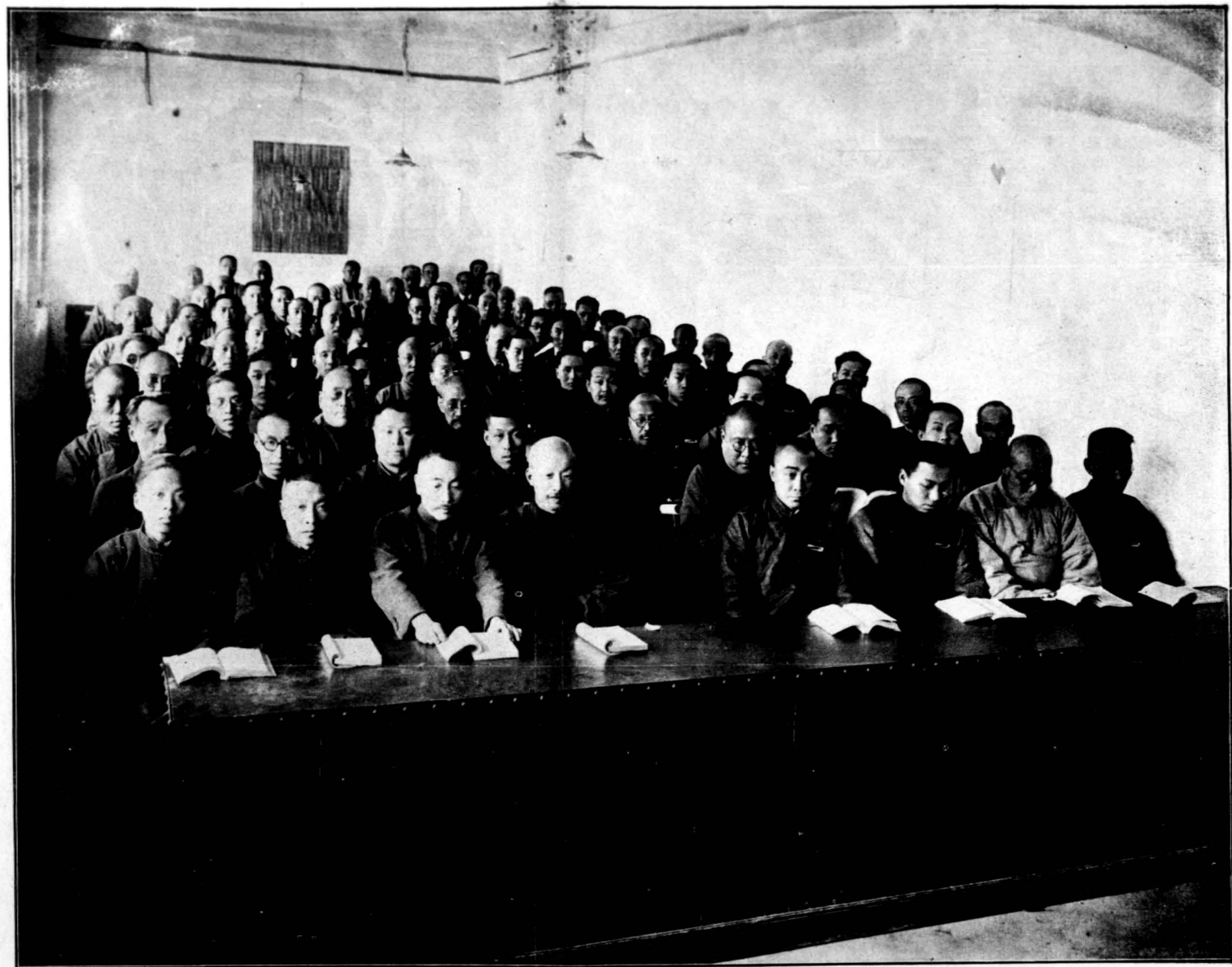
財政廳全體工人職員在黨義研究會合集閱讀攝影