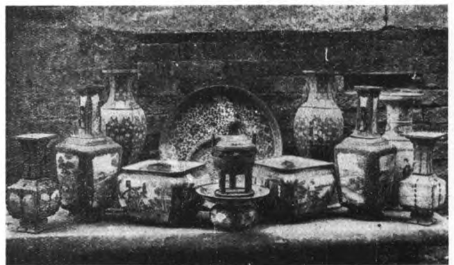
清乾隆銅胎珐瑯瓶爐

盧蔭溥等嚴議具奏、請通飭各督撫一體遵照畫一辦理、嗣後內地奸民人等、有種賣煎熬鴉片烟者、即照與販鴉片烟之例、爲首發近邊充軍、爲從杖一百、徒三年、地保受賄故縱者、照首犯一體治罪、職重者、計贓以枉法從重論、其知情容隱、雖未受賄、並照爲從例問擬、所種烟苗拔毀、田地入官、各督撫即責成該管道府督飭各屬實力查禁、乘抽查保甲之便、於春間赴鄉稽查一次、將有無私栽鴉片烟、出具印結、年底由司會齊咨部並著各督撫於每年具奏編查保甲摺內、一併詳晰聲敘、如有披除不盡、仍任流毒地方、即道照道光三年部定處分、分別參辦、毋稍徇隱、將此通諭知之、欽此、