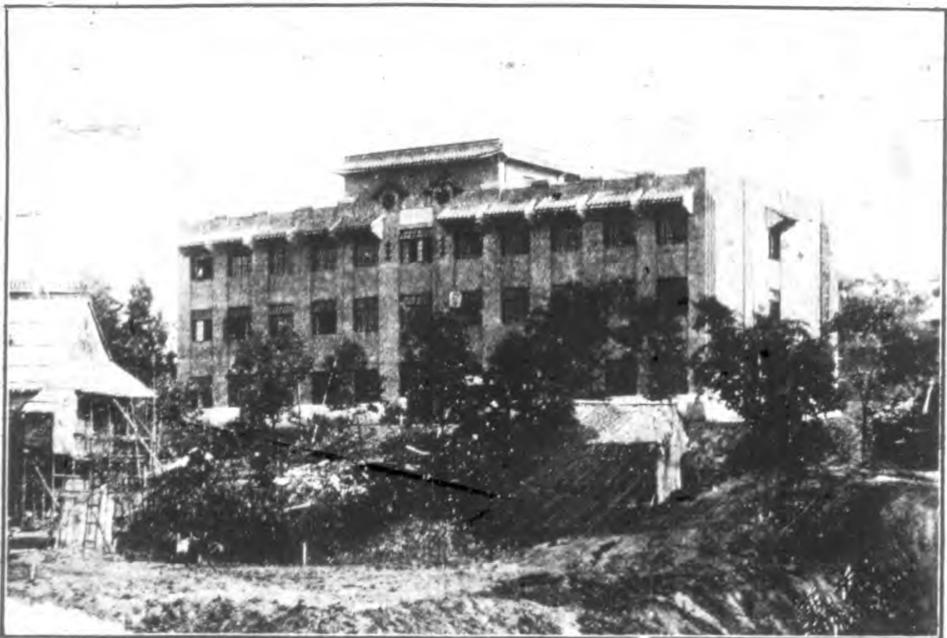
男 宿 舍 之 一