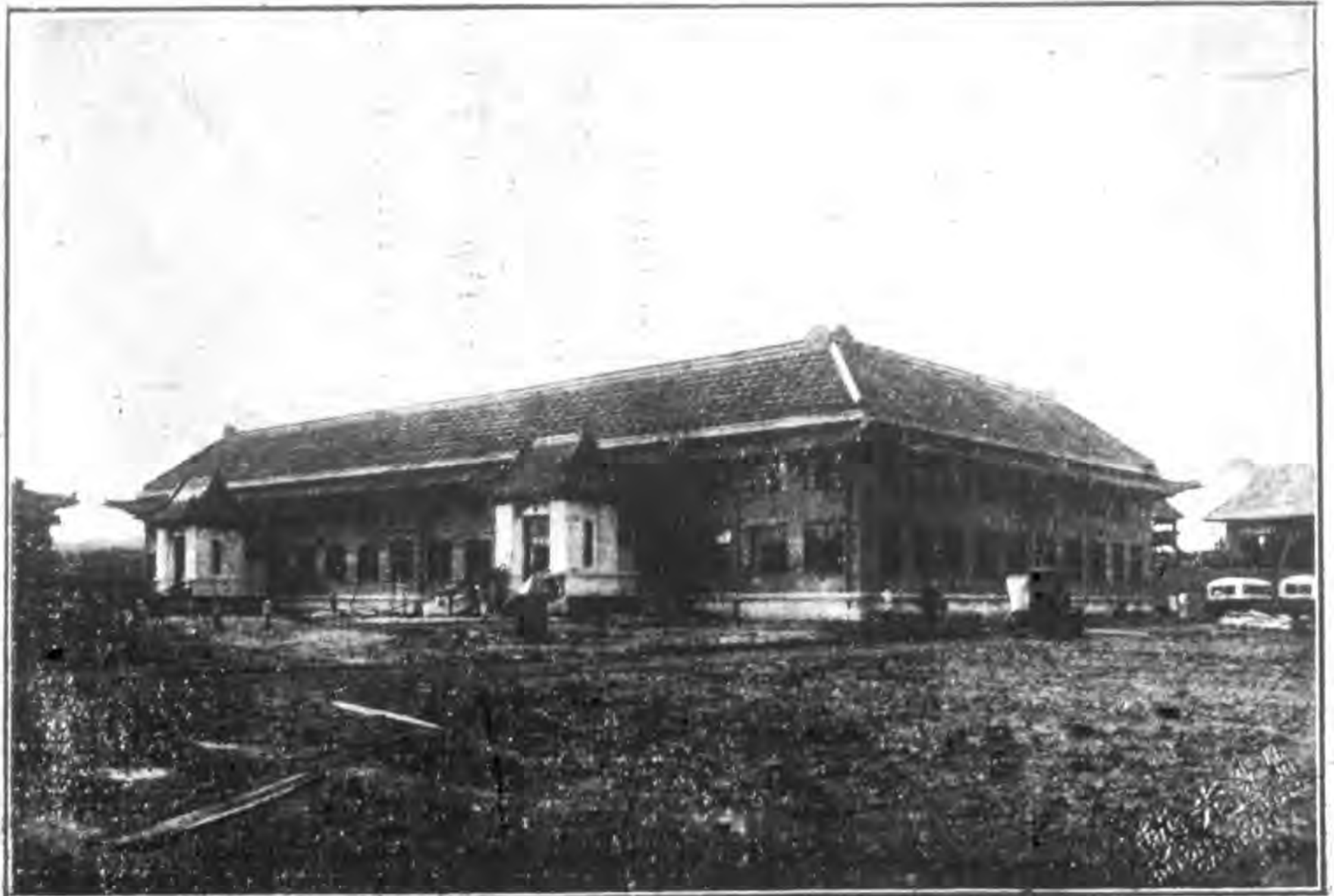
工學院電機器械工程系合館