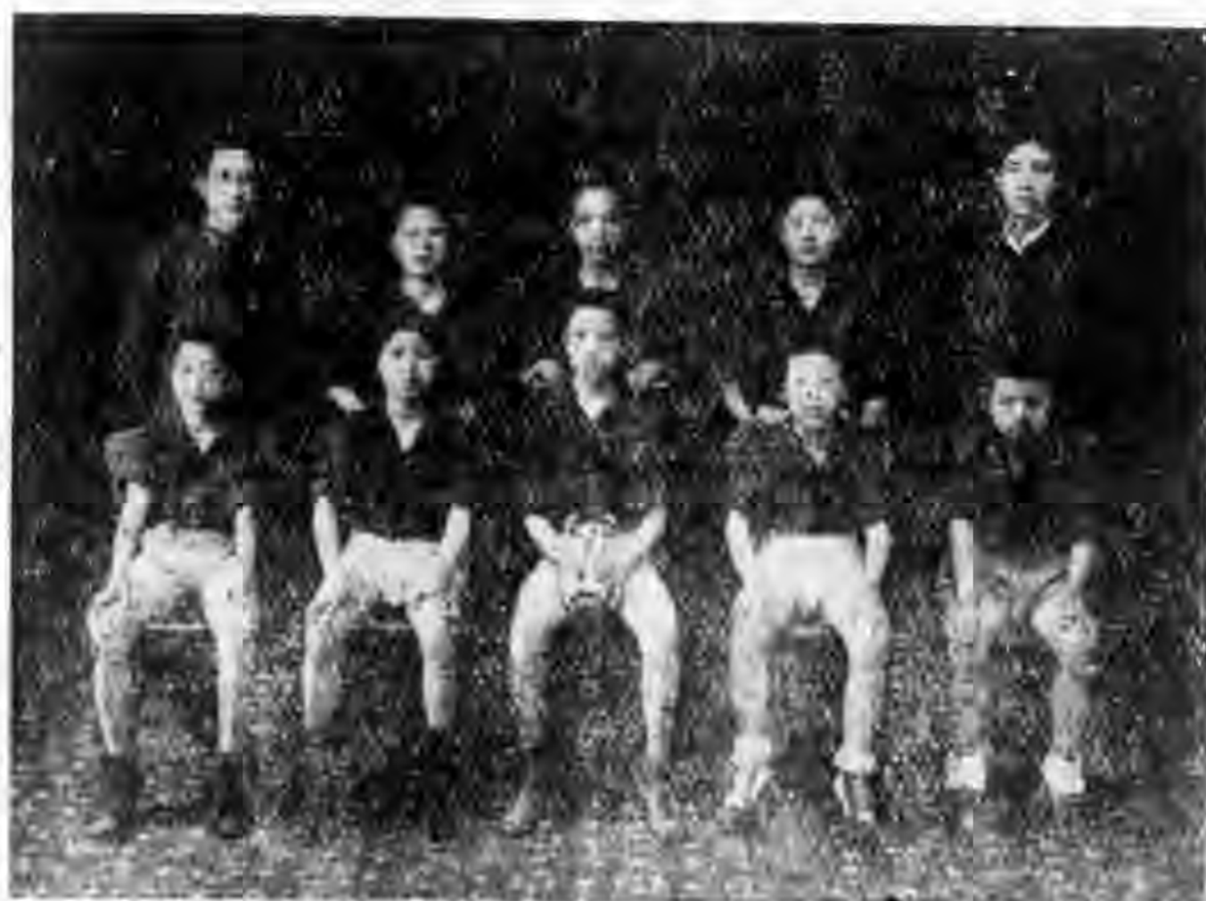
隊 球 小 友 工

篇已竟稍微提及，但均是過去及現在的事工，除具有自省得失的效用外，無甚大的裨益，我們最大的使命，乃是要利用已往的經驗來努力擴大將來的事工，充分的與勞苦民衆謀更大的福利，所以請將我們目前的急需和希望縷陳在後面，以供熱心友朋的指正，并盼望社會人士