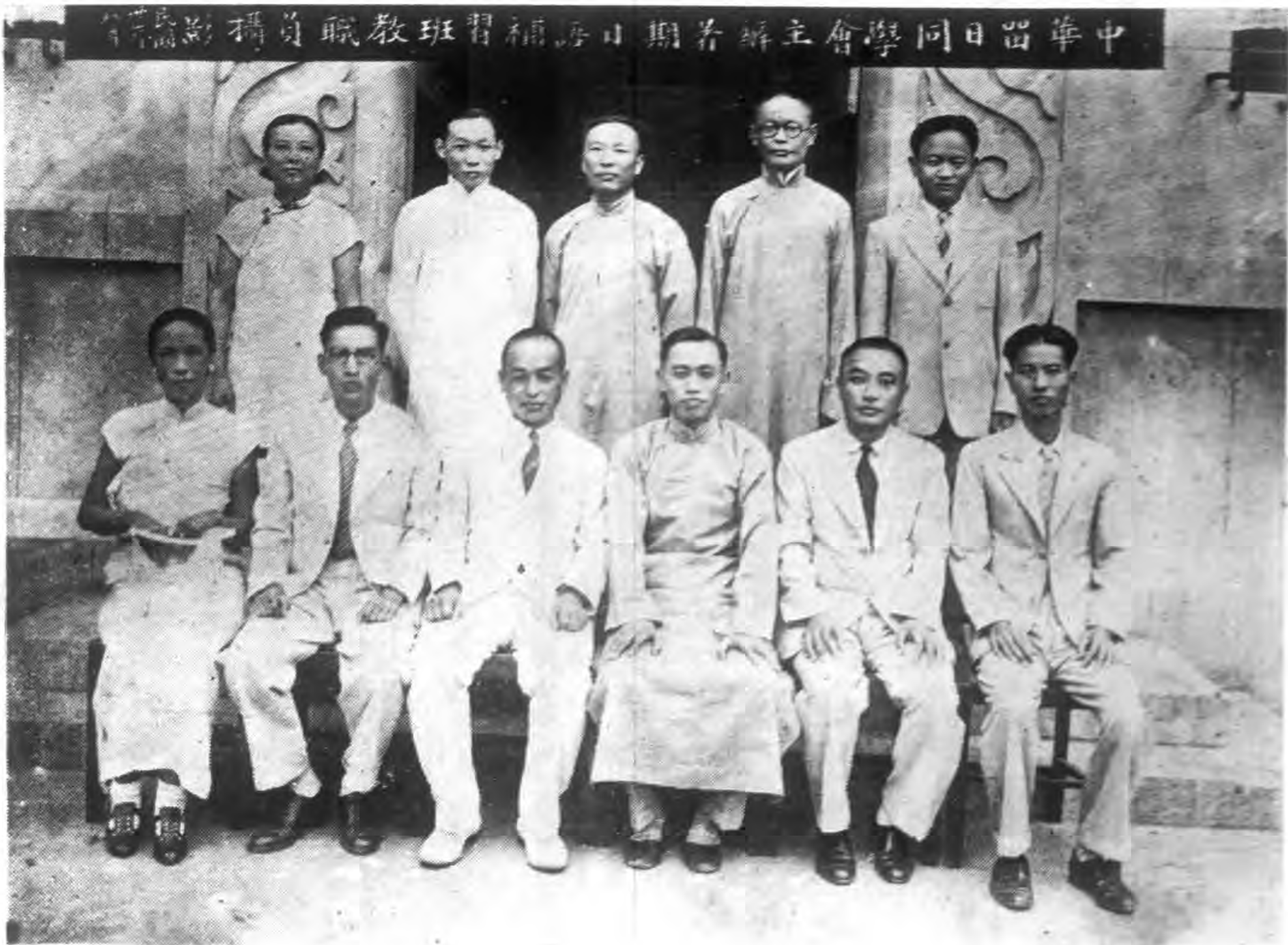
中華民國留日同學會主辦者日期補習班教職員攝影