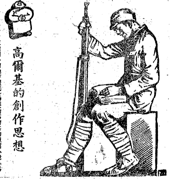
高爾基的創作思想

一九二九年，在俄國一個地方報紙上發表的高爾基的短篇小說「夜店」，在當時的歐洲，引起了一個關於高爾基的創作思想的問題。 高爾基的創作思想，是建立在對社會現實的深刻認識基礎上的。他認為，文學的任務是反映現實，揭露社會的黑暗，喚起人民的覺悟。 高爾基的創作思想，具有強烈的社會批判性。他通過對社會現實的深刻描寫，揭露了社會的黑暗和人性的扭曲，喚起了人民的覺悟。 高爾基的創作思想，具有強烈的人民性。他認為，文學是為人民服務的，必須反映人民的疾苦，為人民的解放事業而奮鬥。 總之，高爾基的創作思想，是建立在對社會現實的深刻認識基礎上的。他通過對社會現實的深刻描寫，揭露了社會的黑暗和人性的扭曲，喚起了人民的覺悟。