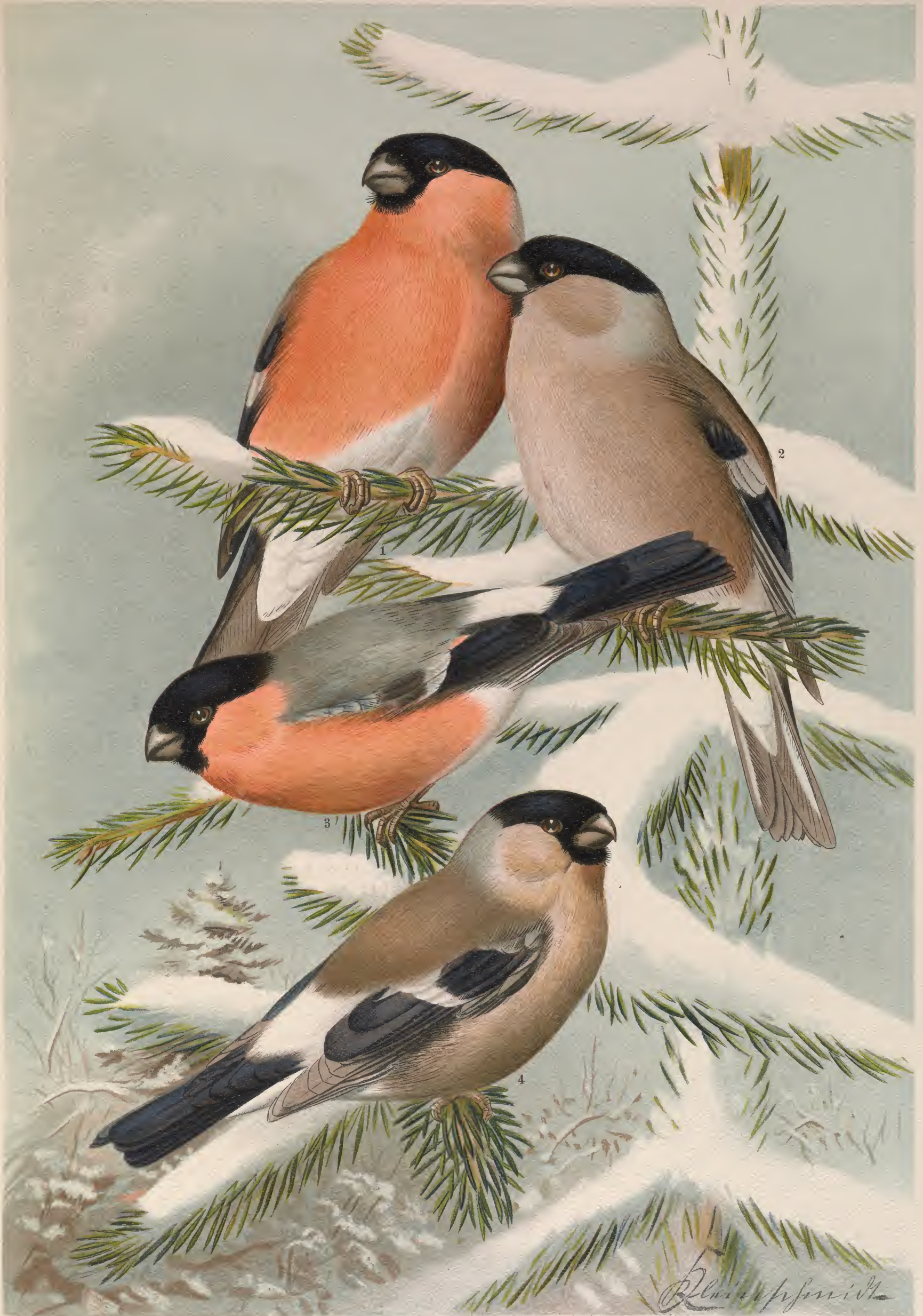
Pyrrhula pyrrhula (L.). Grosser Gimpel. 1 Männchen, 2 Weibchen.