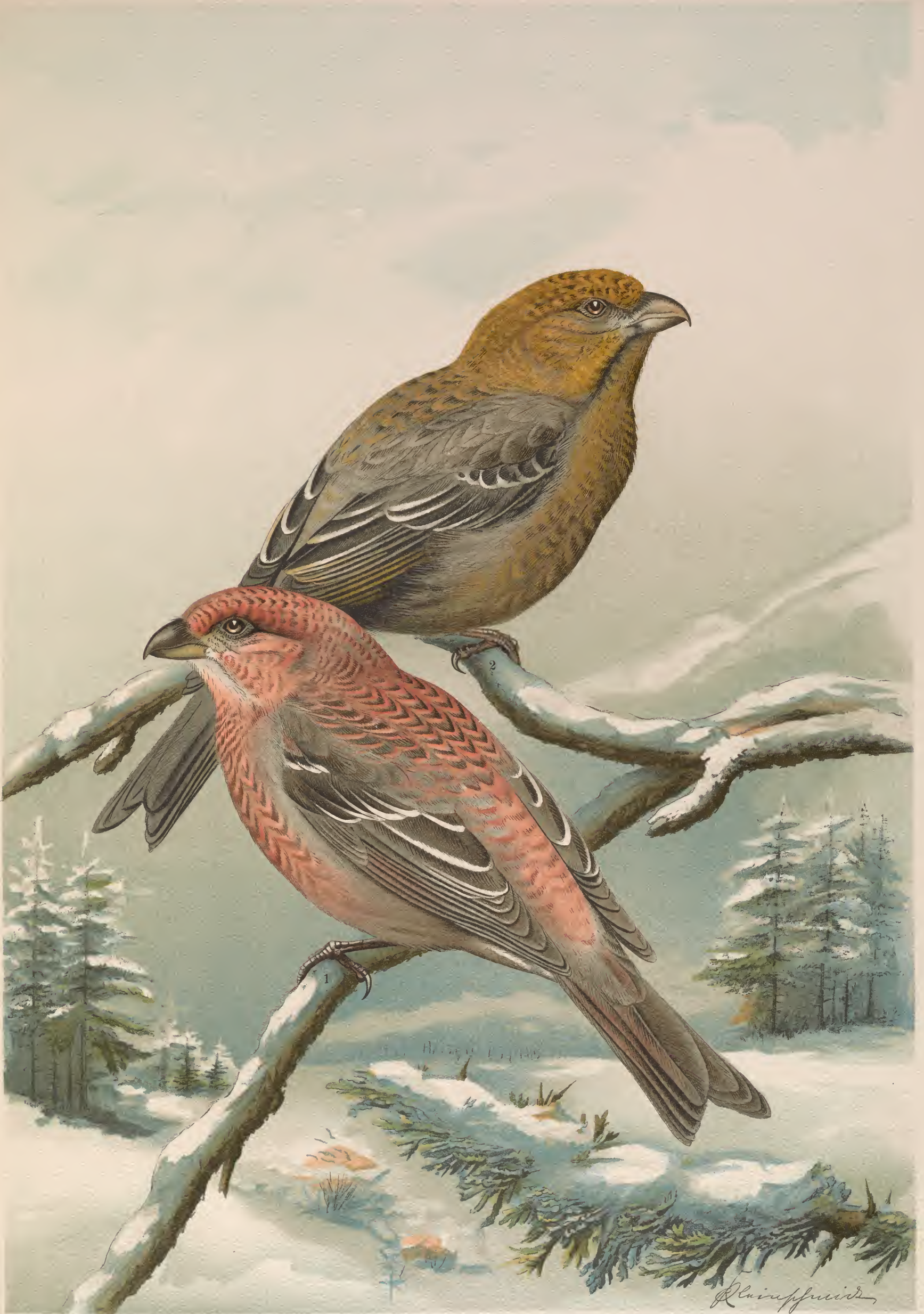
Pinicola enucleator (L.). Hakengimpel. 1 Männchen. 2 Weibchen. Natürl. Grösse.