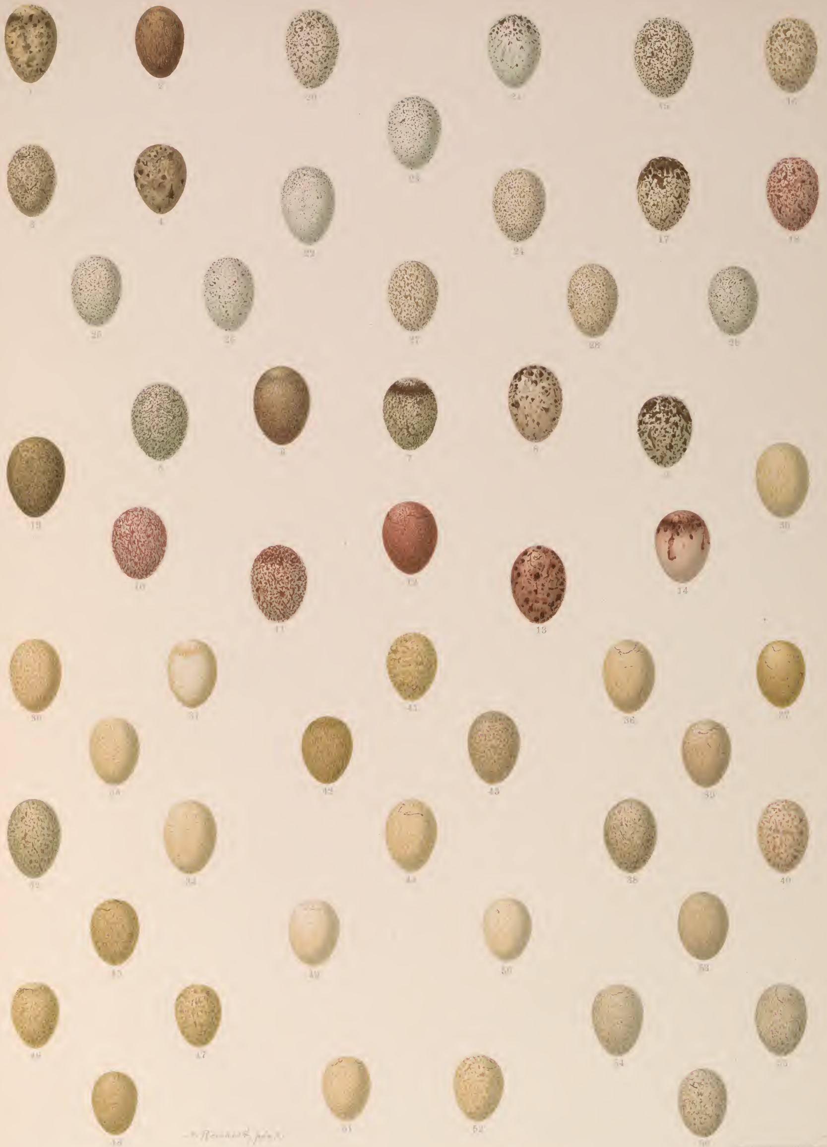
1—4 Anthus cervinus (Pall.), Rotkehliger Wiesenpieper; 5—14 Anthus trivialis (L.), Baumpieper; 15—18 Anthus campestris (L.), Brachpieper; 19 Anthus Richardi Vieillot, Spornpieper; 20—24 Motacilla alba L., Weisse Bachstelze; 25—29 Motacilla lugubris Temm., Schwarze Bachstelze; 30—34 Motacilla boarula L., Graue Bachstelze; 35 Budytes citreolus (Pall.), Gelbköpfige Bachstelze; 36—40 Budytes flavus (L.), Gelbe Bachstelze; 41—44 Budytes flavus borealis (Sundevall), Nordische Schafstelze; 45—48 Budytes campestris (Pall.), Gelbstirnige Bachstelze; 49—52 Budytes flavus cinereocapillus (Savi.), Grauköpfige Schafstelze; 53—56 Budytes melanocephalus (Lichtenstein), Schwarzköpfige Schafstelze.