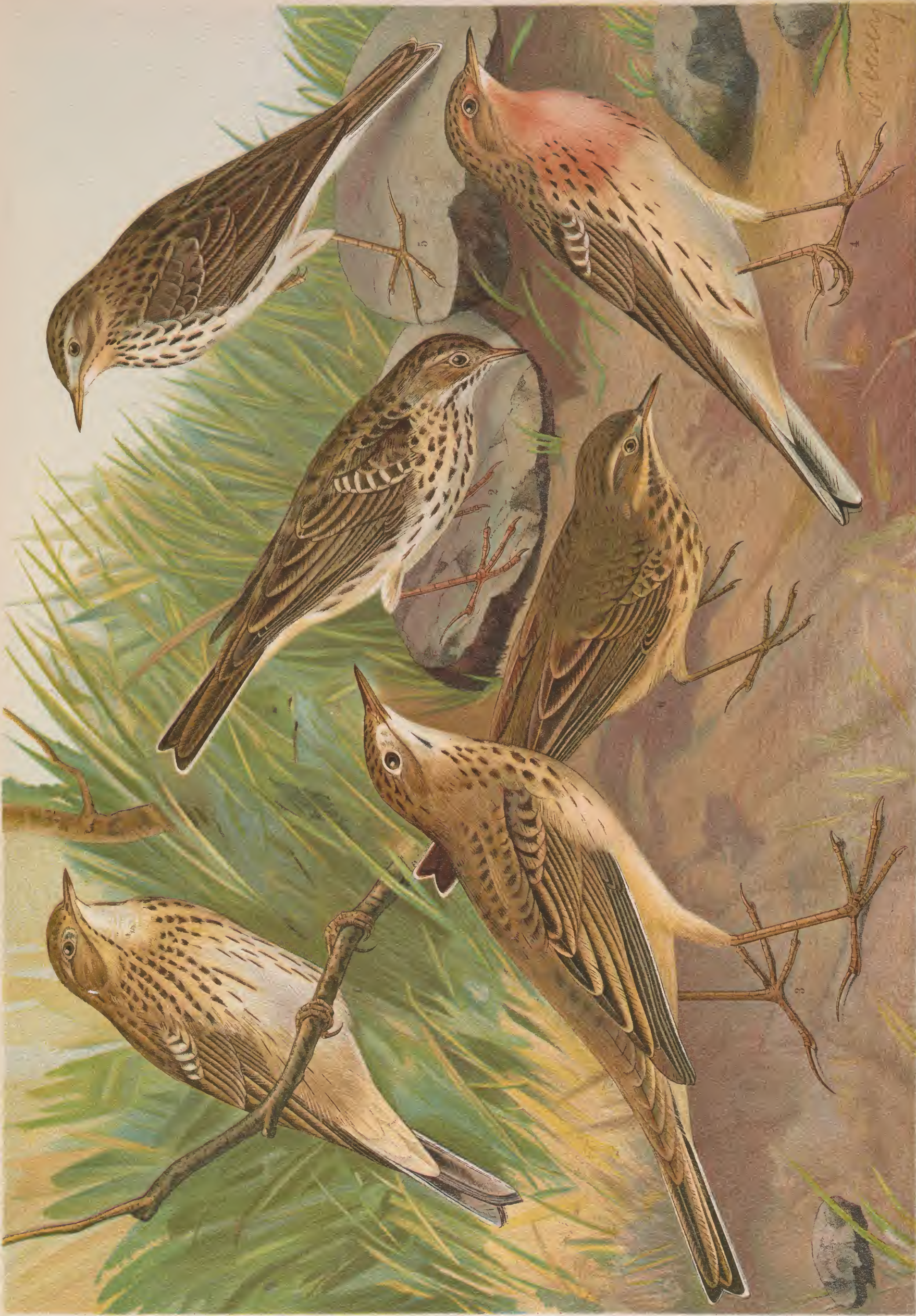
Anthus trivialis (L.). Baumpieper. 1 Männchen.