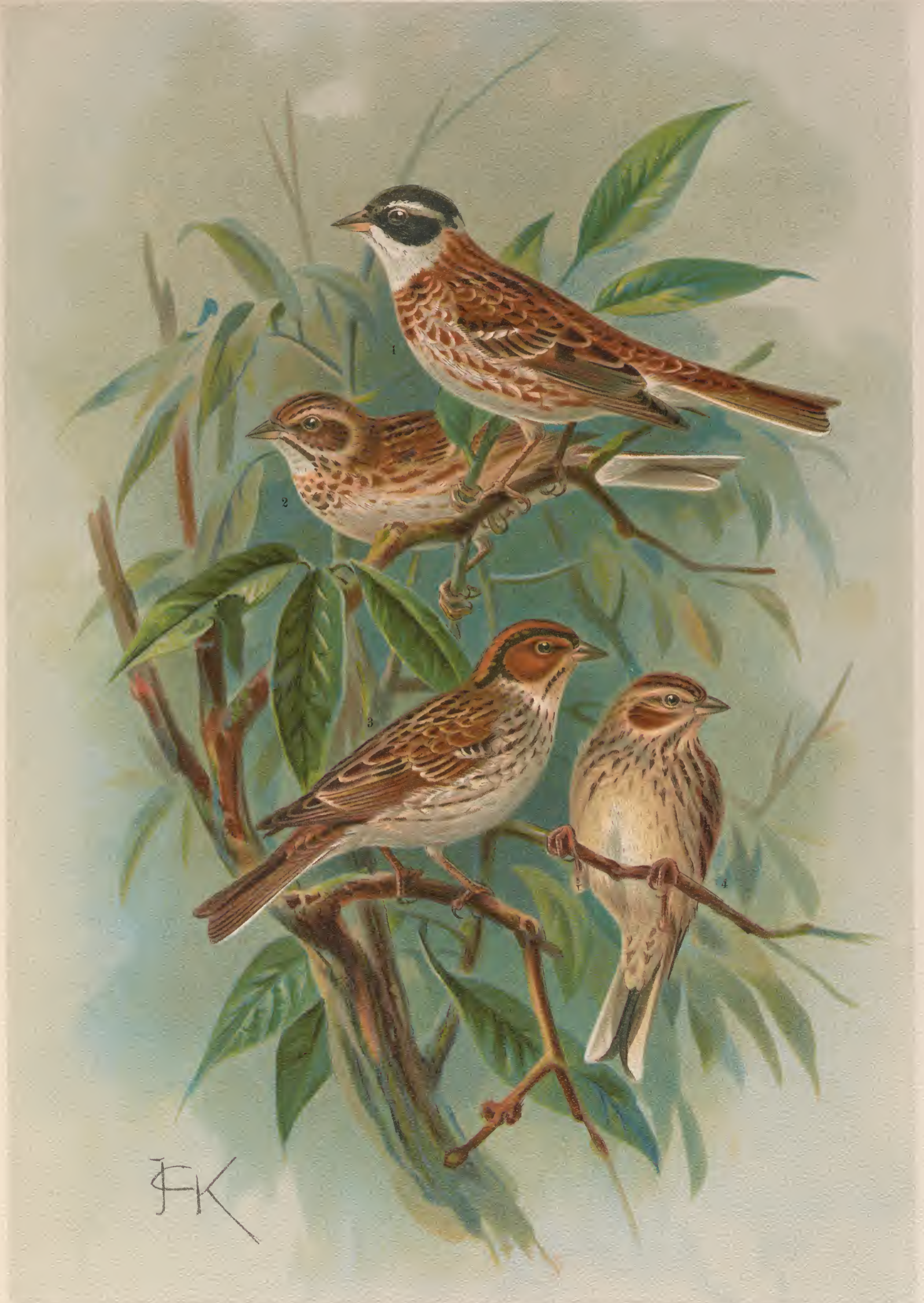
Emberiza rustica Pall. Waldammer. 1 Männchen. 2 Weibchen. Emberiza pusilla Pall. Zwergammer. 3 Männchen. 4 Weibchen. Natürl. Grösse.