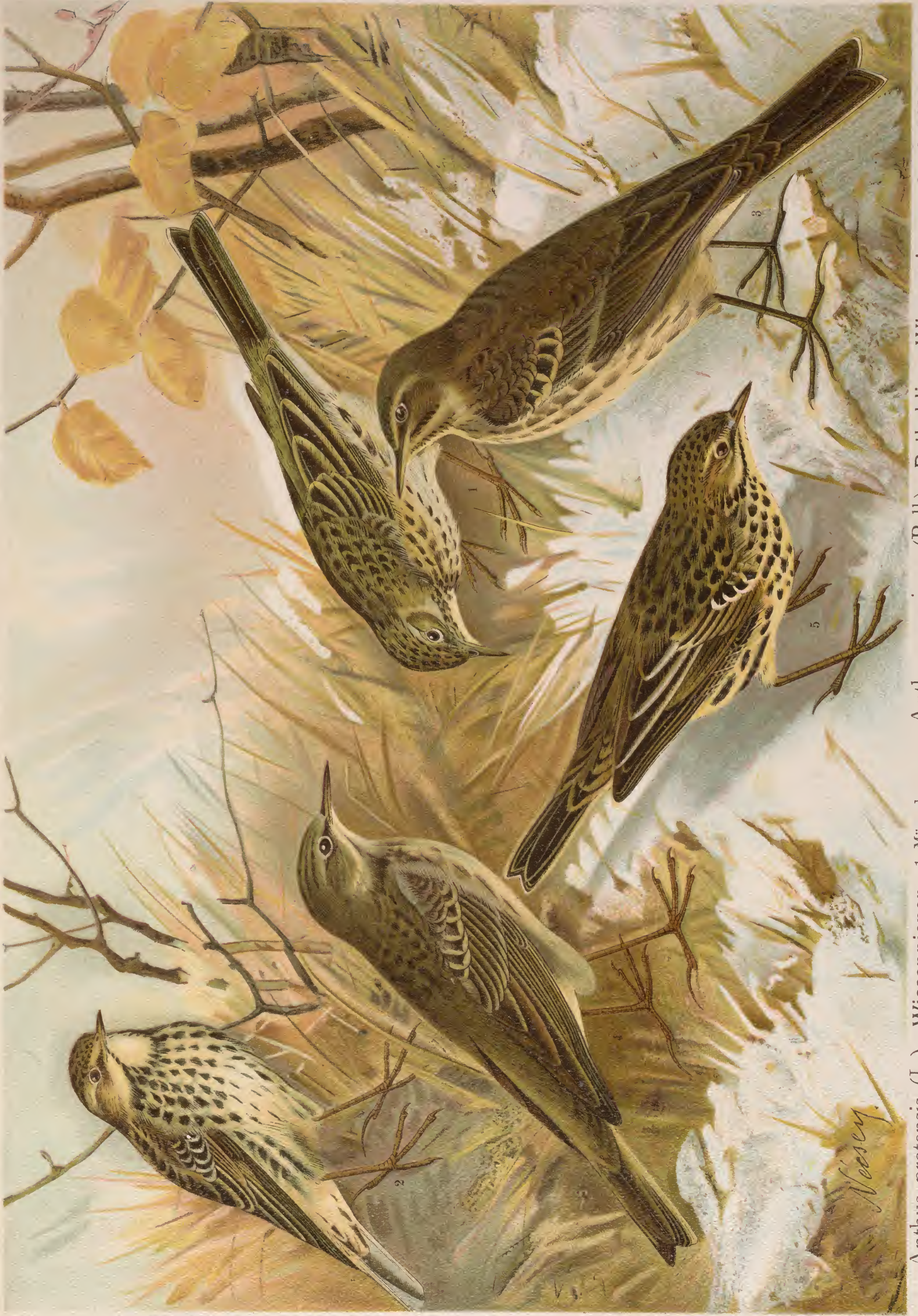
Anthus pratensis (L.). Wiesenpieper. 1 Männchen. Anthus cervinus (Pall.). Rotkehliger Wiesenpieper. 2 und 5 Männchen.