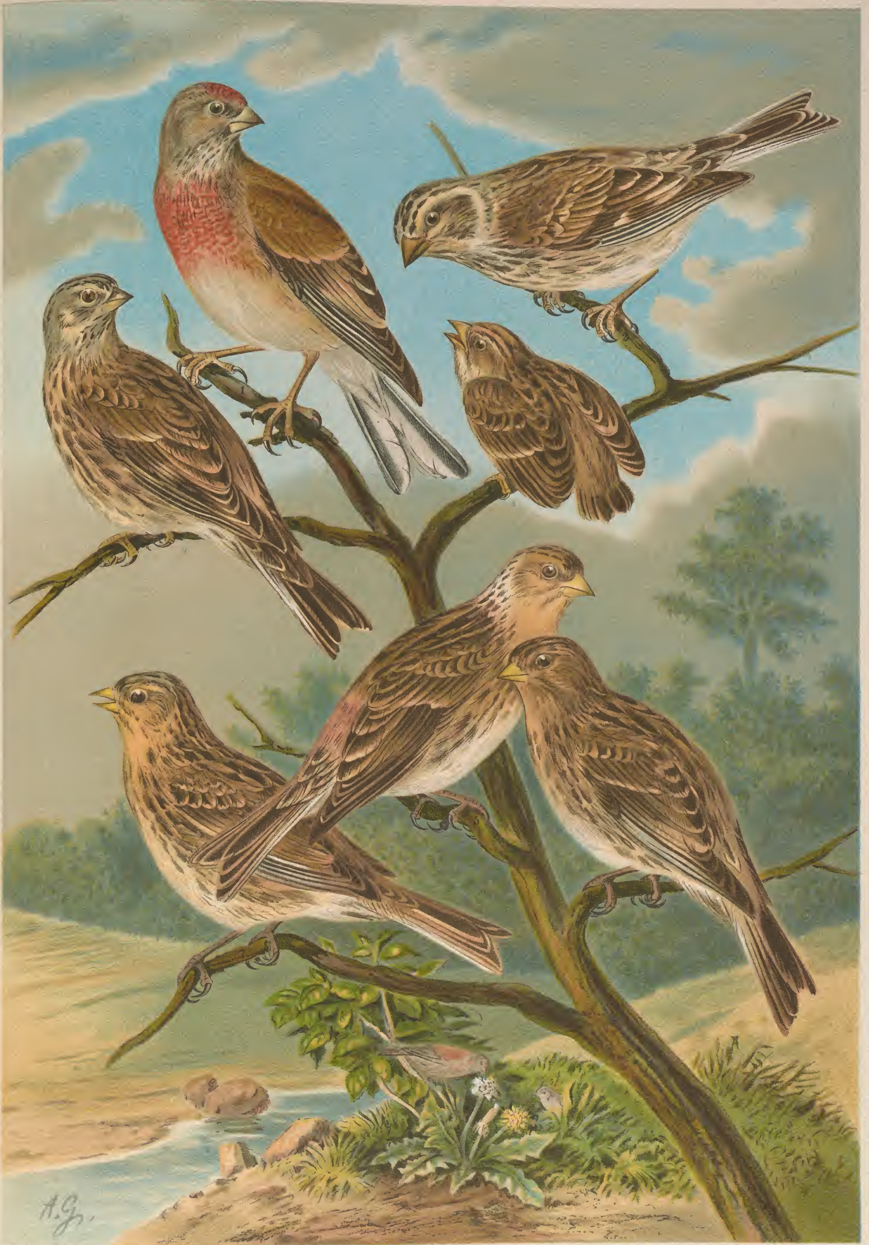
Acanthis cannabina (L.) Bluthänfling. 1 Männchen. 2 Weibchen. 3 und 4 junge Vögel. Acanthis flavirostris (L.) Berghänfling. 5 Männchen. 6 Weibchen. 7 junges Männchen.