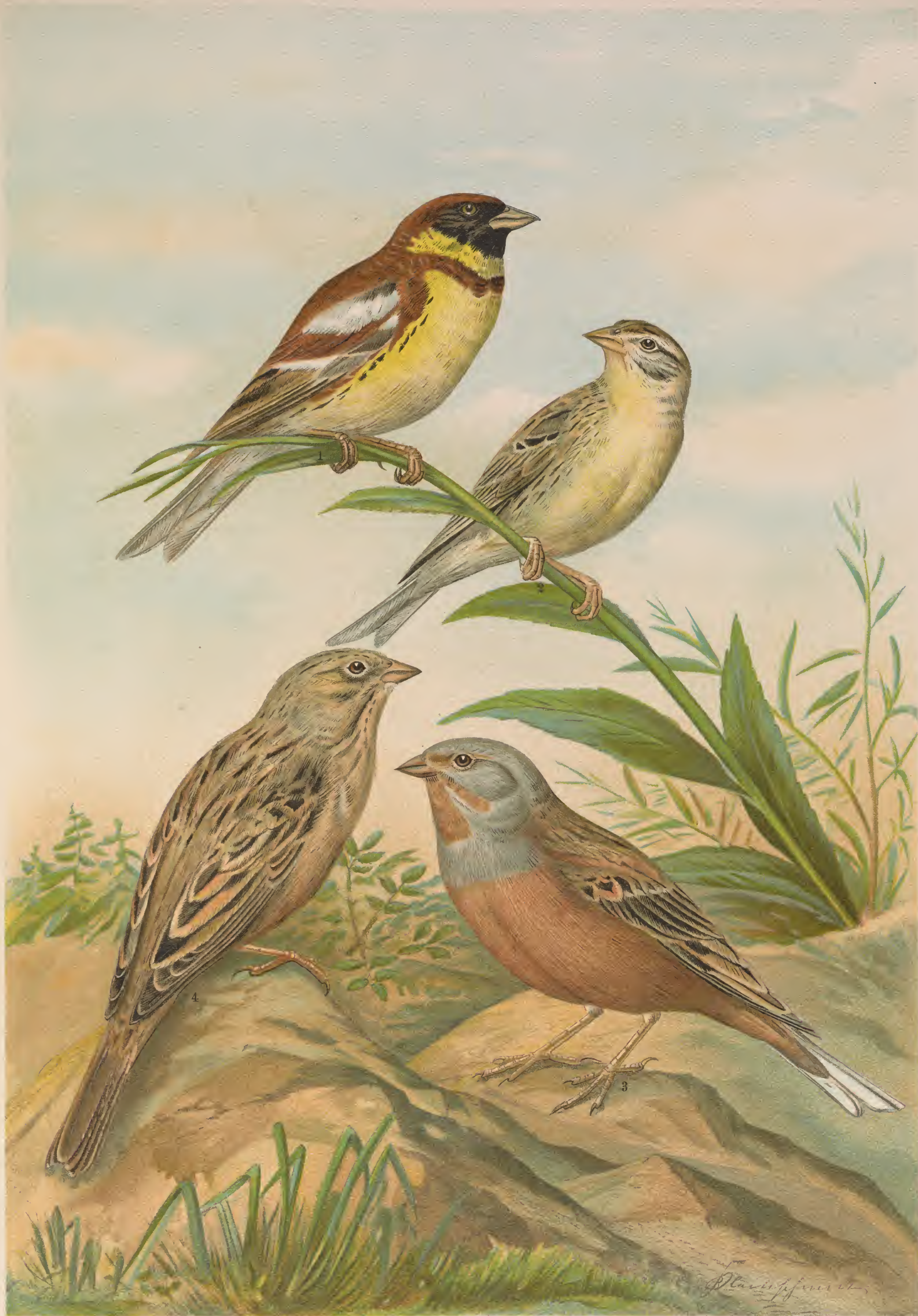
Emberiza aureola Pall. Weidenammer. 1 Männchen. 2 Weibchen. Emberiza caesia Cretschmar. Grauer Ortolan. 3 Männchen. 4 Weibchen.