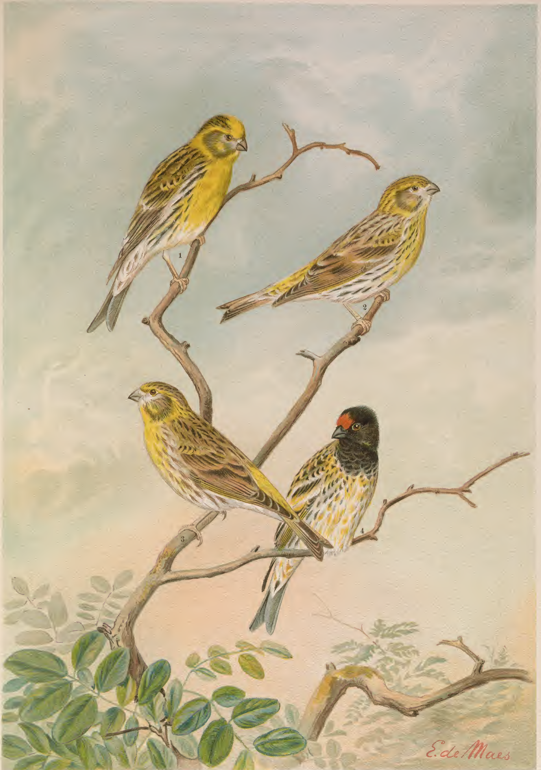
Serinus serinus (L.). Girlitz. 1 Männchen im Sommer, 2 Weibchen, 3 Männchen im Herbst.