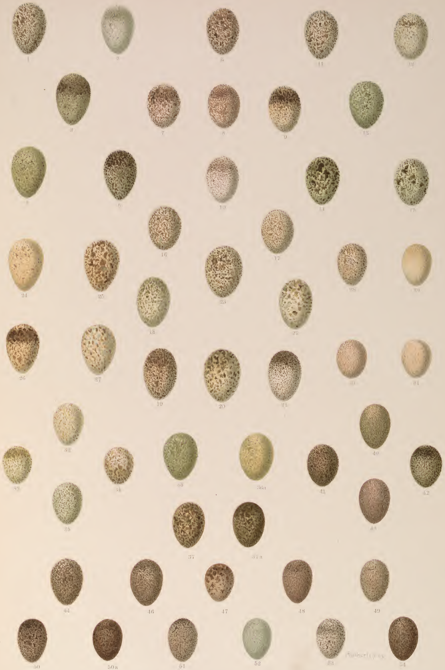
1—5 Alauda arvensis L., Europäische Feldlerche; 6—10 Lullula arborea (L.), Heide-Lerche; 11—15 Galerida cristata (L.), Hauben-Lerche; 16—17 Galerida theklae Brehm, Theklas Haubenlerche; 18—22 Melanocorypha calandra (L.), Kalander-Lerche; 23. Melanocorypha yeltoniensis (Forst.), Mohren-Lerche; 24—27 Melanocorypha sibirica (Gm.), Weissflügel-Lerche; 28—31 Calandrella brachydactyla (Leisl.), Kurzzeilige Lerche; 32—35 Calandrella pispoleta (Pall.), Stummel-Lerche; 36—37a Otocorys alpestris (L.), Alpen-Lerche; 40—43 Anthus spiolella (L.), Wasser-Pieper; 44—46 Anthus obscurus (Lath.), Strand-Pieper; 47—49 Anthus pensilvanicus (Lath.), Nordamerikanischer Wasser-Pieper; 50—54 Anthus pratensis (L.), Wiesen-Pieper.