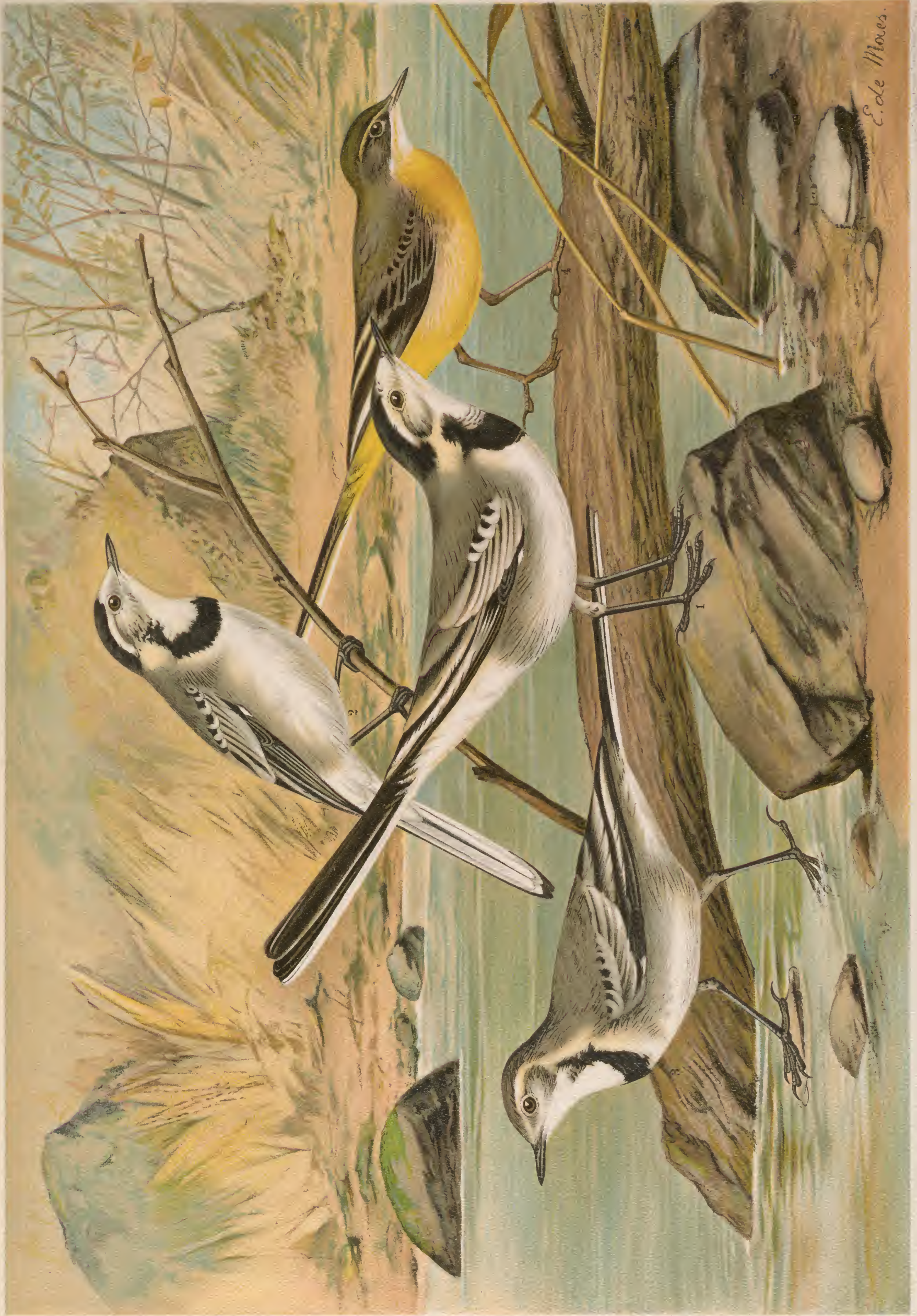
Motacilla alba L. Weisse Bachstelze. 1 Männchen, 2 Weibchen, 3 Weibchen im zweiten Jugendkleide. Motacilla boarula L. Graue Bachstelze. 4 Männchen. 5 Weibchen. 6 Weibchen im zweiten Jugendkleide.