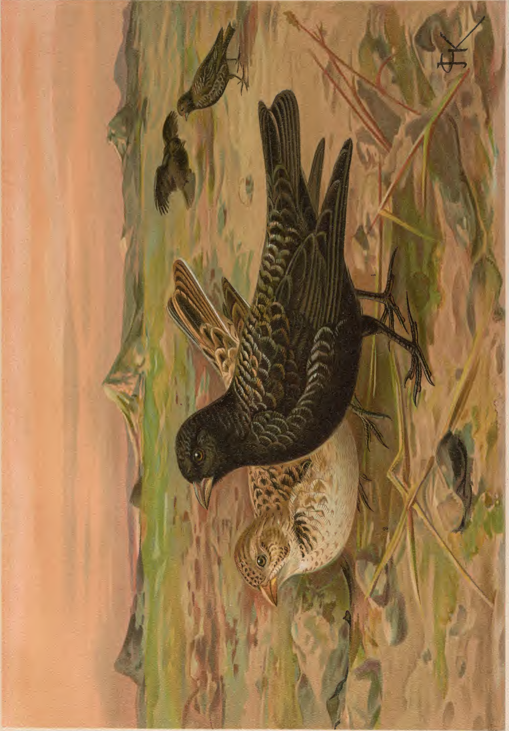
Melanocorypha yeltoniensis (Forst.). Möhrenlerche. 1 Männchen. 2 Weibchen.