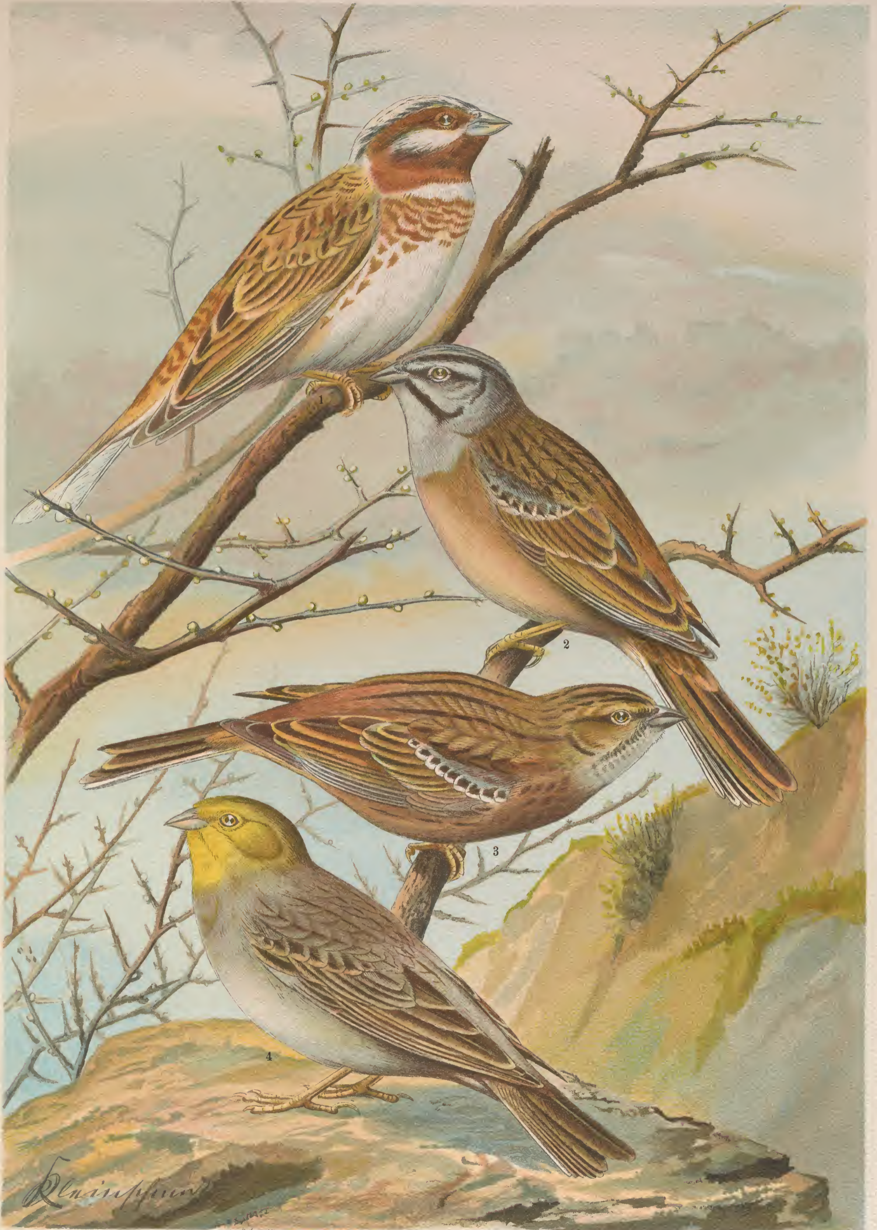
Emberiza leucocephala Gmel. Fichtenammer. 1 Männchen. Emberiza cia L., Zipammer. 2 Männchen. 3 Weibchen.