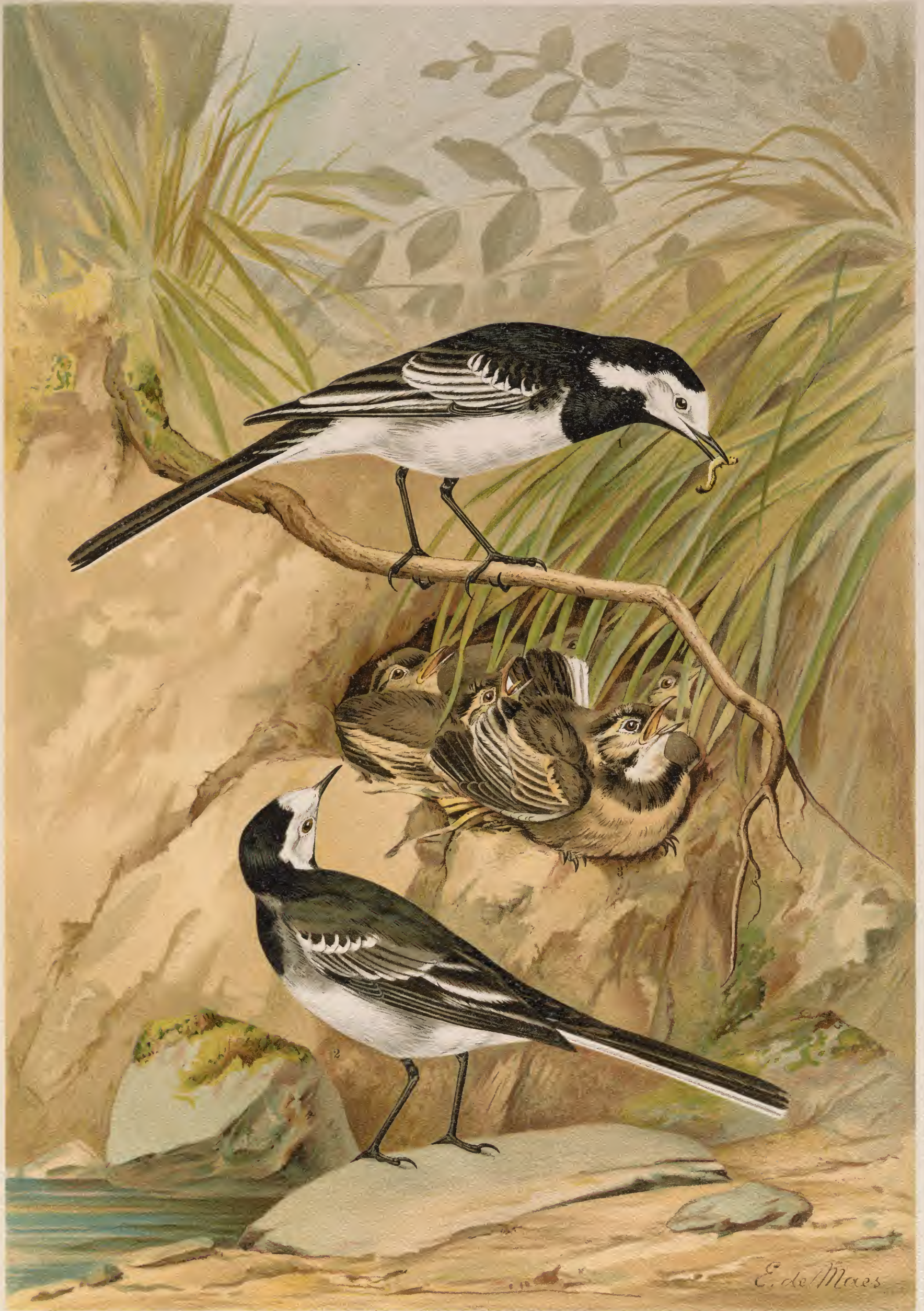
Motacilla lugubris Temm. Schwarze Bachstelze.

1 altes Männchen. 2 altes Weibchen. 3 junger Vogel. (Sommerkleider.)