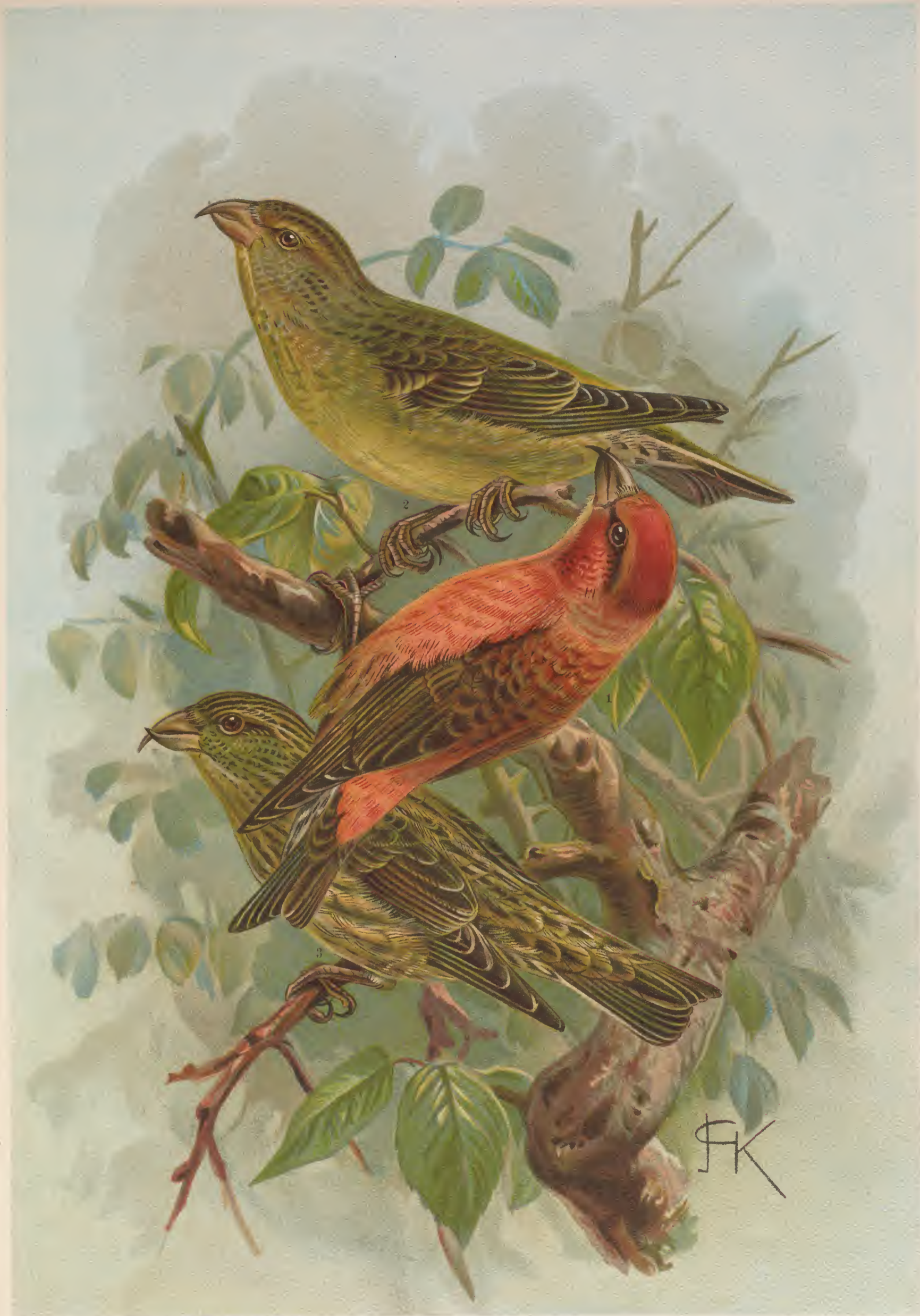
Loxia curvirostra L. Fichtenkreuzschnabel. 1 Männchen, 2 Weibchen, 3 junger Vogel.