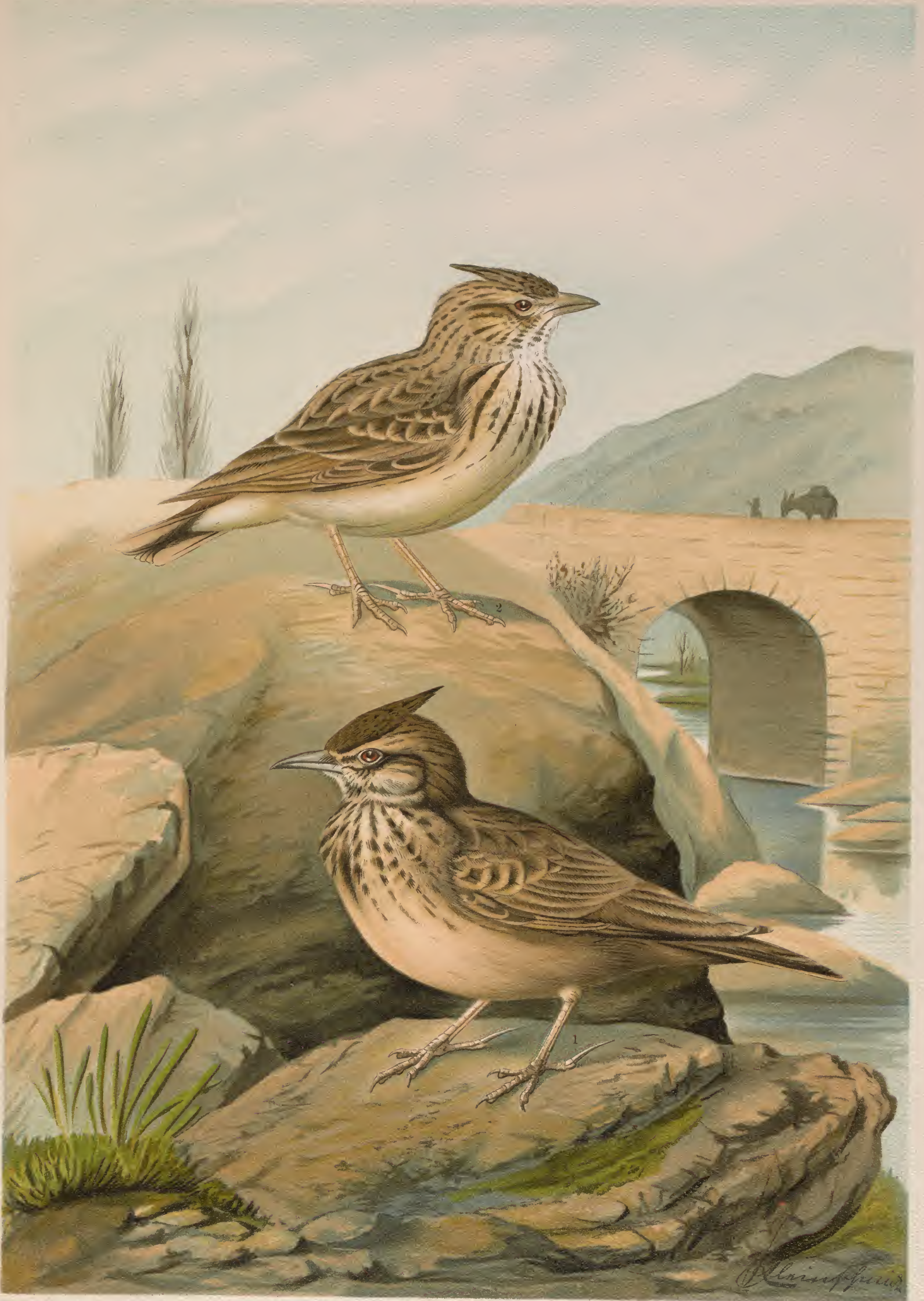
1 Galerida cristata (L.). Haubenlerche. Männchen. 2 Galerida theklae Chr. L. Br. Theklas Haubenlerche. Weibchen.