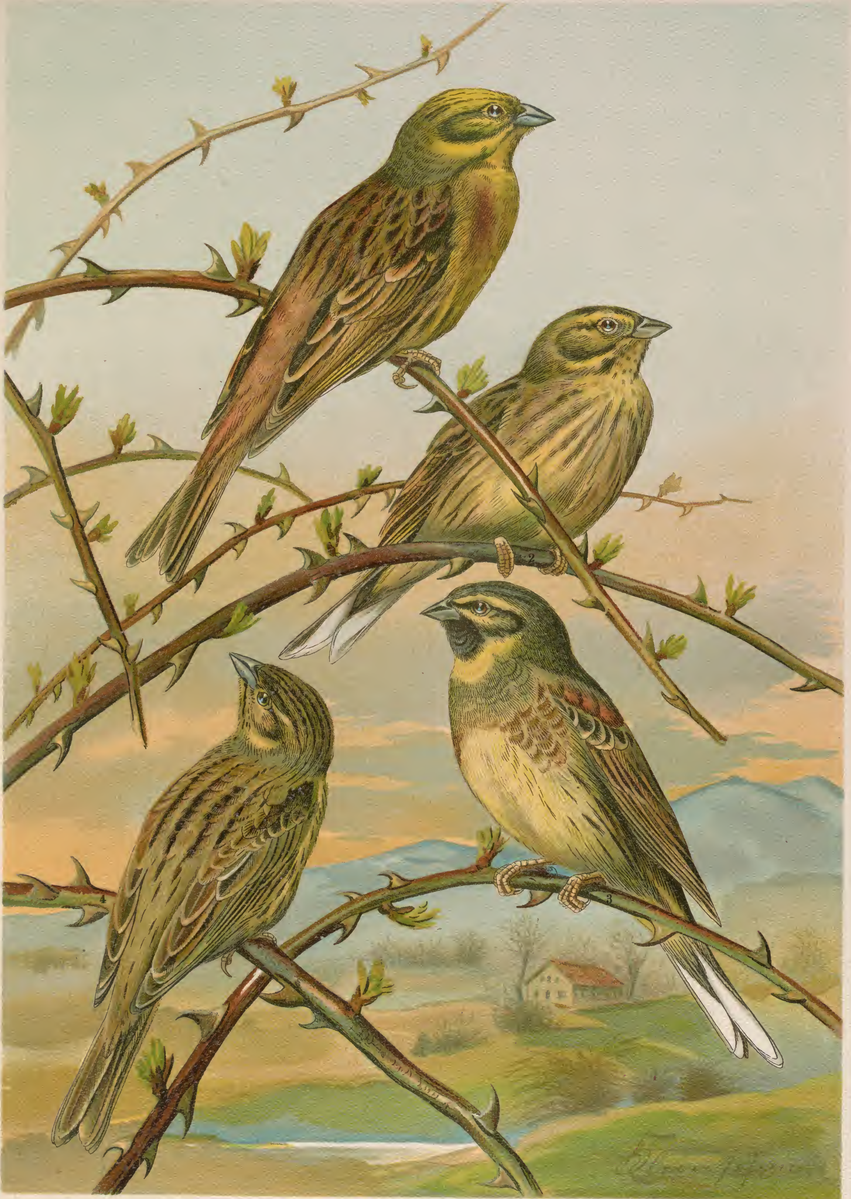
Emberiza citrinella L. Goldammer. 1 Männchen. 2 Weibchen. Emberiza cirulus L. Zaunammer. 3 Männchen. 4 Weibchen.