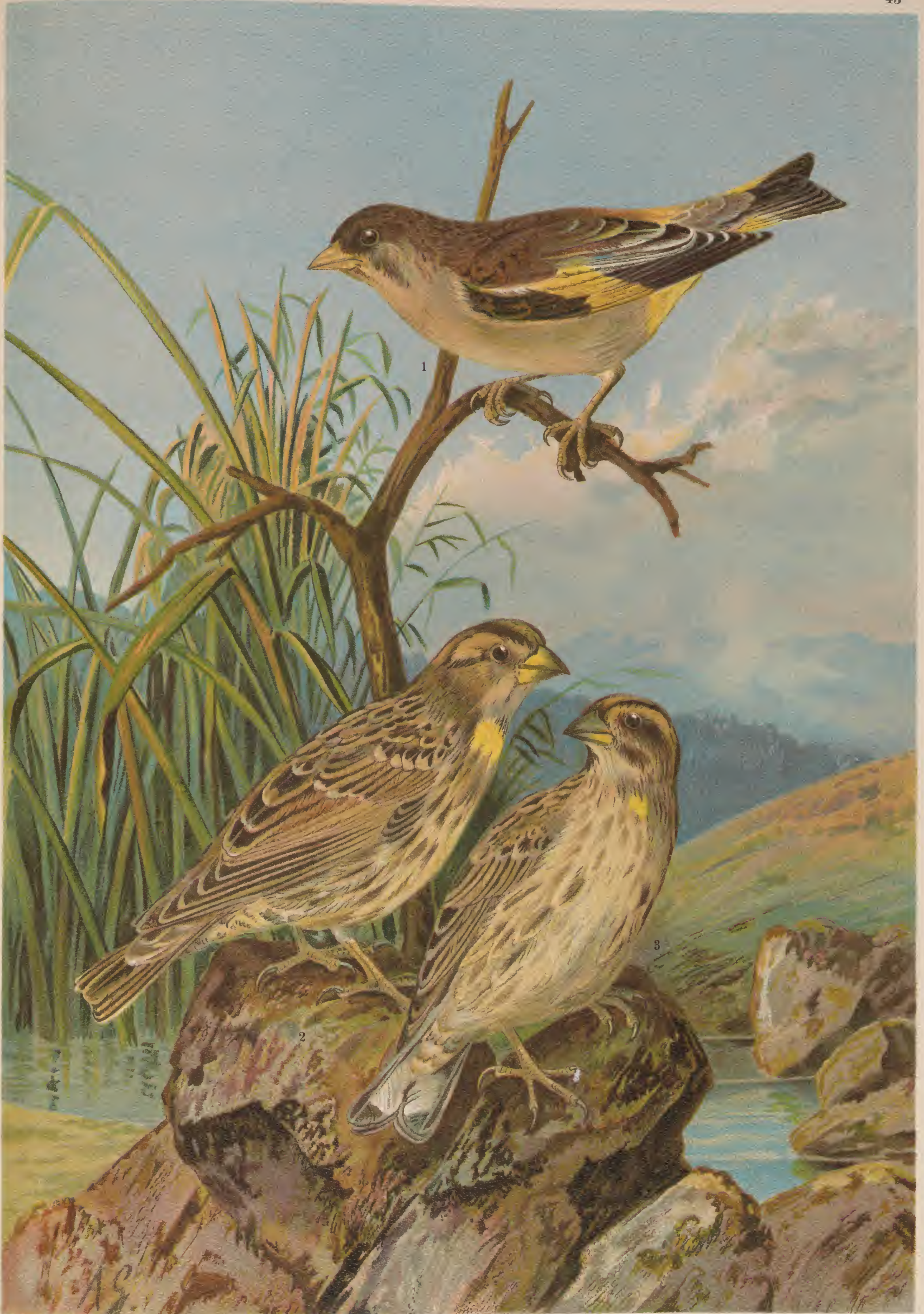
Chloris sinica (L.). Sibirischer Grünling. 1 junges Männchen. Passer petronius (L.). Steinsperling. 2 Männchen. 3 Weibchen. Natürl. Grösse.