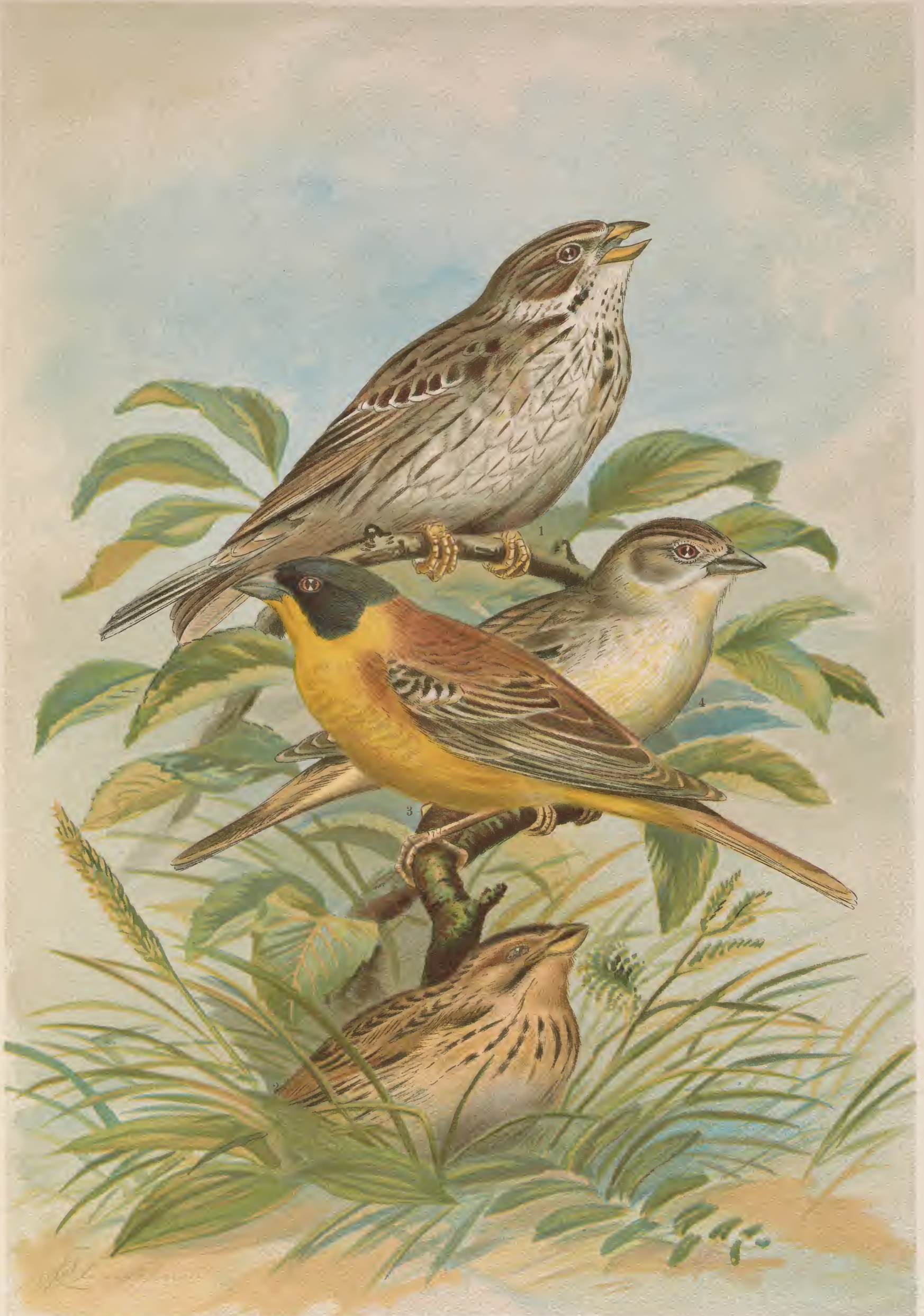
Miliaria calandra (L.). Grauammer. 1 altes Männchen, 2 Männchen im Nestkleide. Emberiza melanocephala Scopoli. Kappenammer. 3 Männchen, 4 Weibchen. Natürl. Grösse.