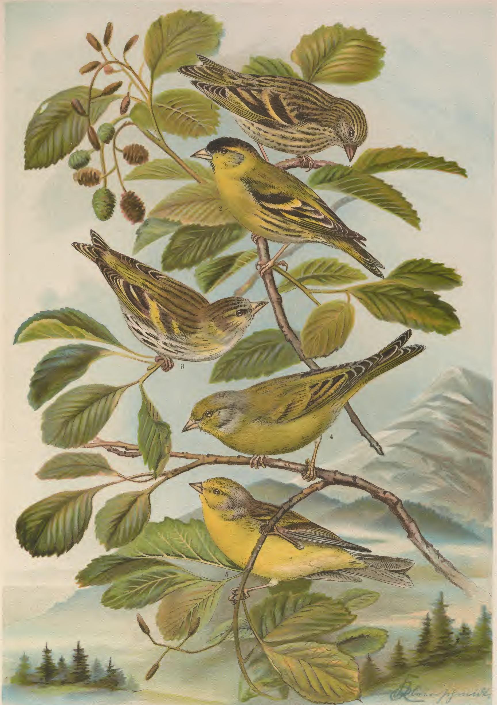
Chrysomitris spinus (L.). Erlenzeisig. Chrysomitris citrinella (L.). Zitronenzeisig. 1 junges Männchen, 2 altes Männchen, 3 altes Weibchen. 4 Männchen.

Chrysomitris corsicanus (König). Korsikanischer Zitronenzeisig. 5 Männchen.