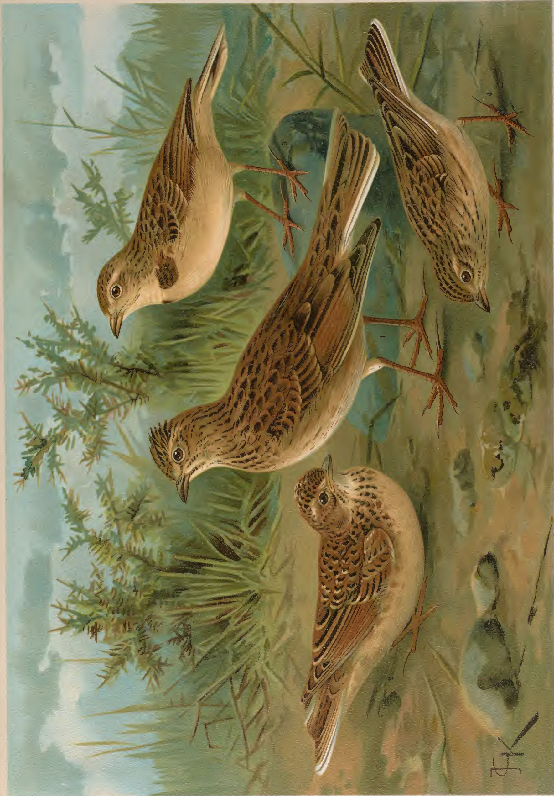
Alauda arvensis L. Feldlerche. 1 altes Männchen. 2 junger Vogel. 3 Calandrella brachydactyla (Leisl.). Kurzzehige Lerche. Männchen.