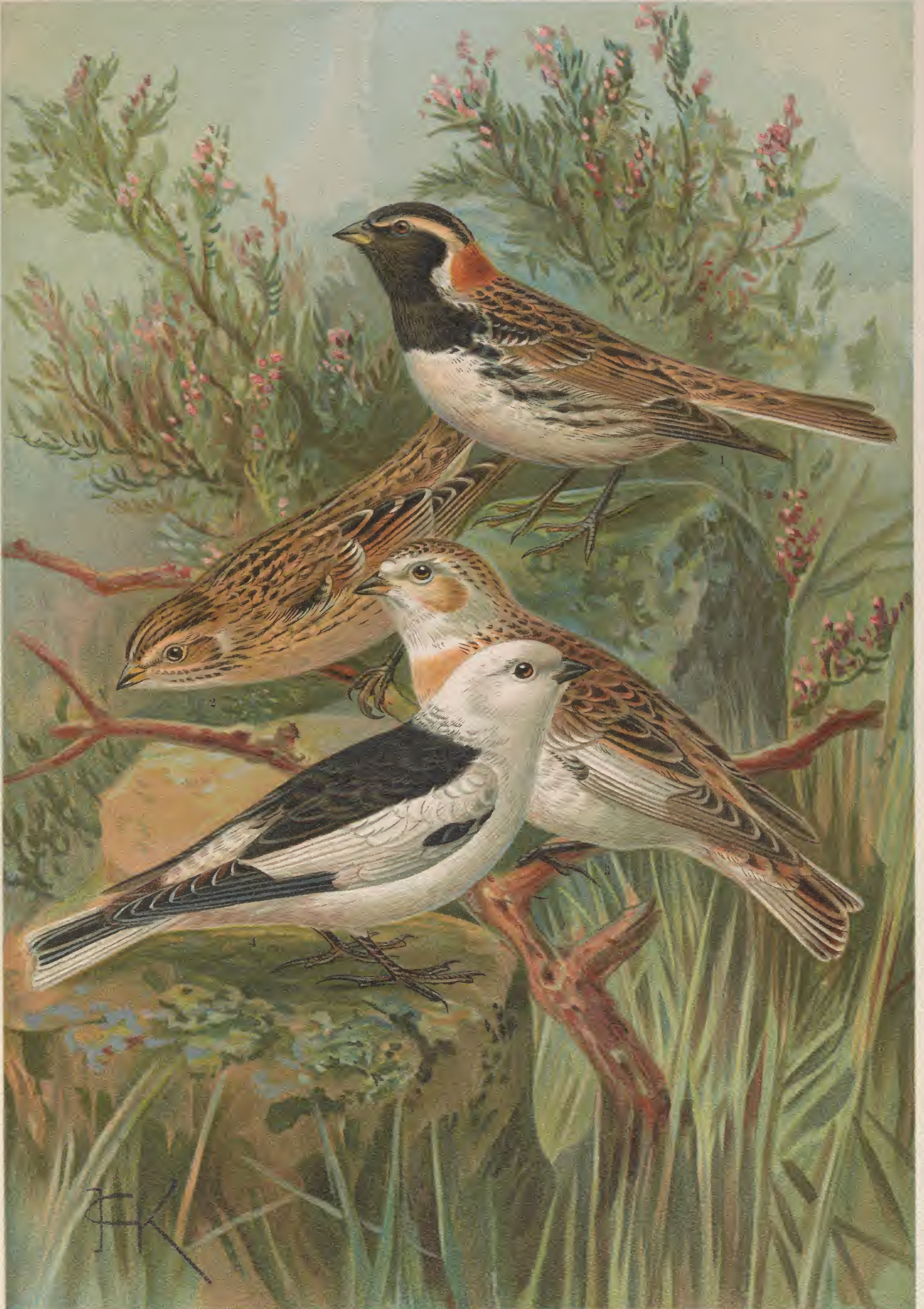
Calcarius lapponicus (L.). Lerchenspornammer. 1 altes Männchen, 2 junges Weibchen.