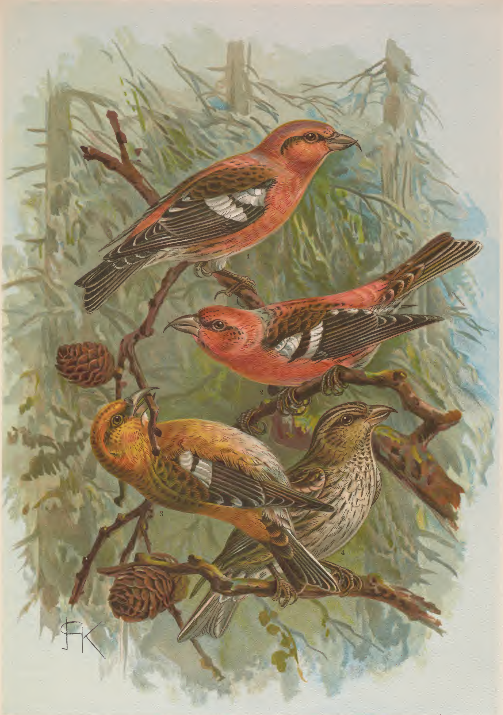
Loxia leucoptera Gm. Weissflügeliger Kreuzschnabel. 1 Männchen.