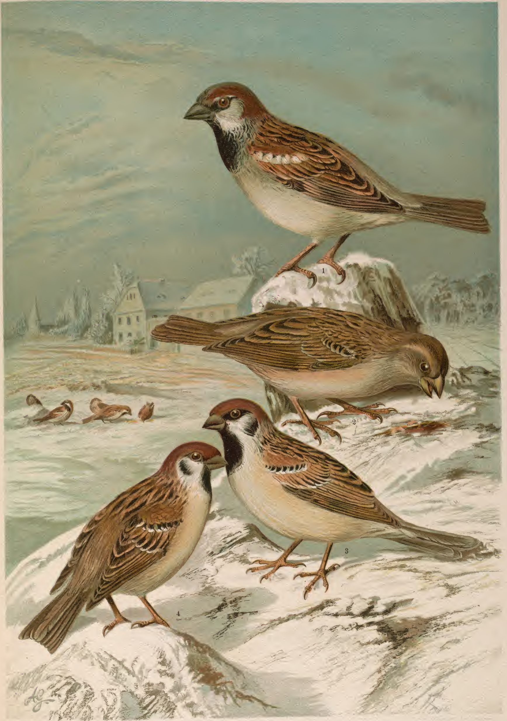
Passer domesticus (L.). Haussperling. 1 Männchen. 2 Weibchen. Passer montanus (L.). Feldsperling. 3 Männchen. 4 Weibchen. Natürl. Grösse.