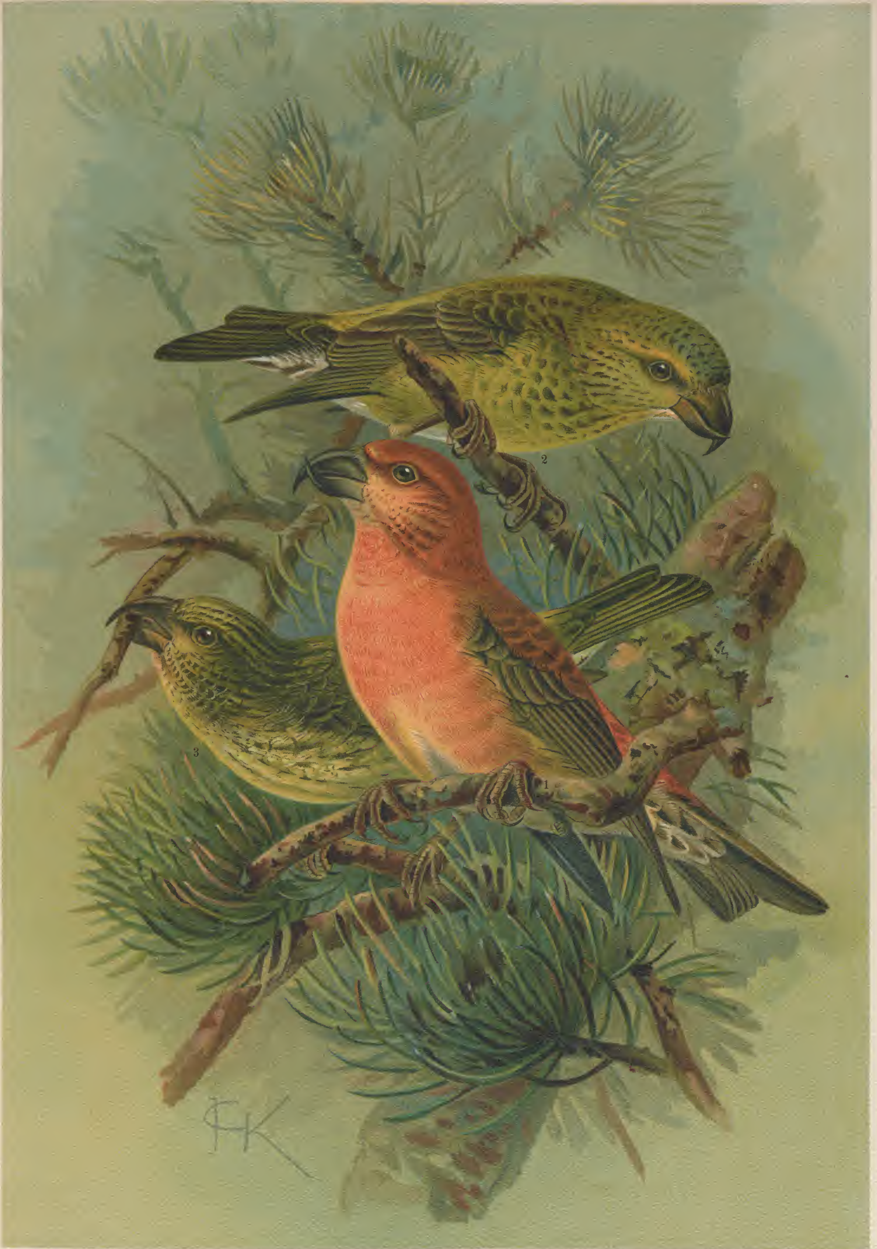
Loxia pityopsittacus Bechst. Kiefernkreuzschnabel. 1 Männchen. 2 Weibchen. 3 Junger Vogel. H. P. v. F. Kugler, Kgl. Ger. Unterhaus Natürl. Grösse.