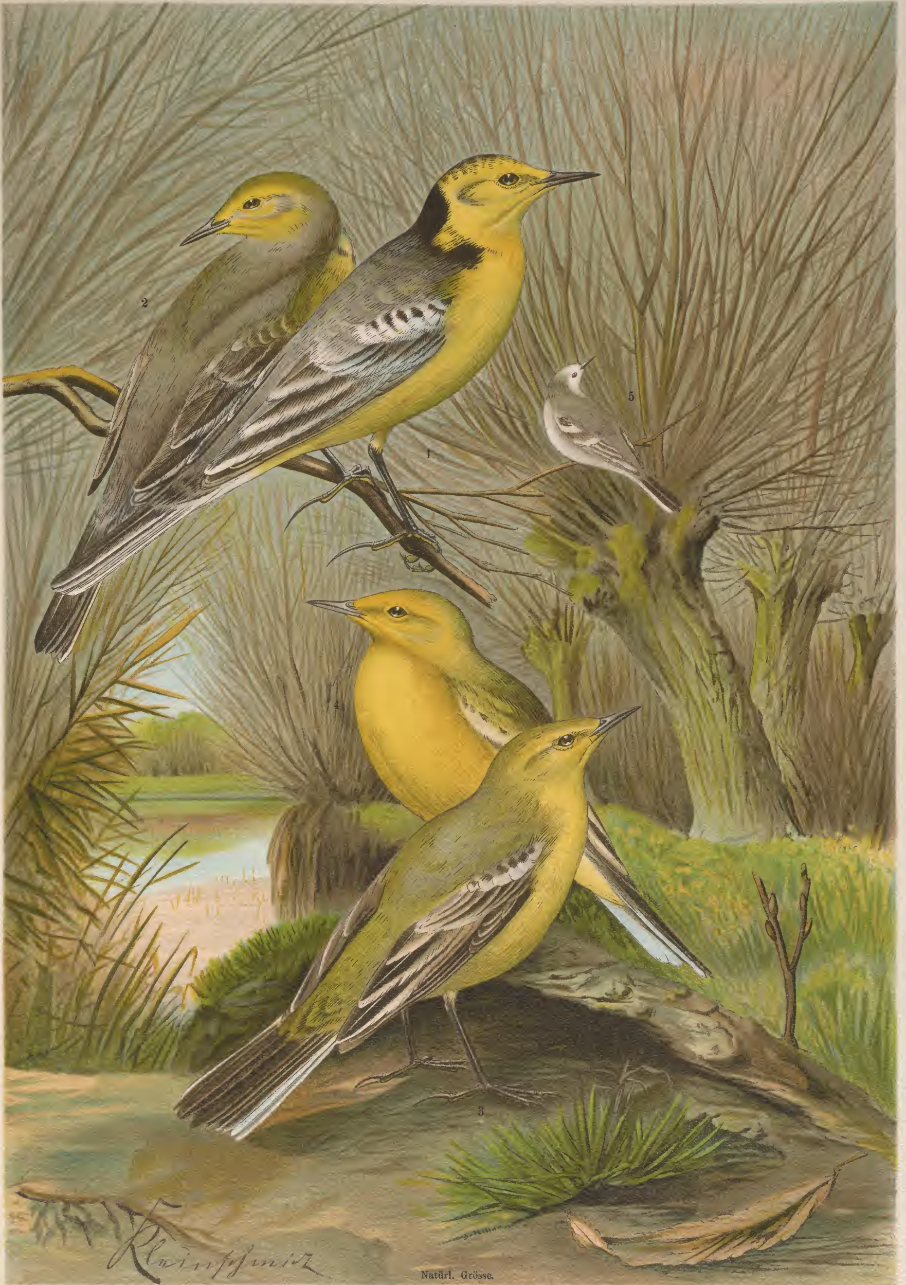
Budytes citreolus (Pall.). Gelbköpfige Bachstelze. 1 Männchen. 2 Weibchen. 5 junger Vogel.