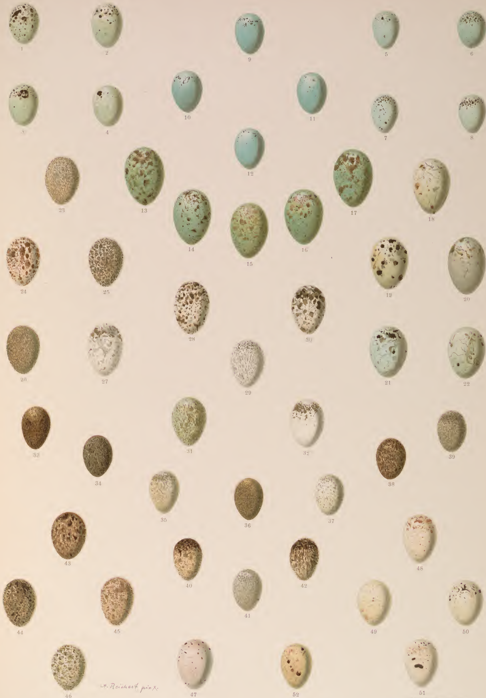
1—4 Pyrrhula pyrrhula (L.) typica , Grosser Gimpel; 5—8 Pyrrhula pyrrhula europaea (Vieill.), Kleiner Gimpel; 9—12 Carpodacus erythrinus (Pall.), Karmingimpel; 13—17 Pinicola enucleator (L.), Fichtengimpel; 18—22 Coccothraustes coccothraustes (L.), Kirsch kernbeisser; 23—32 Passer domesticus (L.), Haussperling; 33—42 Passer montanus (L.), Feldsperling; 43—46 Passer petronius (L.), Steinsperling; 47 Loxia pityopsittacus Bechst., Kiefern-Kreuzschnabel; 48—51 Loxia curvirostra L., Fichten-Kreuzschnabel; 52 Loxia bifasciata Brehm, Zweibindiger Kreuzschnabel.