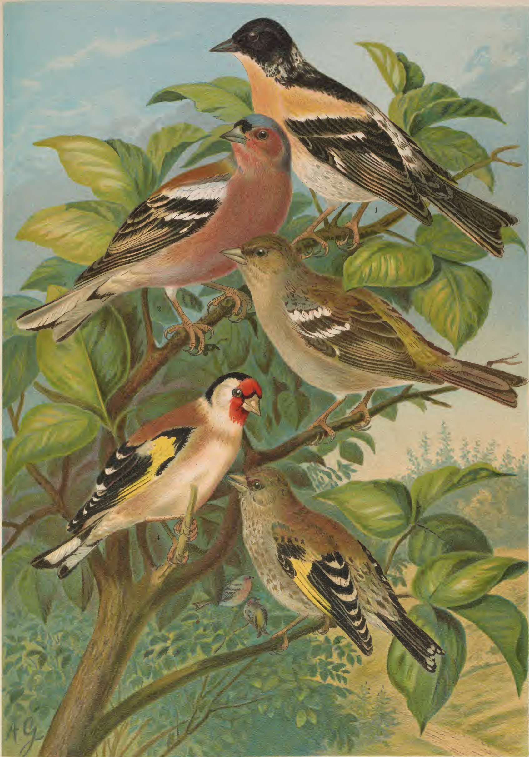
Fringilla montifringilla L. Bergfink. 1 Männchen im Sommer.