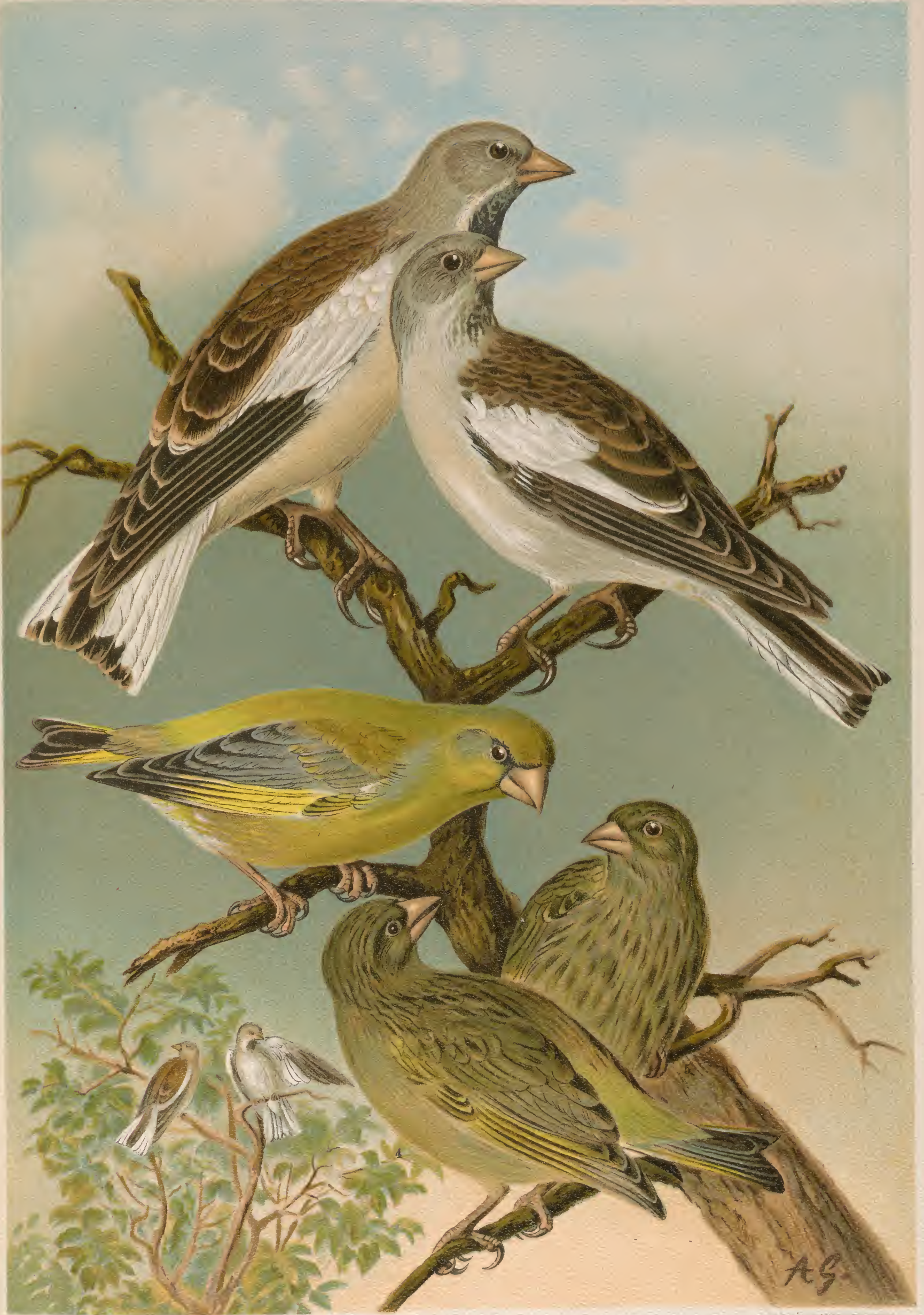
Fringilla nivalis L. Schneefink. 1 Männchen. 2 Weibchen. Chloris chloris (L.). Grünfink. 3 Männchen. 4 Weibchen. 5 junger Vogel.