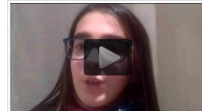
Testimonianza a favore dell'uso di Vikidia di una studentessa delle scuole medie.

anni in russo , da 5 anni in inglese e in catalano , da tre anni in basco e in tedesco e da circa un anno in armeno . Dal 2018 esiste anche in arabo . Esiste anche un progetto simile: Wikikids in