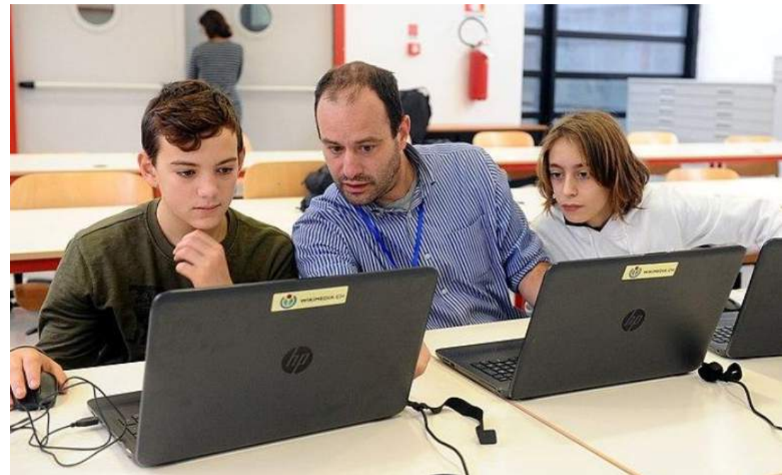
Immagine: Studentesse al lavoro a Cornate d'Adda. di Dario Crespi, CC BY-SA 4.0, via Wikimedia Commons ;

Giovani mappatori in partenza. Di Mbranco2, CC BY-SA 4.0, via Wikimedia Commons