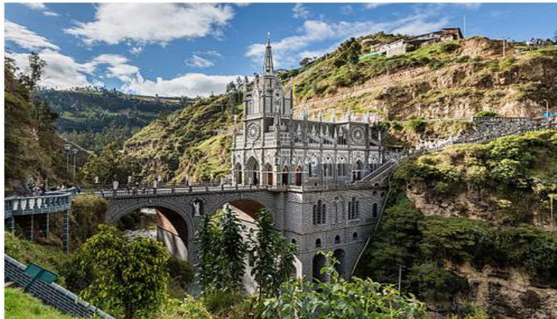
Immagine del giorno

Il santuario de Las Lajas, un luogo di culto e pellegrinaggio costruito nel canyon formato del fiume Guaitara, nel comune di Ipiales in Colombia nel 1750 sul luogo di un'apparizione mariana.