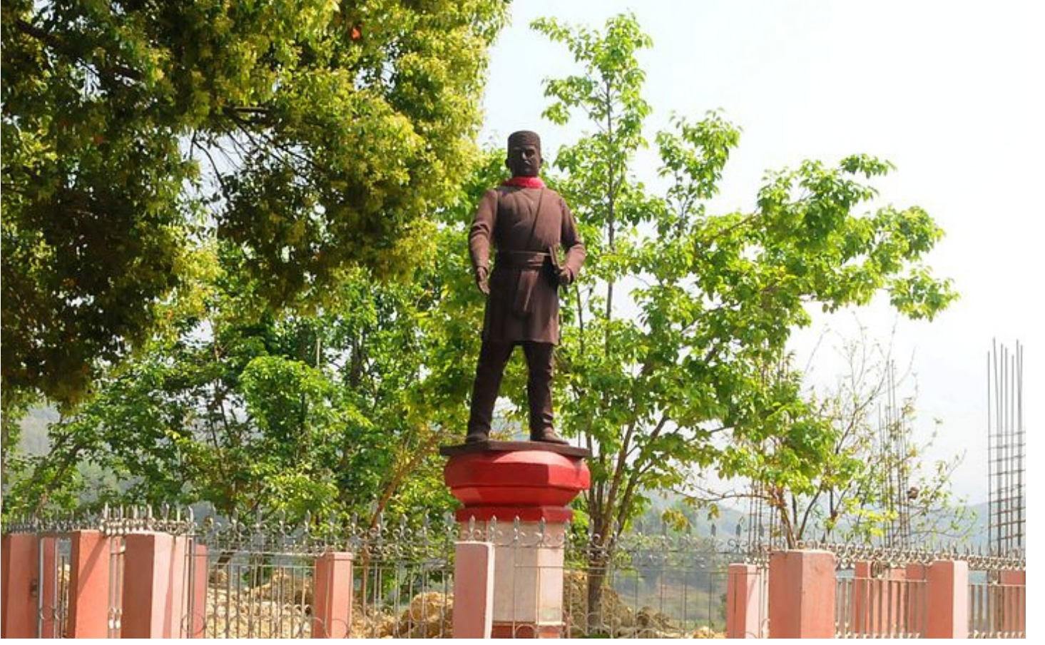
Statue of Bhanubhakta Acharya at Chundi Ramgha by Nabin K. Sapkota / Wikimedia Commons / CC BY-SA 4.0