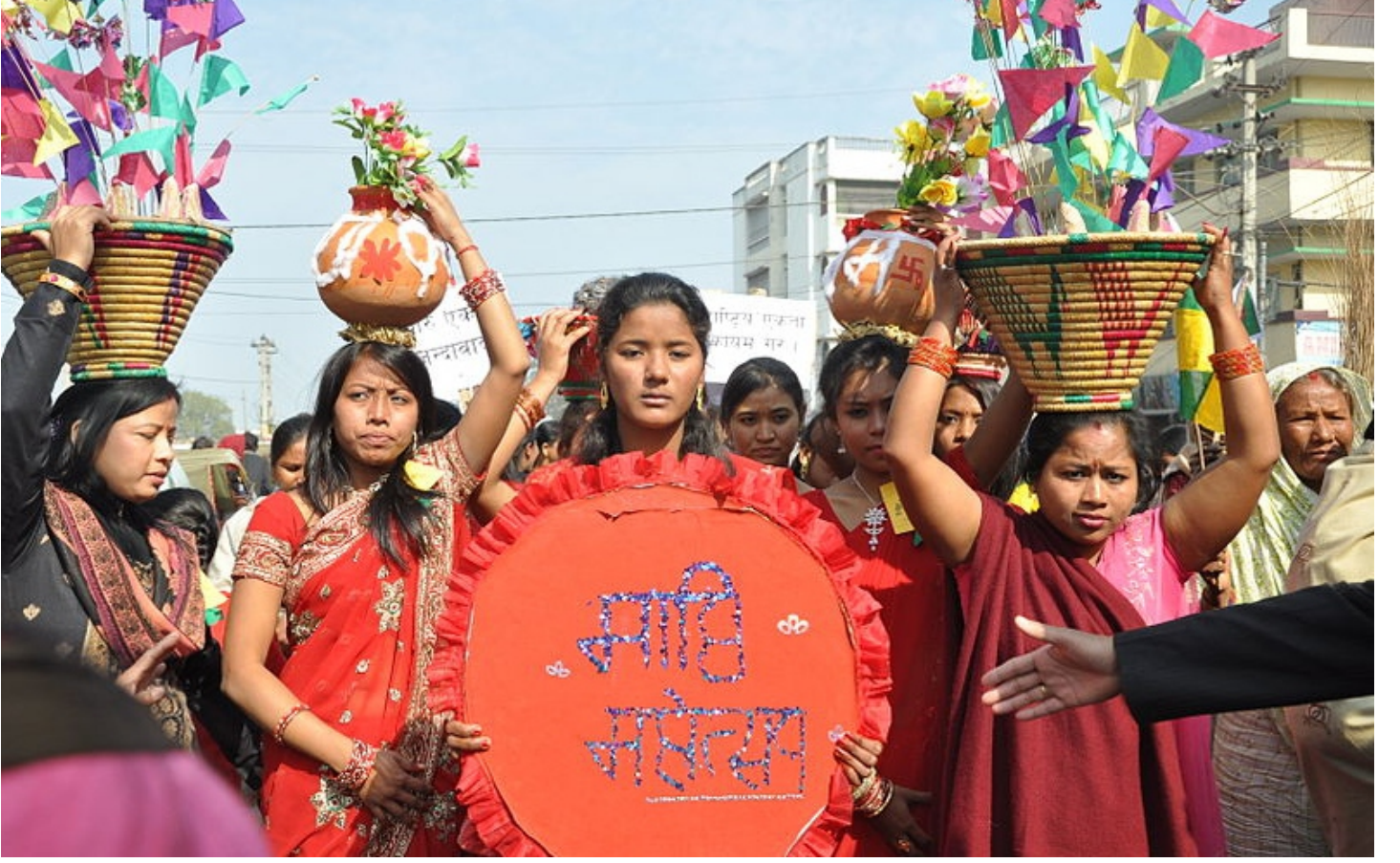
Maghi parwa by Bishal Gauro / Wikimedia Commons / CC BY-SA 3.0