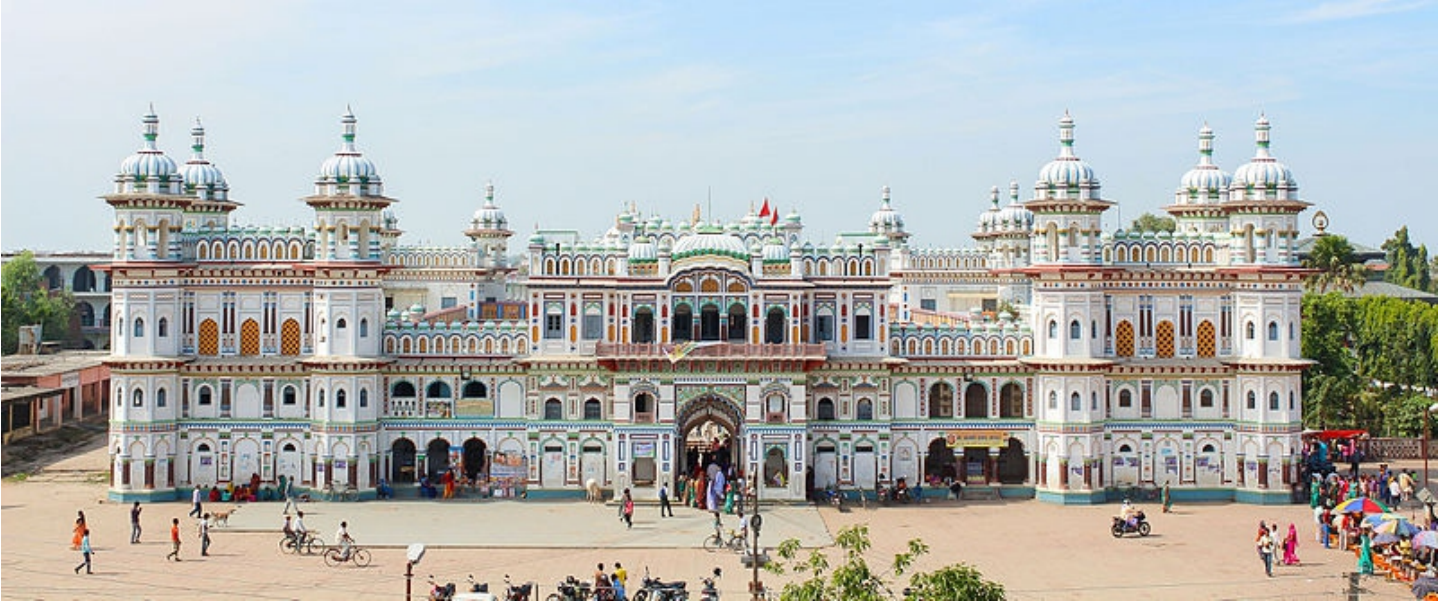
Janaki Mandir

Maithili Wikipedia Link: mai.wikipedia.org | Nepali Wikipedia Link: ne.wikipedia.org Facebook Link: www.facebook.com/wacnofficial