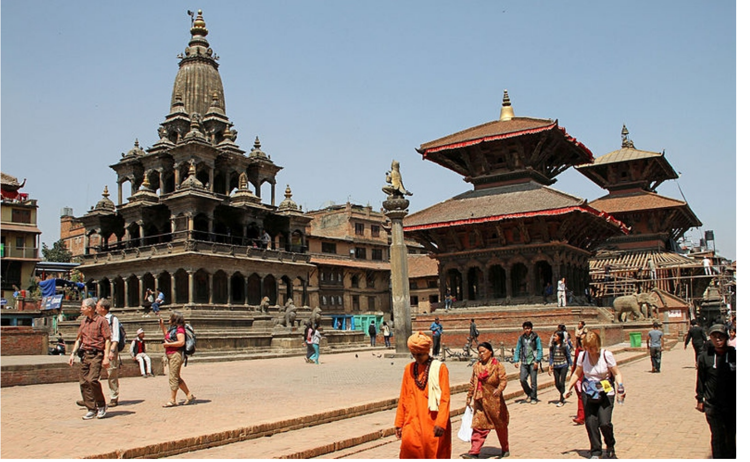
Krishna Mandir, Patan by Gerd Eichmann / Wikimedia Commons / CC BY-SA 4.0