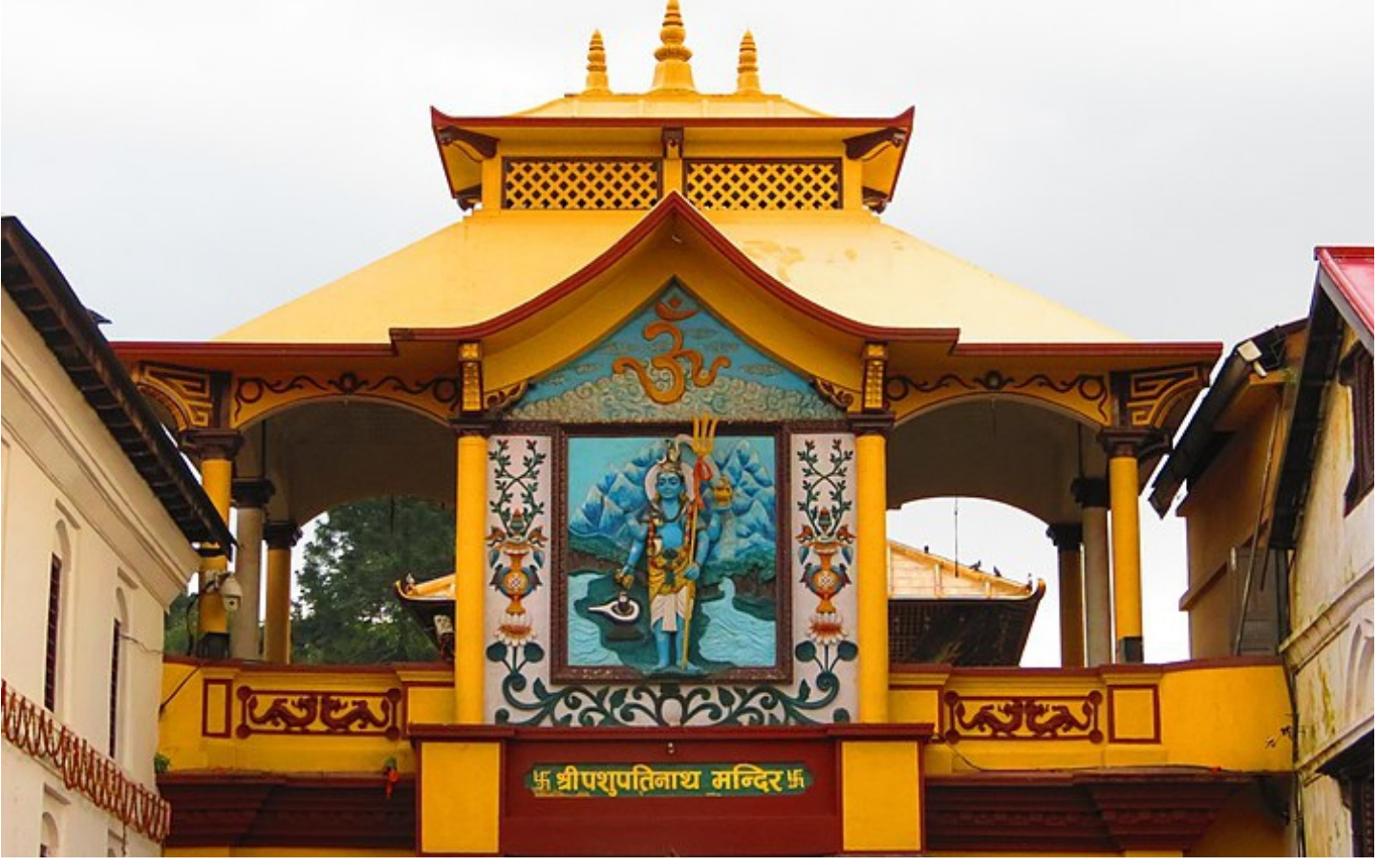
Pashupatinath Temple