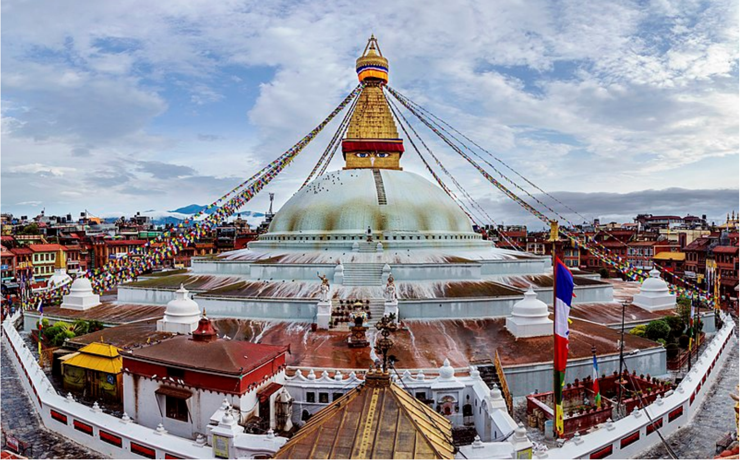
Boudhanath Stupa by Bijay Chaurasia / Wikimedia Commons / CC BY-SA 4.0