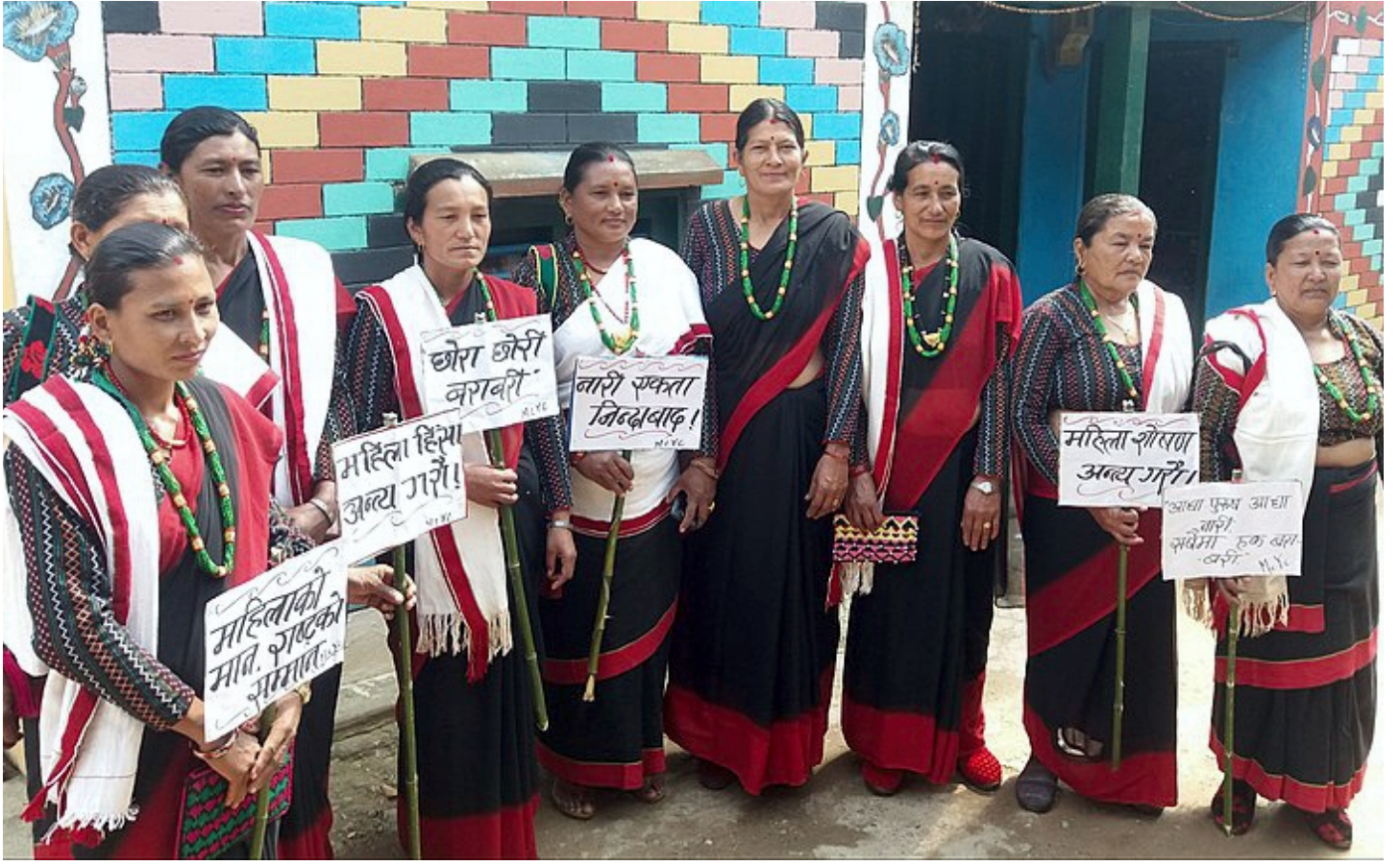
International Women Day by Bhupendra Shrestha / Wikimedia Commons / CC BY-SA 4.0