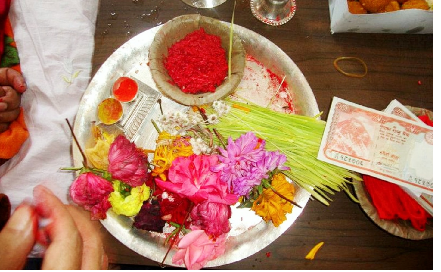
Tika and Jamara, Dashain