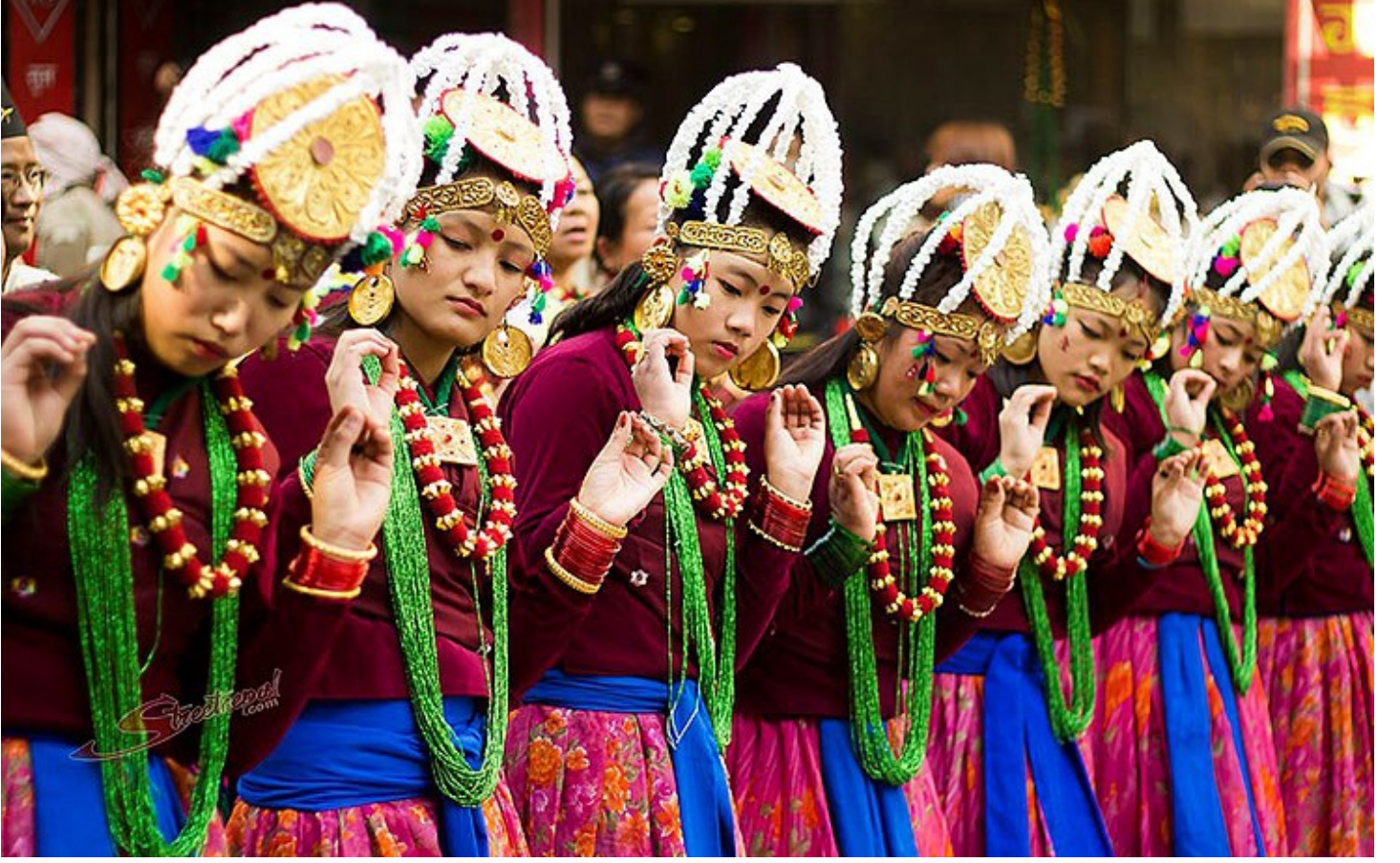
Dance during Tamu Lhosar by Puskapuku123 / Wikimedia Commons / CC BY-SA 4.0