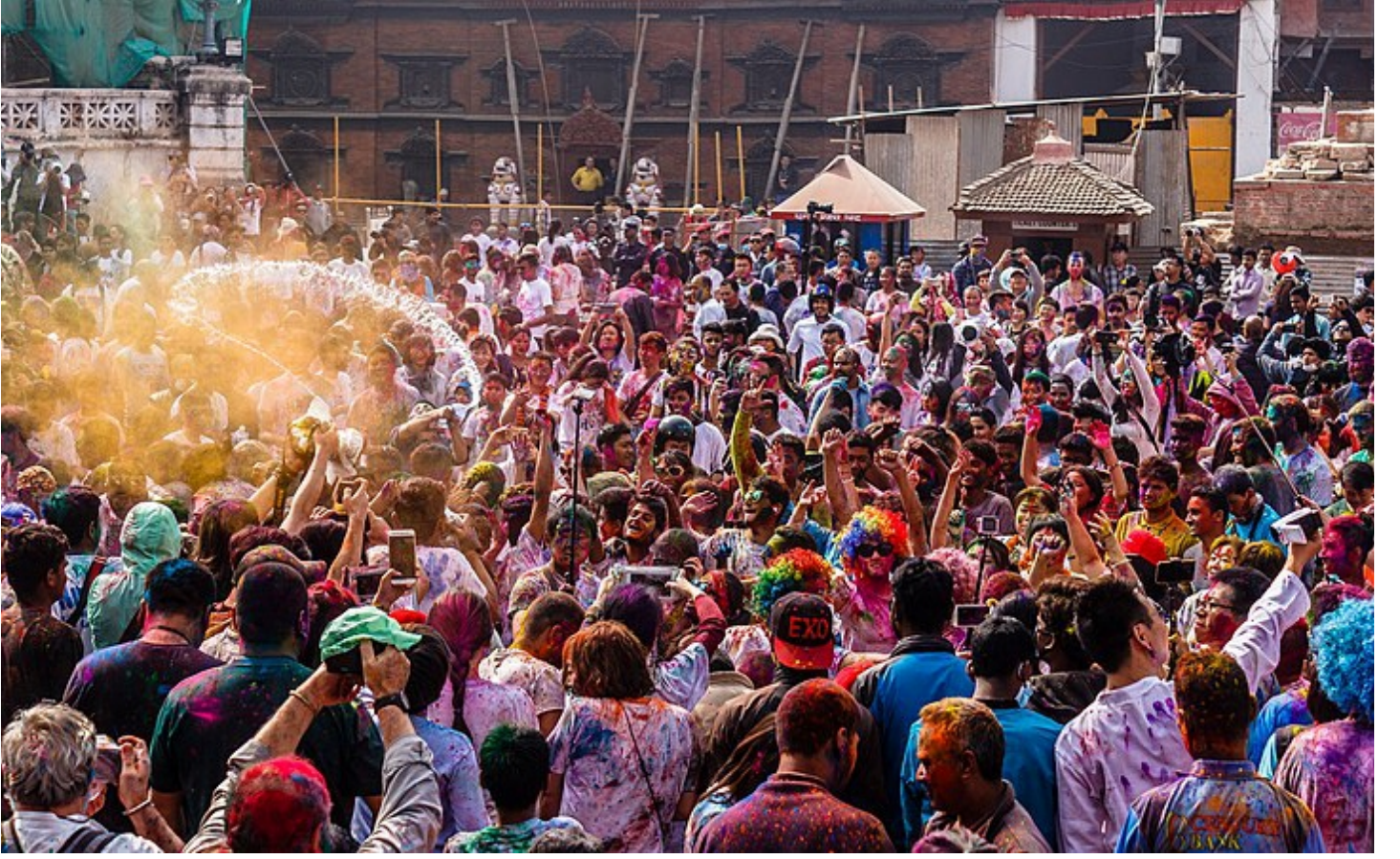
Holi at Basantapur by Bijay Chaurasia / Wikimedia Commons / CC BY-SA 4.0