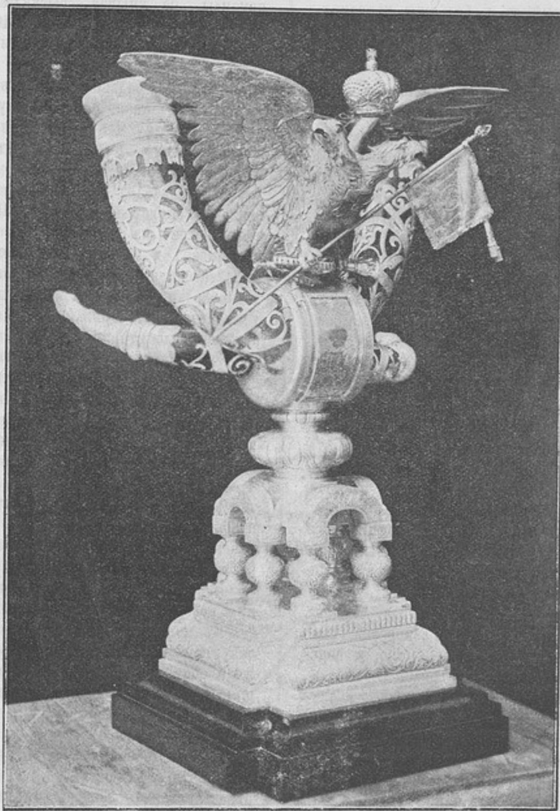
Полковая братина 46-го драгунскаго Переяславскаго полка.

Эти Высочайшія телеграммы, это торжественное, собранное на улицахъ города массы публики, принятіе и перенесенія полкомъ братины, эти тосты и задушевная товарищеская