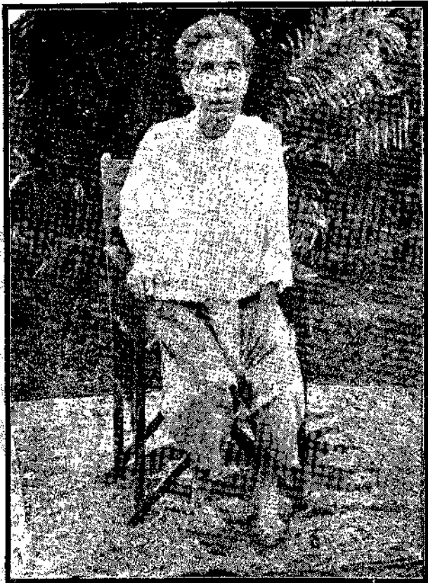
หม่อมวัน นวรัตน์ ฅนอยุชยา (ในพระเจ้าวรวงศ์เธอ กรมหมื่น ตัดทรวงสวัสดิ์)