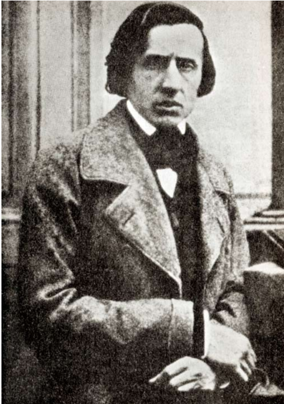
Frédéric Chopin in 1849