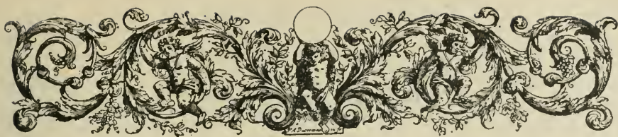
TABLE DES DIVISIONS