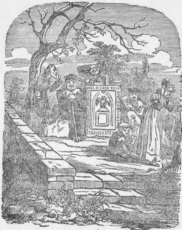
Wat die koffer bevatte.

zijn leven zonderling geweest, laat het hem nu ook zijn in den dood.“ En zoo bleef Uilenspiegel recht overeind in 't graf staan.