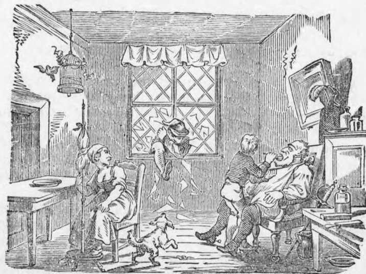
Kort daarop kwam de baas te huis en zag wat er gebeurd was.

„God beware ons voor zulk een knecht,« zuchtte de vrouw.