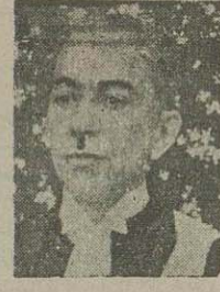
آقای موسوی زاده رئیس شعبه اول دادگاه دیوان کیفر