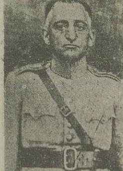
جهانسوزی متهم شرکت در قتل مدرس و دیبا