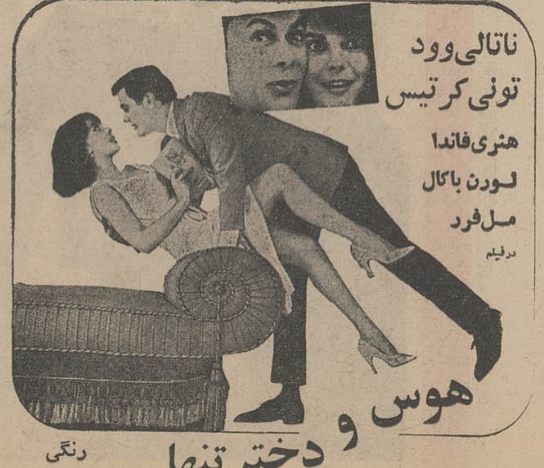
ناتالی وود تونی کرتیس هنری فاند لورن بکال مل فرد دریام

نمایش های سیناکابری در روزهای گذشته با استقبال بسیار خوبی مواجه شده است. در این باره آقایان مدیران سیناکابری میگویند: «ما در این باره بسیار خوشبینیم و امیدواریم که این نمایش ها بتواند به مردم ما را سرگشته کند».