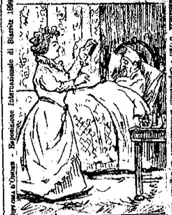
Sta di buon animo; la tua tosse è finita poiché non giuocò le Pastiglie Balsamiche Castellì

Menzione Onorevole - Esposizione Torino 1898