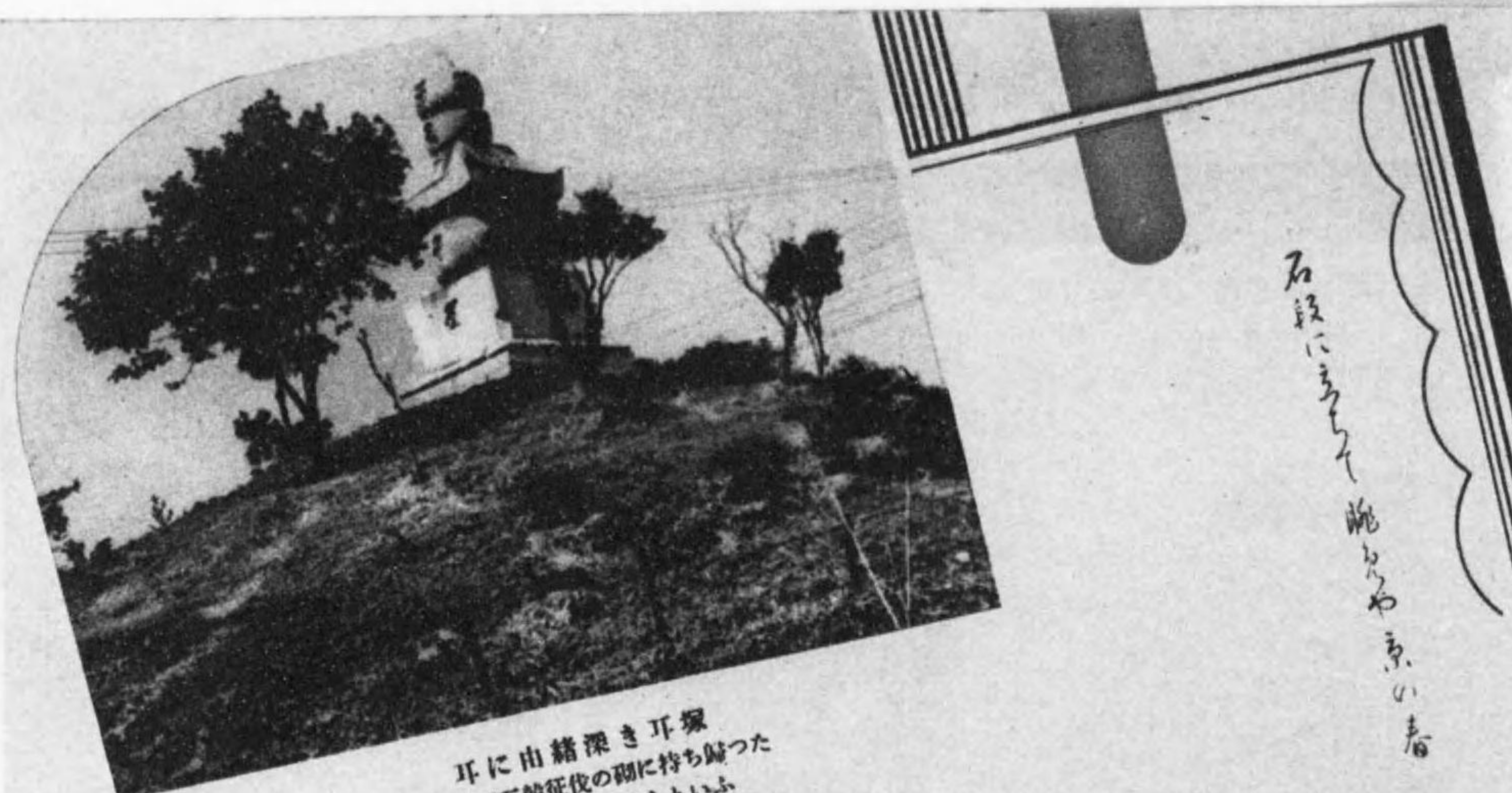
耳に由緒深き耳塚 豊太閤が三韓征伐の際に持ち歸つた 數千の敵兵の耳を埋めたといふ