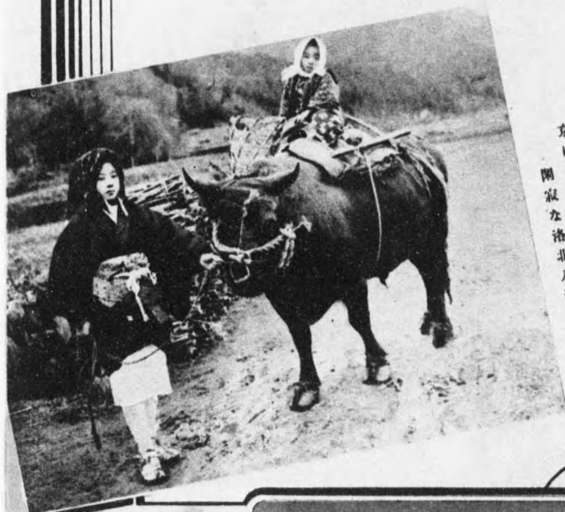
京に田舎あり 閑寂な洛北八瀬の里