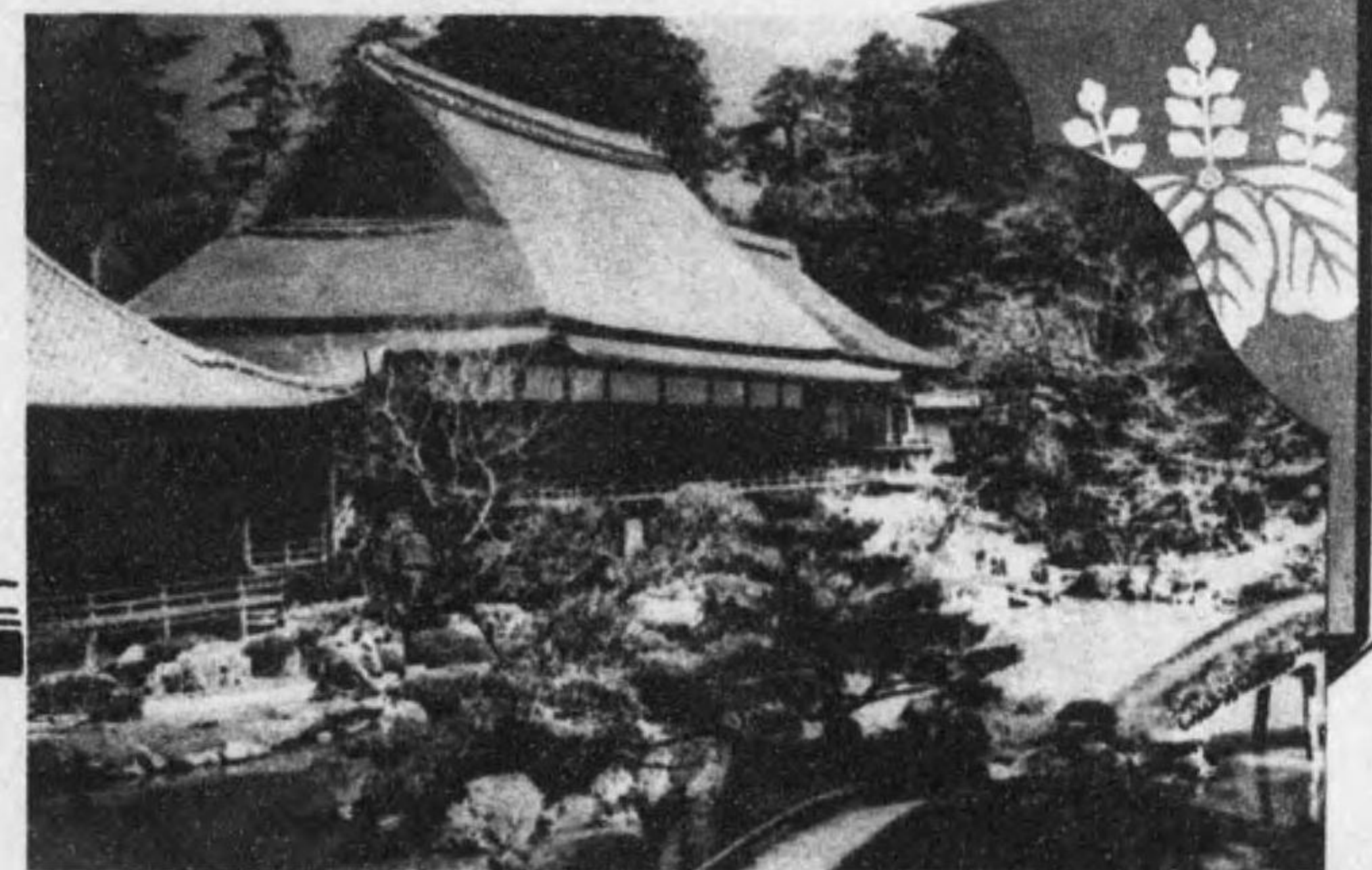
豊太開が花見で有名な高き院の三寶院