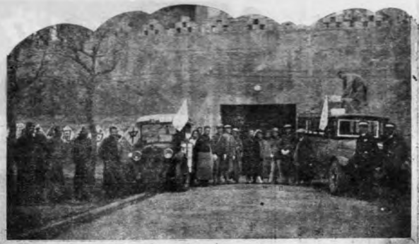
燕下都考古團自北平圍城出發時之光景

國立北平研究院，北京大學及古物保管會合組燕下都考古團，於本年六月間，赴易縣發掘古燕都遺址，曾獲得古物多種，茲將該團在易縣工作實況及所發現各種古物攝影，彙列如下。