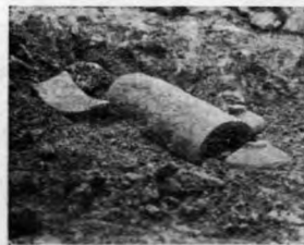
易縣外二區發現之瓦豆等