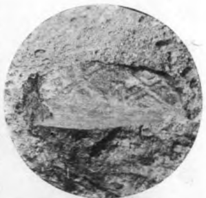
老母台附近發現之漢花紋磚