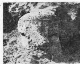
老母台斜溝發現之鐵鎗