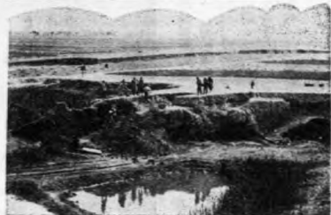
本頁燕下都考古團各片均係國立北平研究院贈刊

國立北平研究院，北京大學及古物保管會合組燕下都考古團，於本年六月間，赴易縣發掘古燕都遺址，曾獲得古物多種，茲將該團在易縣工作實況及所發現各種古物攝影，彙列如下。