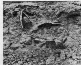
井莊發發現之棺狀(一)