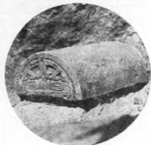
易縣老母台發現之瓦當