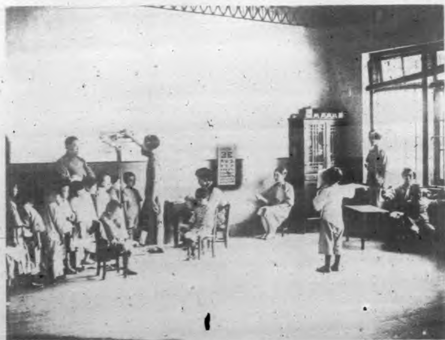
執行健康檢查圖(二)