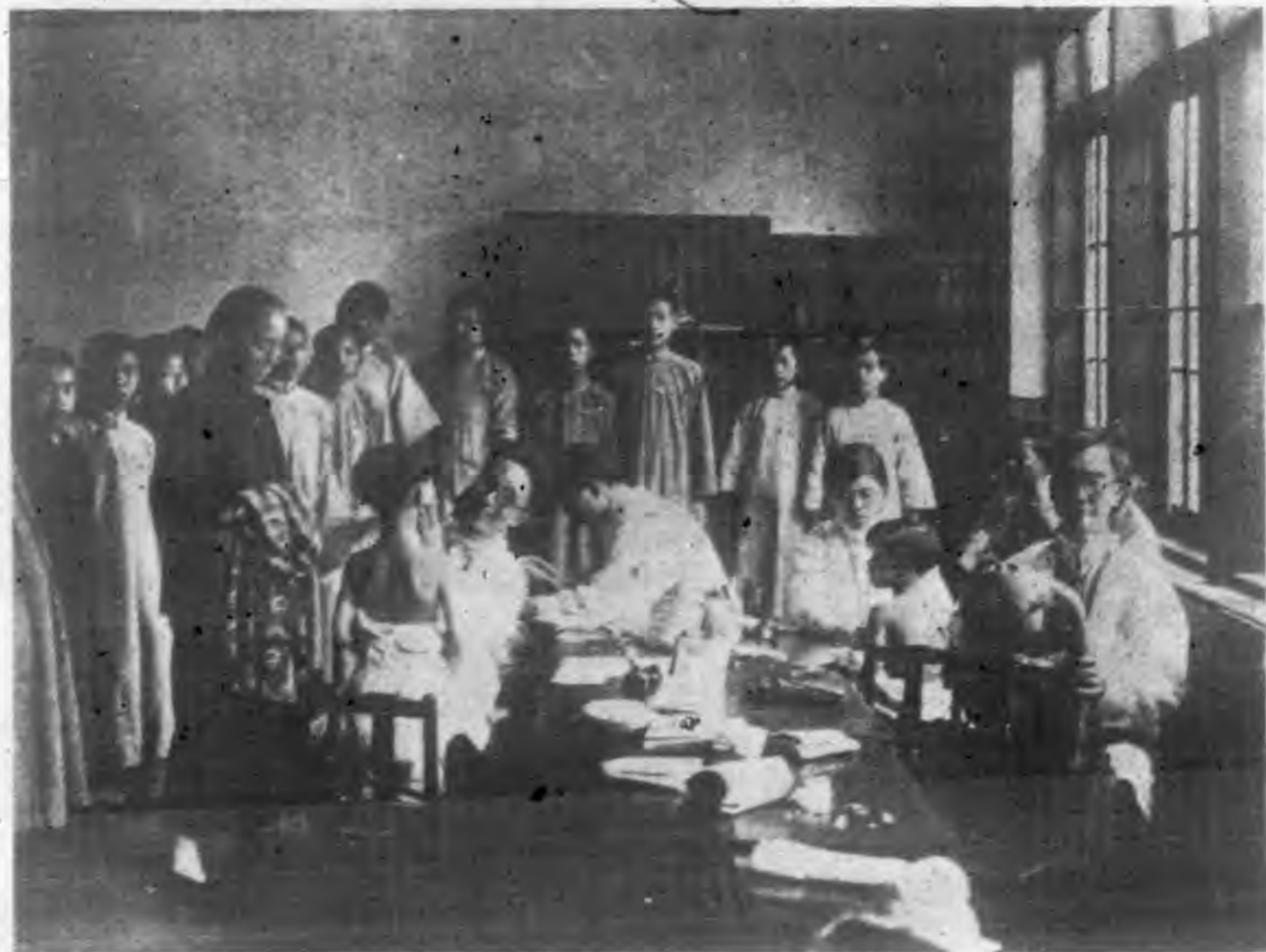
執行健康檢查圖(一)