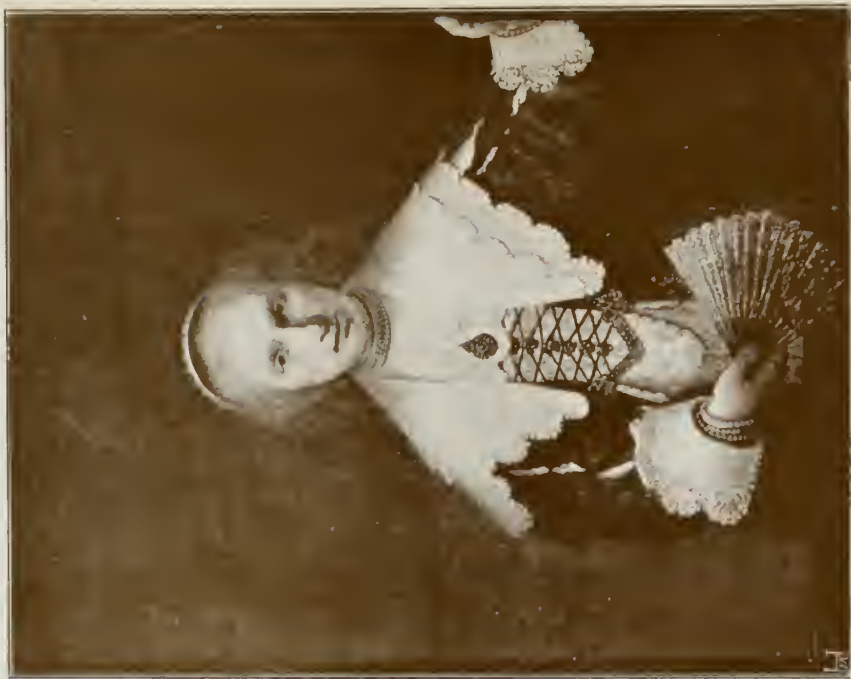
DAME MIT DEM FÄCHER