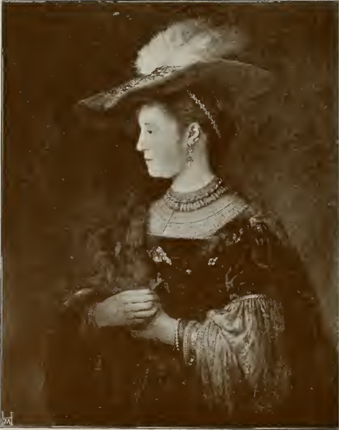
SASKIA VAN UYLENBURGH (als Braut)