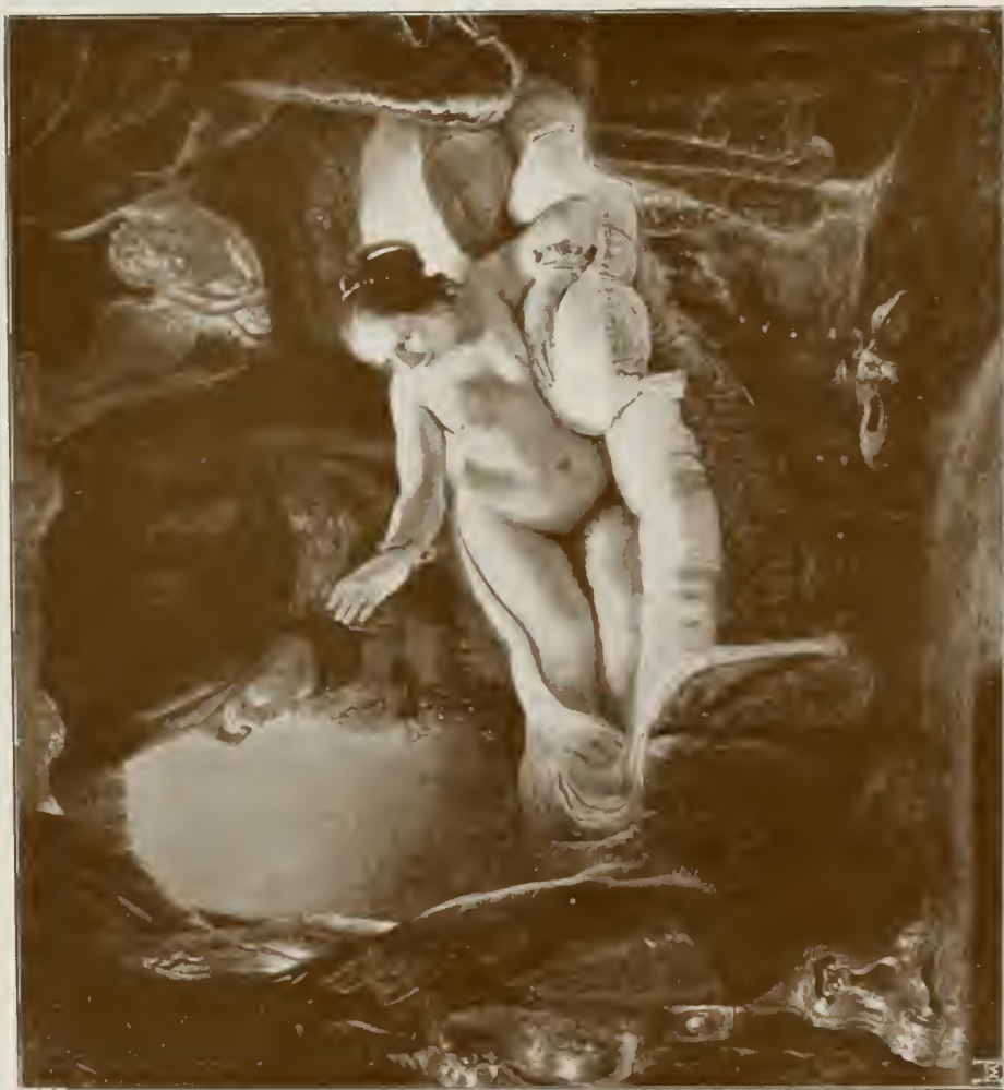
DANAË. Petersburg, Eremitage