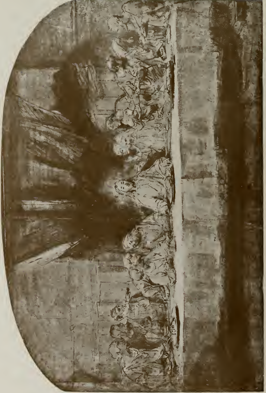
Freie Skizze von Rembrandt nach Lionardo da Vincis „ABENDMAHL“