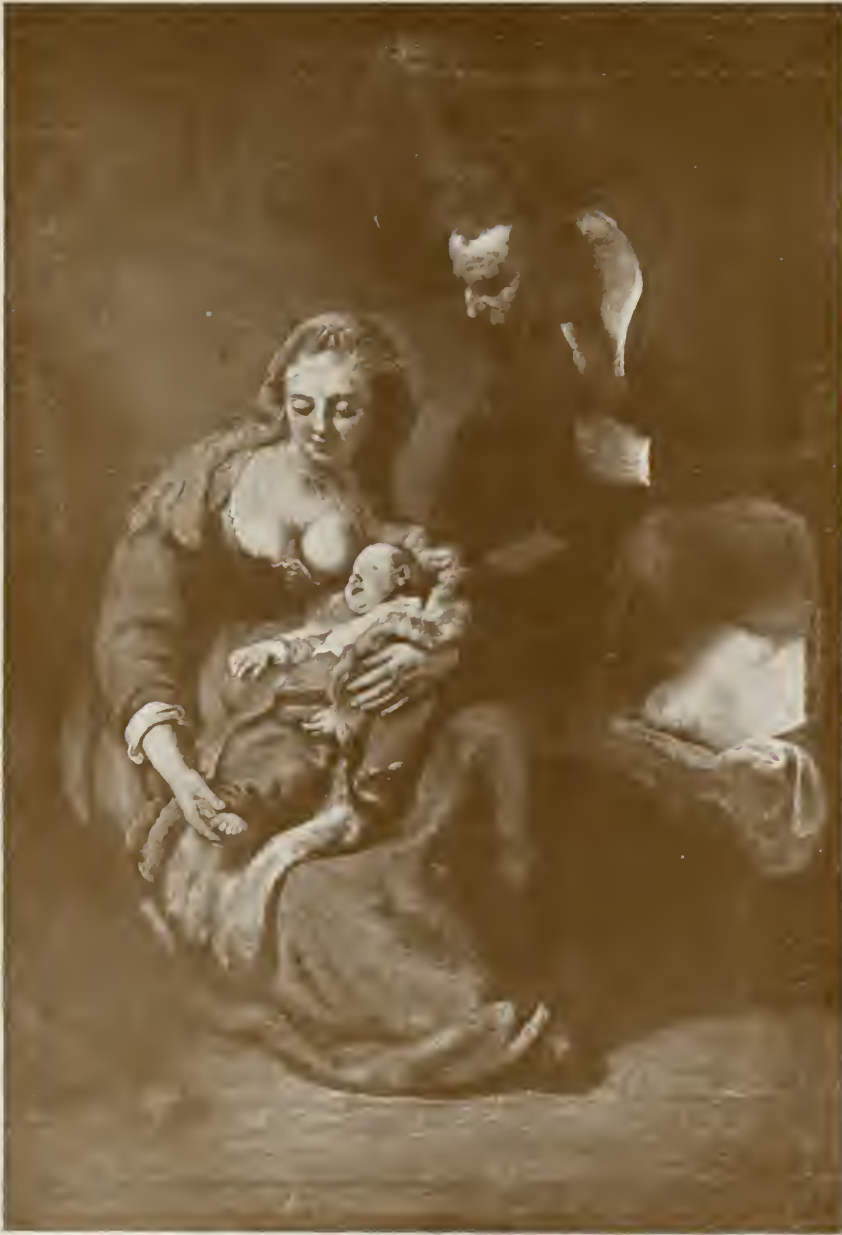
DIE HEILIGE FAMILIE München, Alte Pinakothek