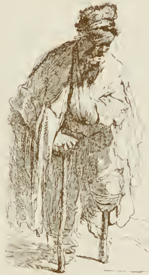
BETTER UND LANDSTRICHER