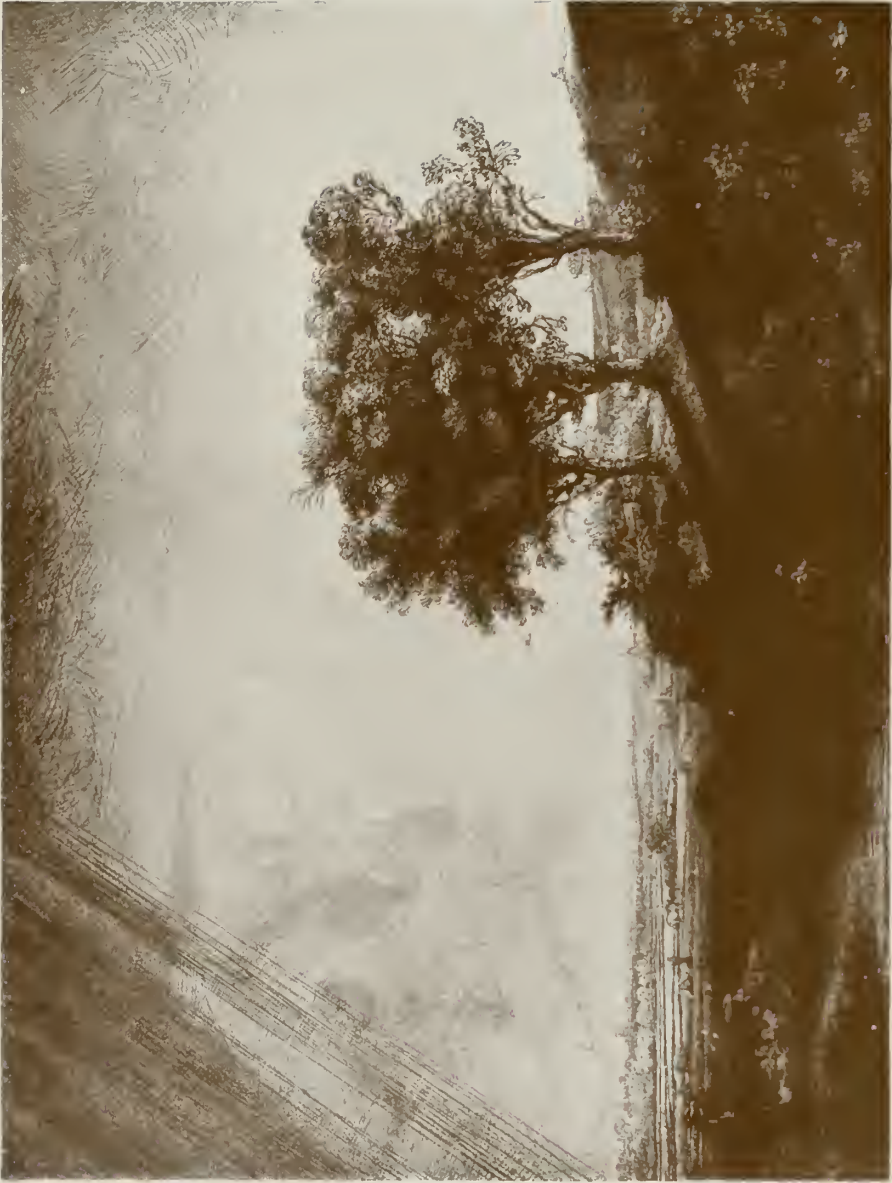
LANDSCHAFT MIT DEN DREI BAUMEN