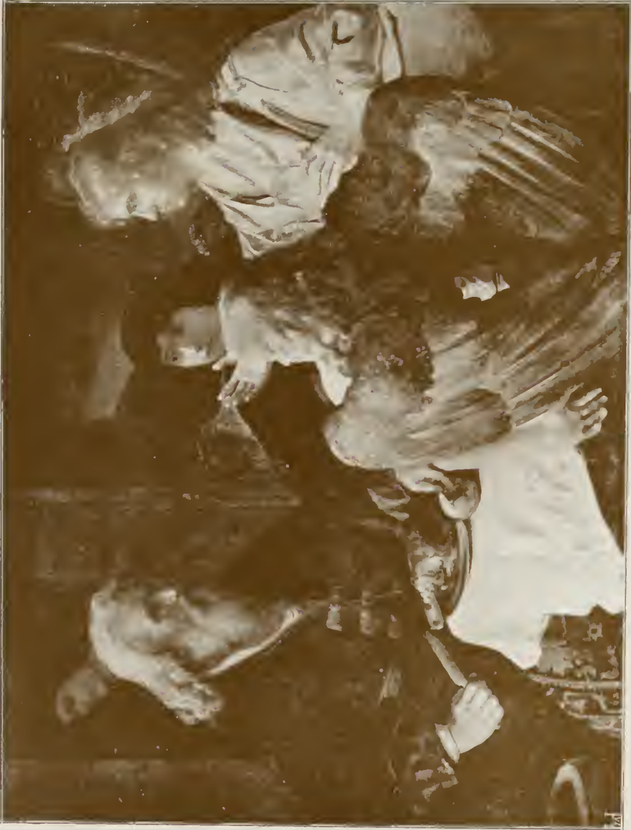
ABRAHAM MIT DEN DREI ENGELN