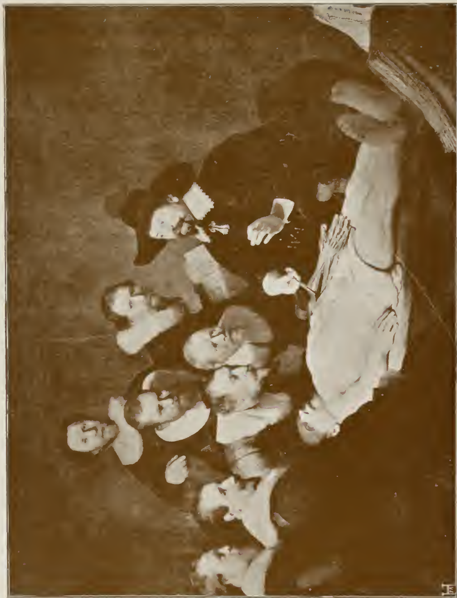
ANATOMIE DES PROFESSORS NIEK, PIETERSZ TULP