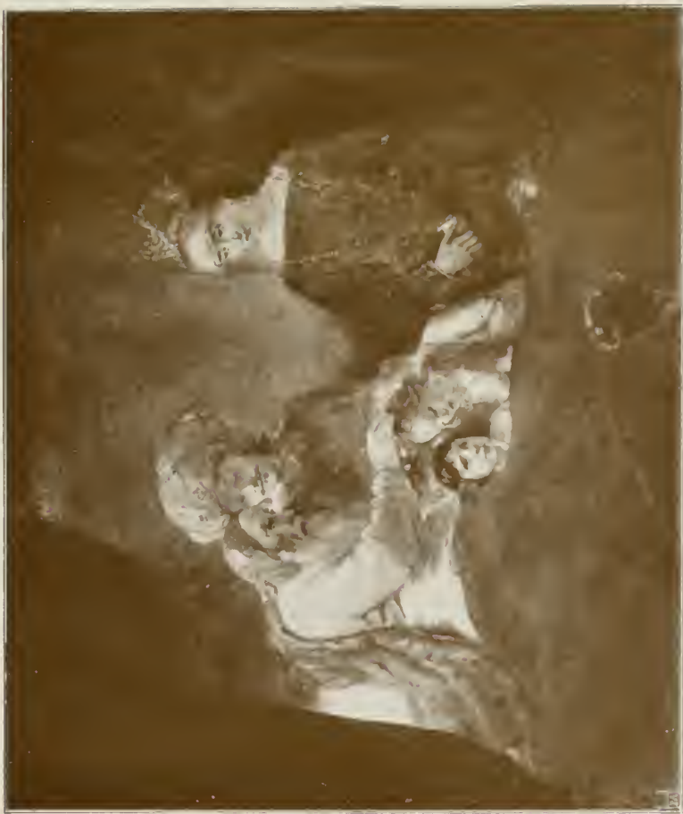
JAKOB SINGERS SÜNE FNKI I MANASSI UND EPHRAIM