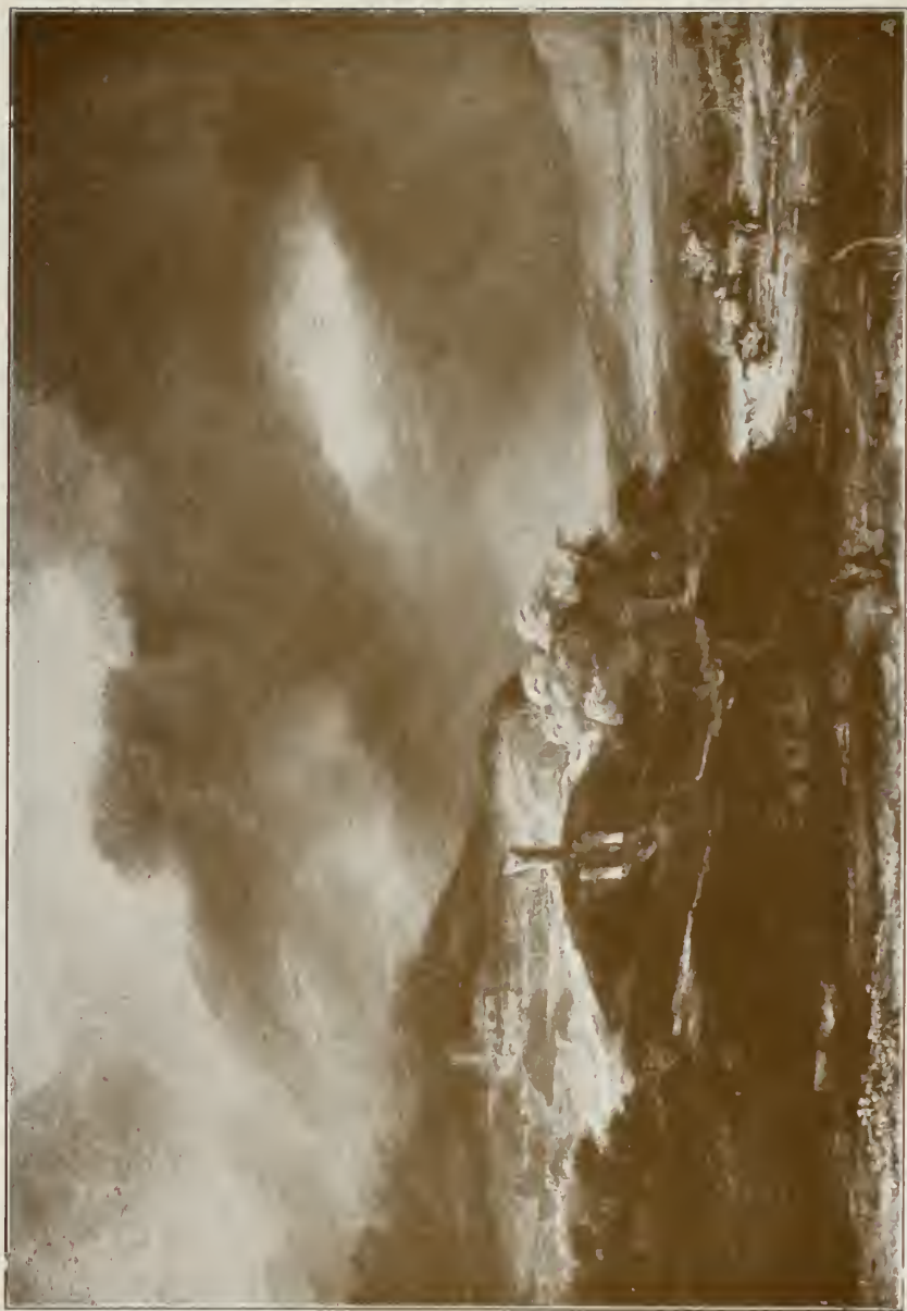
GFWITTLERLANDSCHAFT Braunschweig, Herzogl. Museum