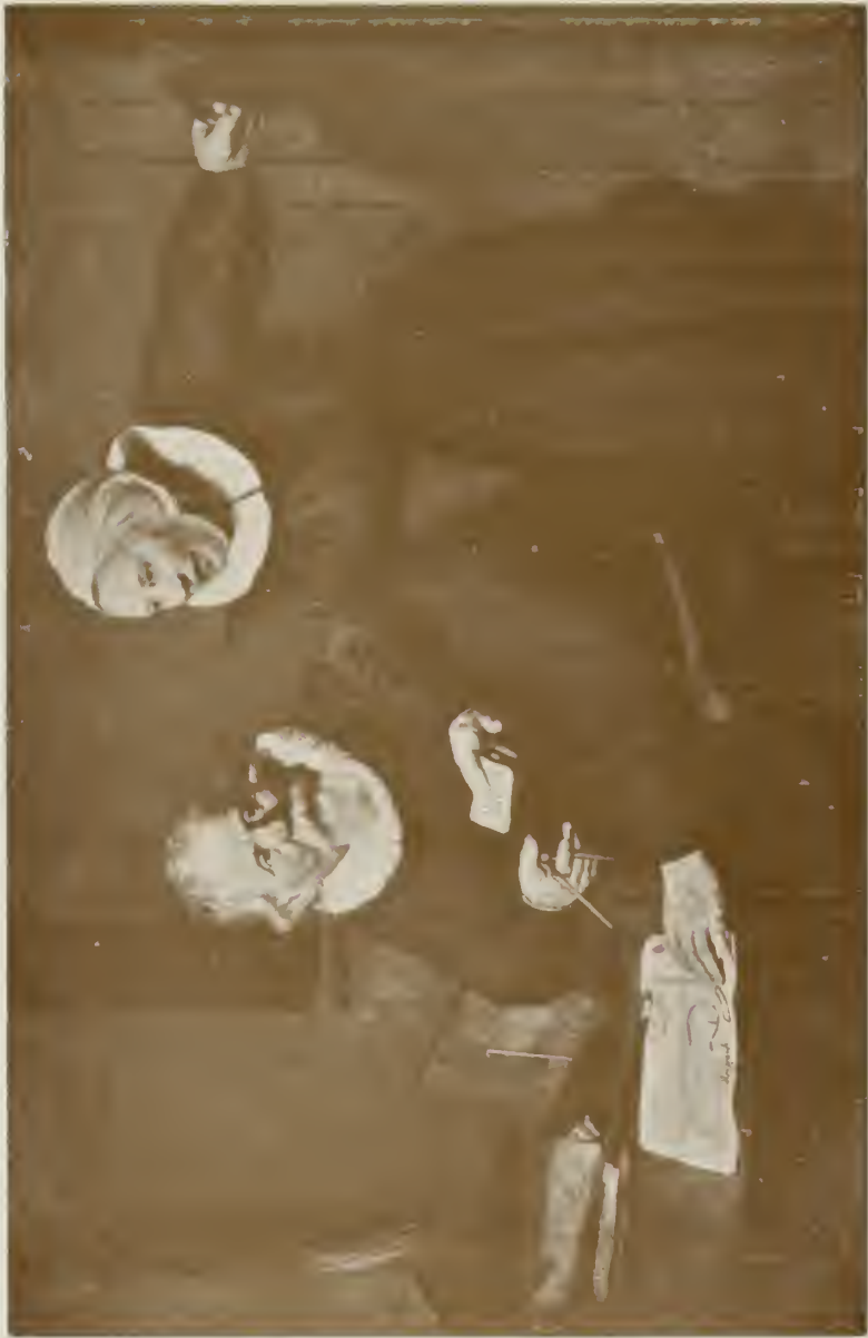
DER SCHIFFSBAU MEISTER UND SEINE FRAU