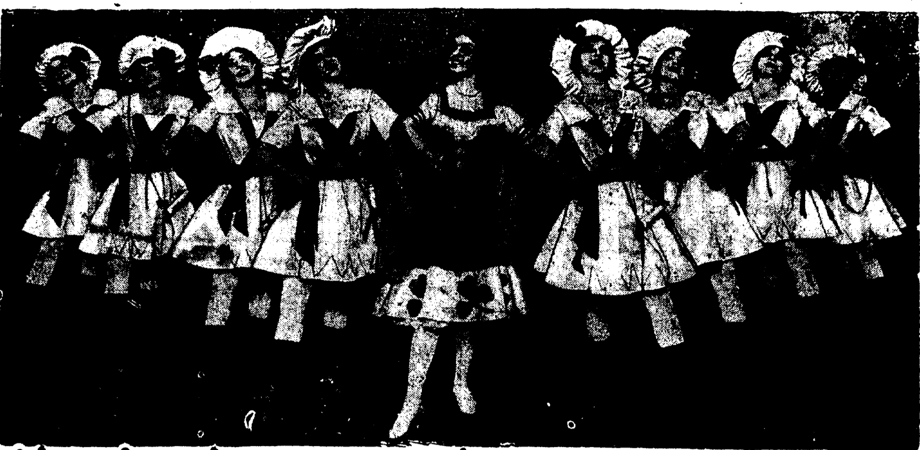
Chœur de Jeunes Filles dans "He pcked Henry", au Crescent.