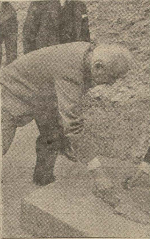
Başbakanımız temel atıyor

Temeli atılan kurum, Ankara'ya fizik ve şimik bakımından duru suyu, bol bol verecek olan süzgeç yapılarıdır.