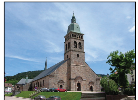
Gérardmer église

L'opération libre est une initiative de huit organisations travaillant autour des outils, licences, contenus et données libres. Elle a pour objectif de démontrer les opportunités de l'ouverture des données et contenus pour les communes à travers une mobilisation inédite sur un territoire pilote.