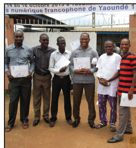
Quelques participants à la formation Afripédia à Yaoundé

En octobre, une nouvelle version de Wikipédia a pu être intégrée au projet. Le Wiktionnaire et ses 2,5 millions d'entrées est dorénavant disponible hors-ligne et a été ajouté aux contenus disponibles pour le projet.