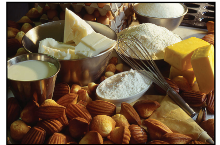
Recette pour la madeleine

Le soutien se fait essentiellement par le biais de formations initiales à la contribution . Les institutions animent elles-mêmes leur projet, et peuvent s'appuyer sur l'association pour obtenir une aide ou des compléments de formation .