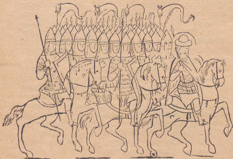
Князь із військом у поході.

нападали добичники — чи то степові кочові племена, чи просто професійні (фахові) розбишаки. Найкраще отже міг торгувати той купець, що зорганізував собі добру охорону своєї каравани (валки), або своїх човнів. Варяги якраз і становили дуже добру воєнну силу й вони були охороною для свого власного товару. Це були отже купці,