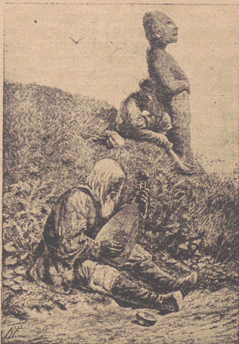
Камяна баба, нагробний пам'ятник кочових степовиків.

Тепер Ігор опанує помалу деревлянську територію на правім березі Дніпра. На південь від деревлян, як знаємо, жили уличі й із ними також