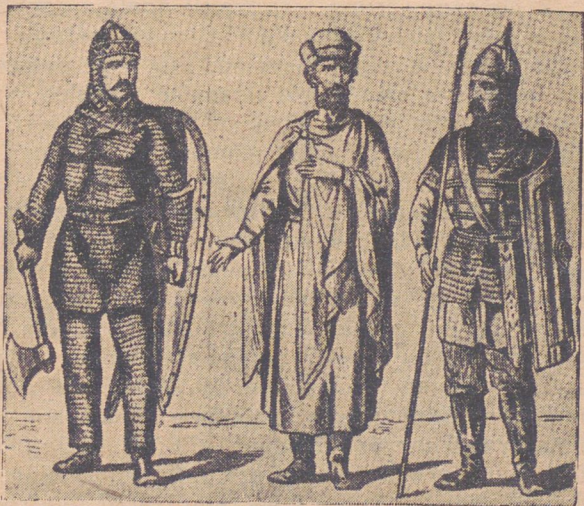
Князь і дружинники.

Як бачимо зі сказаного попередеру, Київська Держава привязувала найбільшу вагу до торговельних справ: князь Ігор старається виєднати для своїх купців якнайкращі торговельні умови