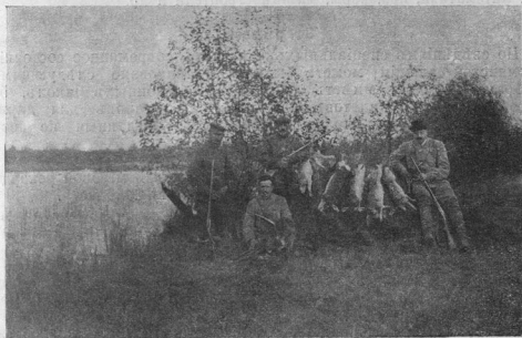
Охотничьи трофеи Орѣховскаго кружка охотниковъ.

Одинъ охотникъ наблюдалъ однажды цѣлую семью кабановъ, которые обѣдали листья и молодые вѣтви белладонны, разводимой, какъ извѣстно, для лѣкарственныхъ цѣ-