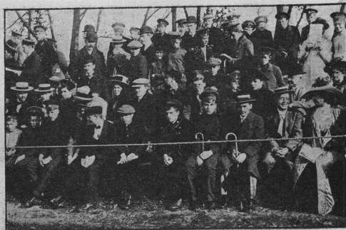
Публика на матчъ „Морозовъ-Британцы“.