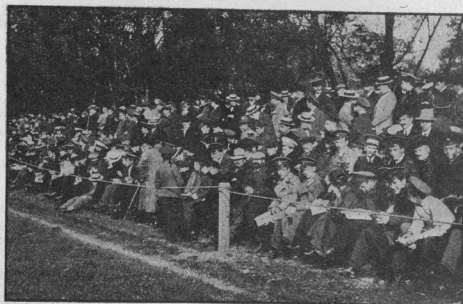
Публика на футбольномъ матчѣ „Морозовцы—Британцы“.

Команда-побѣдительница играла въ слѣдующемъ составѣ: голкиперъ Грингвудъ, беки—Савинцевъ и Мишинъ 1-й,