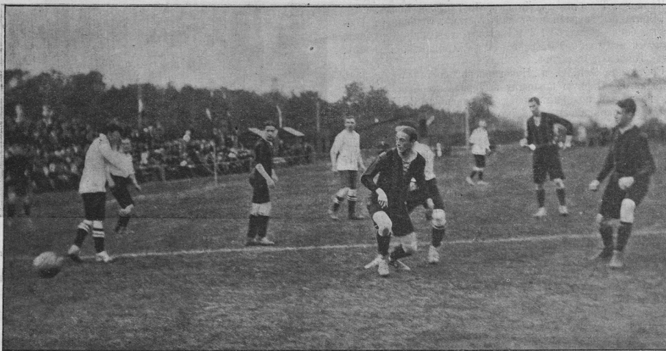
Матч Замоскворецкий клуб спорта—Британский клуб спорта 29-го августа 1912 г.