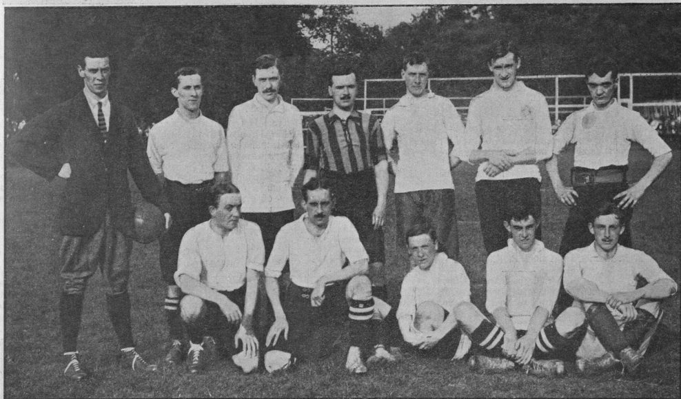
Первая футбольная команда Британскаго клуба спорта, выступающая въ лиговыхъ состязаніяхъ на кубокъ Р. Ф. Фульда.

Въ классѣ В 26-го августа первая команда И. К. С. сыграла у первой команды М. К. Л. (8:0).