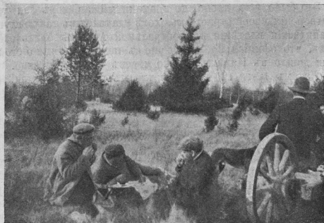
Привалъ охотниковъ Орѣховскаго кружка.

Отношеніе дикихъ звѣрей къ прирученнымъ. Перти пишетъ слѣдующее: „На дворѣ Тюбингскаго коллегіума издавна живъ прирученный аистъ. Однажды на него напалъ дикій аистъ. Прогнанный при содѣйствіи другой домашней птицы, онъ все же неоднократно всвращался въ течение лѣта и вновь нападалъ, но безрезультатно. На слѣдующее лѣто на нашего аиста напали четыре дикихъ аиста, которые также были отбиты. Тогда прилетѣла цѣлая стая аистовъ—птицъ двадцать и прежде чѣмъ мы успѣли притти на помощь, убили его“. То же рассказываетъ Форбесъ про обезьянъ, онъ отпустилъ одну обезьяну на волю. „Ея сотоварищи, пишетъ онъ, все-таки не приняли ее въ свое общество. Онъ видимо чуждался ее отъ-отъ, сомнѣваясь въ ея искренности“.