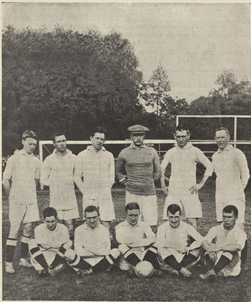
Первая футбольная команда клуба спорта Орѣхова („Морозовцы“), выступающая въ лиговыхъ состязаніяхъ на кубокъ Р. Ф. Фульда.