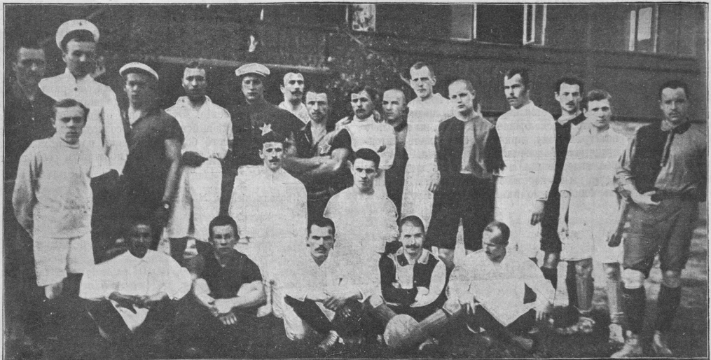
Футбольныя команды Новенскаго общества физическаго развитія и спорта „Орель“ (въ свѣтлыхъ костюмахъ) и виленской футъ-болъ-лиги (сборная, въ полосатыхъ костюмахъ).

Часто причиной остановки роста бываютъ всякія скверныя привычки. У мальчиковъ таковой является рано начатое куреніе, у дѣвчонокъ — ношеніе корсета. Сдавленность внутреннихъ органовъ и неправильная циркуляція крови, являющаяся слѣдствіемъ ношенія корсета, не могутъ, конечно, не отзваться на ростѣ самымъ губительнымъ образомъ.