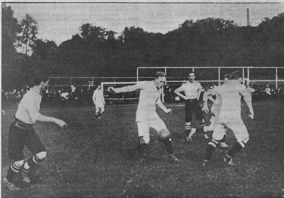
Матчъ «Морозовцы» — «Британцы» 26-го августа 1912 г.