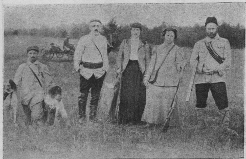
Изъ жизни Орѣховскаго кружка охотниковъ.