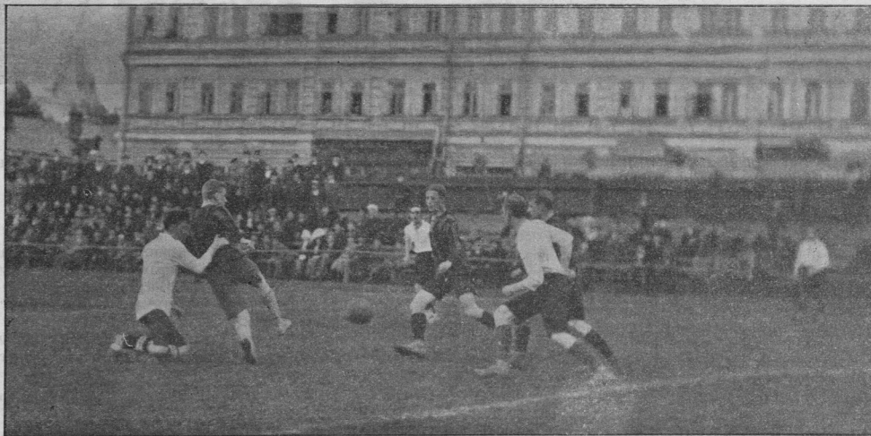
Матч Замоскворецкий клуб спорта—Британский клуб спорта 29-го августа 1912 г.

Въ воскресенье, 19-го августа, на полѣ Коломенского гимнастическаго о-ва (при ст. „Голутвино“) состоялся футбольный матчъ между 1-й командой К. Г. О. и сборной командой „Вся Коломна и окрестности“ со следующимъ результатомъ. Первый хавтаймъ 2:0 въ пользу К. Г. О. и второй хавтаймъ 6:0 въ пользу К. Г. О., об-