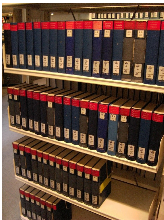
《德意志人物誌》全套叢書，共有 56 卷

基文庫本身正式獨立的時間點，早在德語維基文庫於 2005 年自維基文庫孵育場（ wikisource.org ，時為 sources.wikipedia.org ）分離之前就已經開始。儘管費時 15 年之久，本計畫仍較當年初版《德意志人物誌》紙本出版的速度快上許多，後者整整花了 37 年，自 1875 年一路到 1912 年才出版完畢。在本計畫進行的同時，另