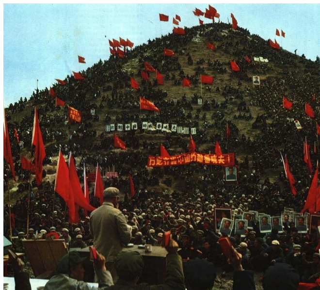
批鬥時任中華人民共和國主席劉少奇的群眾會議， 刊登於《人民畫報》1967年7月號

著名的中文文革論文集有文革三十周年會議論文集《紅色革命和黑色造反》、文革四十周年會議論文集《文化大革命：歷史真相和集體記憶》、文革五十周年會議論文集《文革五十年：毛澤東遺產和當代中國》，都是當時中文文革研究的頂峰，但裡面的論文並不像經過了同行評審的樣子，似乎亦不滿足《可靠來源指引》的要求。我的看法是：……嘛，現在並無人引用，還是到時看情況再說吧。類似的論文集還有2019年出版的啟之主編《中華學人文革論文集》四卷。