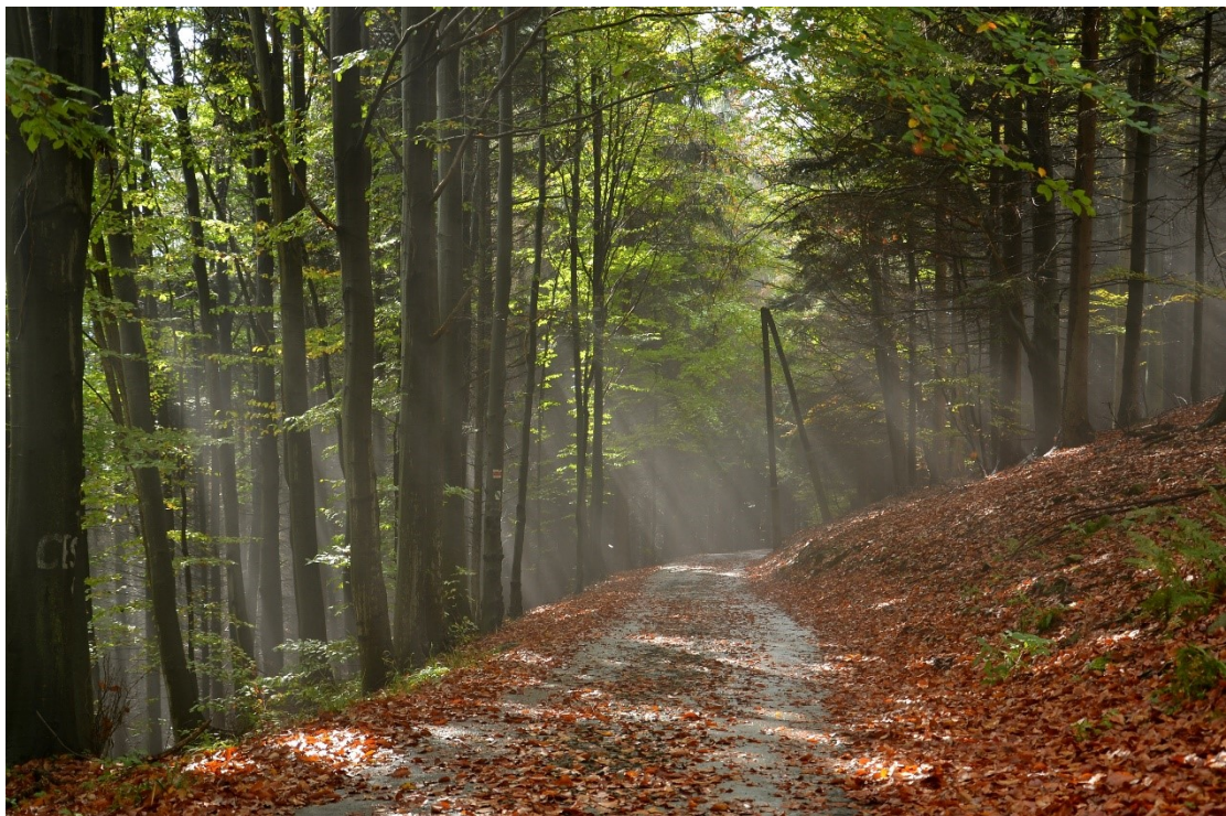
位於捷克摩拉維亞—西里西亞州斯萊斯基貝斯基德的騎士步道，攝於 2014 年