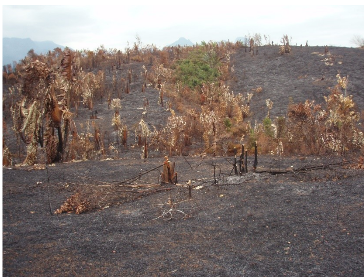
因農耕需求火耕破壞的森林，攝於馬達加斯加

環境人類學學者不僅嘗試了解環境問題，研究人類活動的汙染、人類與生態的關係（包括人類對於地方生態系的管理、開發與威脅等等）以外，也試圖找出解決問題的方法。1960 年代左右，人類學中的一個子領域「生態人類學」(ecological anthropology) 或稱「文化生態學」(cultural ecology) 逐漸興起，這一次領域關注於文化如何實踐與融入人類、適應環境以及維持其生態體系，而研究原住民活動對於生態環境的資源分配、規劃與祭祀活動等文化，以及對於環境