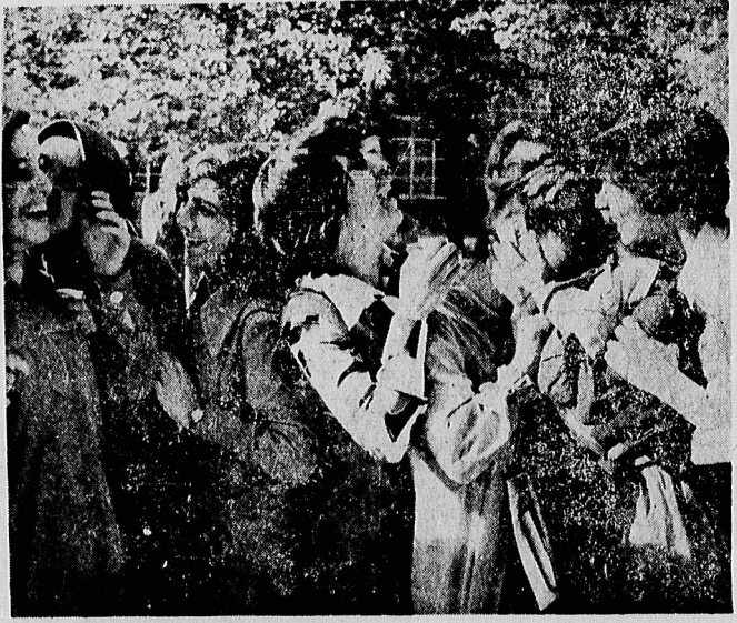
نخستین روز درس در اولین سال تحصیلی جمهوری اسلامی ایران .. امید است برنامه ها چنان باشد که علاوه بر علو فنون فرزندان ما آزادی و شرف وین به استبداد و استعمار نژادان را نیز با تمام وجود بیاموزند. در صفحات ۱۲ و ۱۳

اگر پادشاه مراکش پوزش نخواهد ایران روابط دیپلماتیک خود را با این کشور تزلزل میدهد در صفحه ۱۰