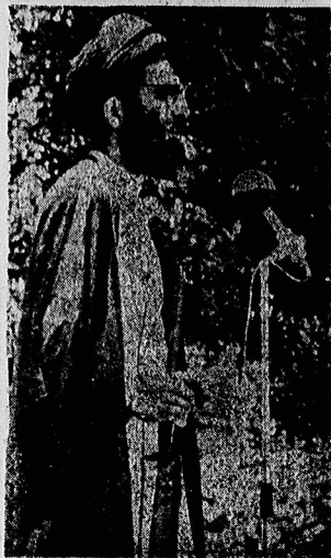
حجت الاسلام خامنه‌ای در نماز جمعه تهران:

شنبه ۳۱ خرداد ماه ۱۳۵۹ - شماره ۱۶۱۷۰ - نشریه ۱۵ دیال