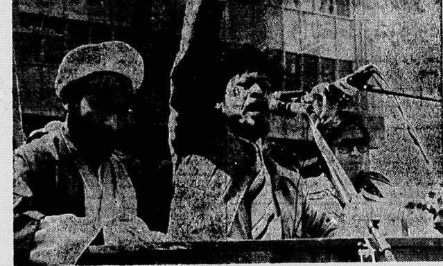
گروهی از مسلمانان جنوب فیلیپین در مراسم دعا برای امام خمینی شرکت کرده‌اند.

مسلمانان فیلیپین، تنها راه ایجاد مدارس اسلامی می‌بینند.