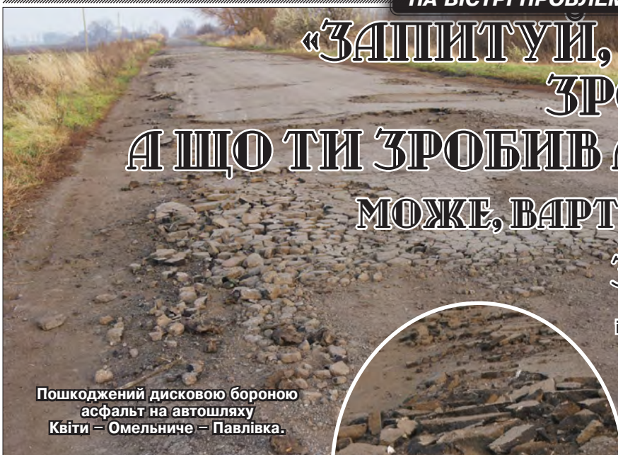
Пошкоджений дисковою бороною асфальт на автошляху Квіти — Омельниче — Павлівка.