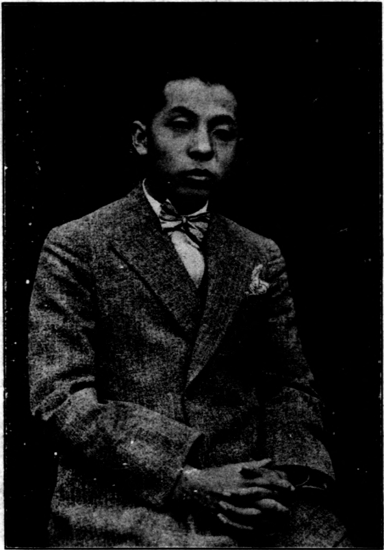
張 校 長 像