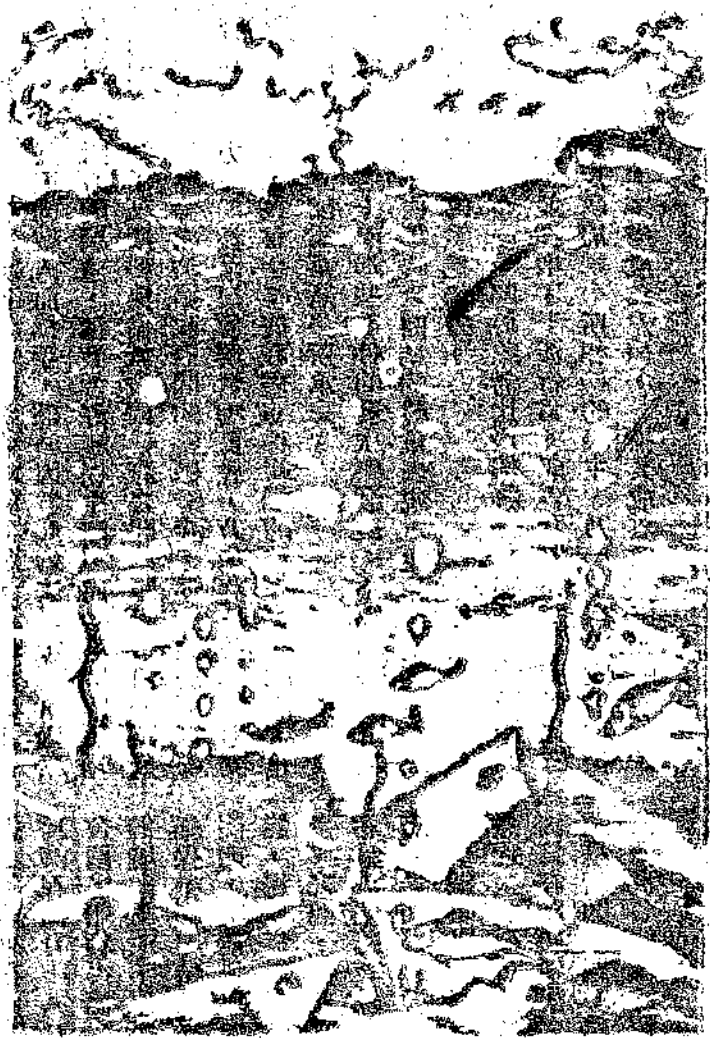
！帥統軍艦洋平女告報