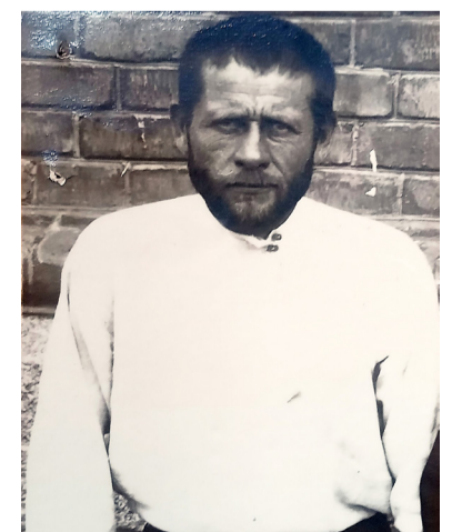
Дж.: Державний архів Кіровоградської області. – Ф. П-5907. – Оп. 2р. – Спр. 10834.