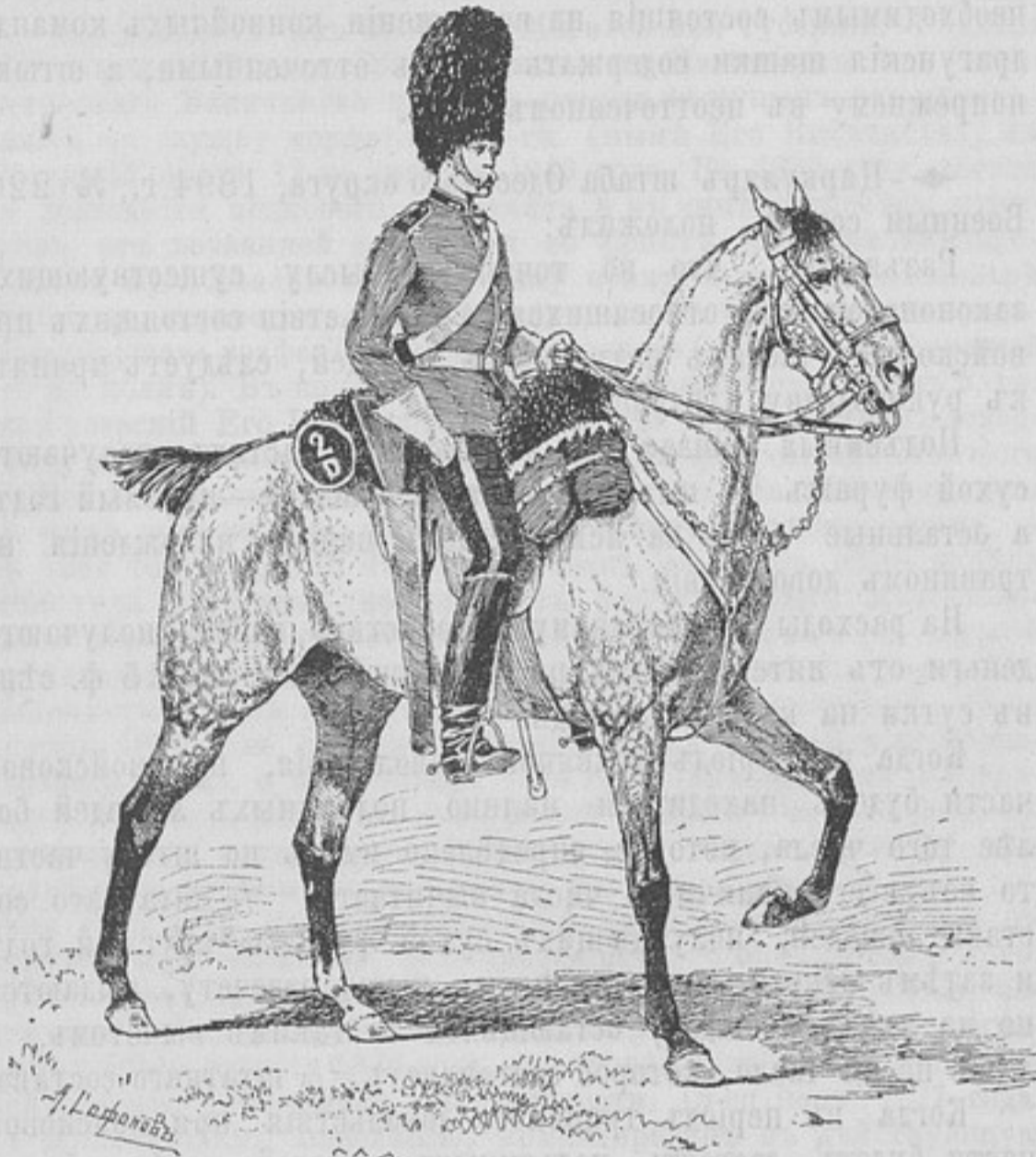
Драгунъ 2-го англійскаго полка.

Проведя еще 10 лѣтъ во Фландріи почти постоянно въ бояхъ и стычкахъ, полкъ вернулся въ родную Шотландію, а съ 1742 по 1747 годъ снова появился въ Нидерландахъ и при Деттингенѣ овладѣлъ еще однимъ французскимъ гвардейскимъ знаменемъ. Семилѣтняя война привлекла «Сѣрыхъ» въ Германію и дала имъ случай отличиться во многихъ крупныхъ и мелкихъ дѣлахъ. Въ 1793 и 1794 гг. они еще разъ были во Фландріи подъ начальствомъ герцога Йоркского и затѣмъ не появлялись на поляхъ сраженій до іюня 1815 года, когда подъ Ватерлоо ces terribles cheveux gris (эти страшные сѣрые кони), какъ называлъ ихъ Наполеонъ, отняли у 45-го французскаго пѣхотнаго полка отчаянно защищаемого орла. Въ память этого подвига французскій орелъ съ надписью: «Ватерлоо», украшаетъ штандартъ и головные уборы полка.