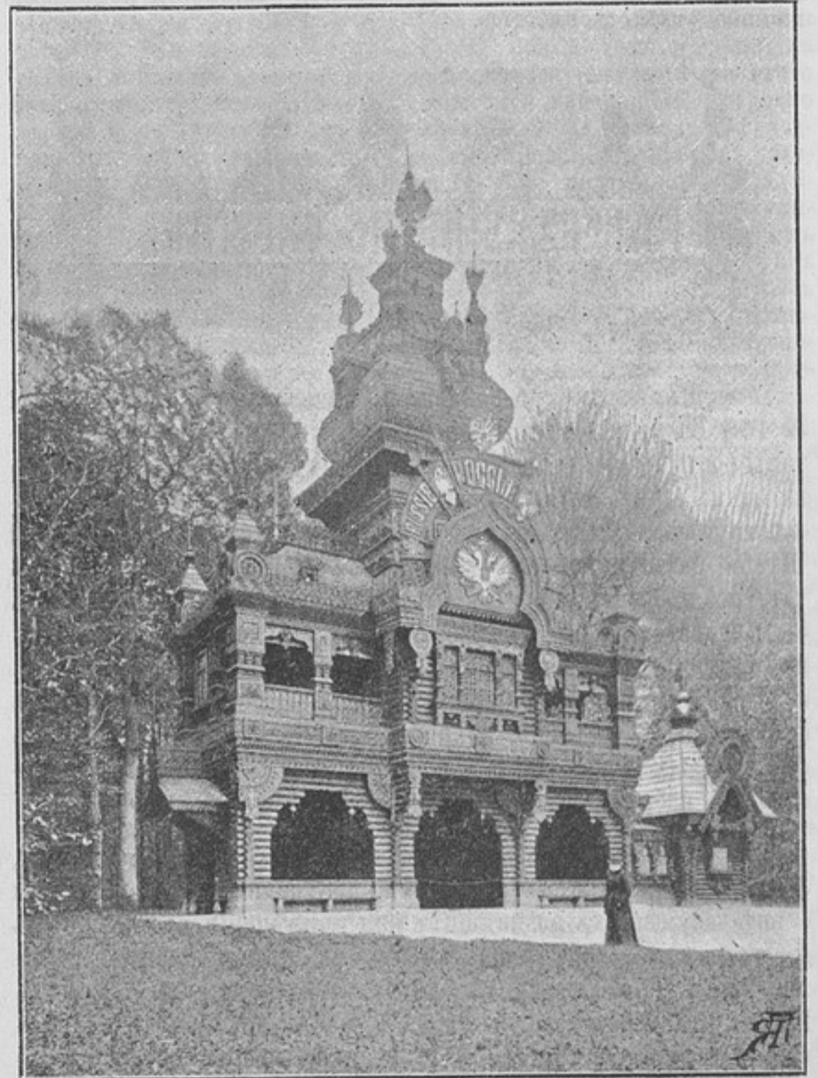
Русская изба въ Фреденсборгѣ.

Замокъ состоитъ изъ центрального двухъ-этажнаго зданія и двухъ одноэтажныхъ флигелей въ видѣ длинныхъ боковыхъ полукруглыхъ крыльевъ.